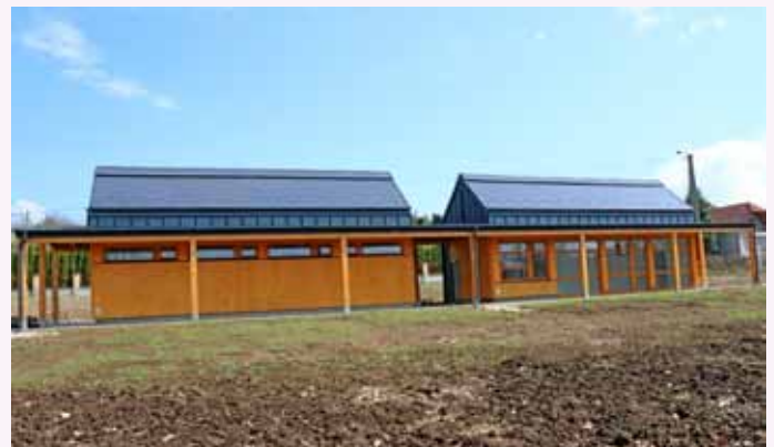
A rendezvénytéren már csak a tereprendezés és a szennyvízbekötés hiányzik.