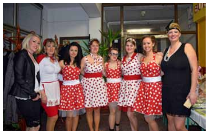
Az anyukák jelmeze és tánctudása magával ragadta a bálózók figyelmét