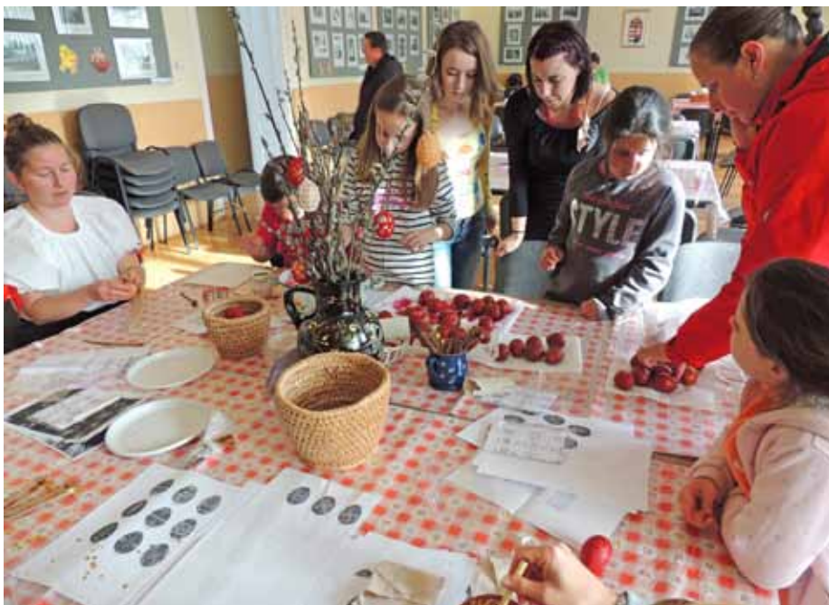
A régi világban a tojásfestés mintáinak üzenete, varázsereje volt

Lehet az táncház vagy egy elmélyült ima, esetleg egy csobbanás a medencébe, ki hogy éli meg, mindegy is. Az ünnep kimozdít a mókuserékből, egy pillanatra megállít a rohanásban, elgondolkodásra ad időt, reményt ad. Nincs más dolgunk, csak megnyitni szívünket és befogadni a remény madarát!