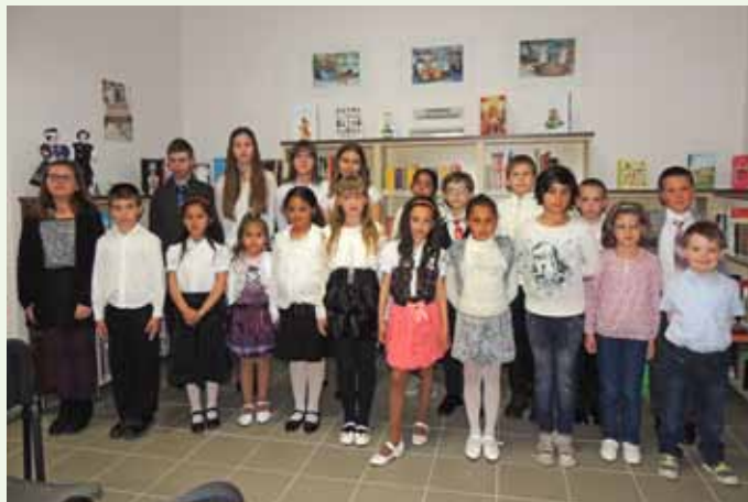
A gyerekek szép szavatokkal ajándékozták meg a közönséget

Szép szavakat hallhattunk az óvodásoktól, a helyi általános iskola tanulóitól, középiskolások közül csupán egy tanuló vállalkozott arra, hogy a számára legkedvesebb verset bemutassa. A magyar költészet nagy alakjainak- Petőfi Sándor, Arany János, József Attila - verseit szavalták a gyerekek, de hallhattunk kortárs költők műveiből is. Jó volt látni és hallani, hogy a költészet varázsa a legkisebbeket is megérintette.