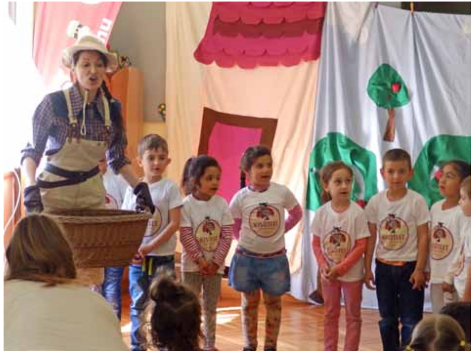
Óvodásaink lelkesedéssel várják a kéthetente sorra kerülő változatos programokat, feladatokat

A rekordlétszámú jelentkezésből (216 fő) adódóan a köszöntők és a műsorszámok a központi konyha éttermében kaptak helyet.