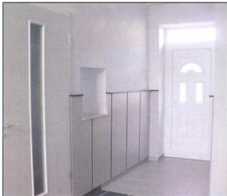
Szép környezet várja az ügyfeleket a Polgármesteri Hivatalban