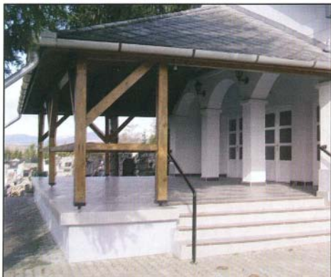
A felújított ravatalozó épülete

tó azonosító jelével ellátott 120 literes zsákokat megvásárolni. Amennyiben az ingatlantulajdonos, használó a megadott határidőig elmulasztja a szolgáltató azonosító jelével ellátott 13 db zsák megvásárlását, köteles az adott naptári évben fél évig igénybe venni a települési szilárd- hulladék szállítást a 120 literes gyűjtődényre megállapított áron. A tárgyévben megvásárolt zsákok a tárgyévben használhatóak fel.