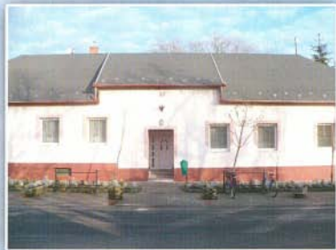
A felújított Polgármesteri Hivatal