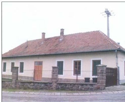
A 150 éves épület ma diákzsellőként működik

Az 1800-as évek második felében a bogácsi iskola első épülete a maga egyszerűségével, vastag falával védelmező bástyaként óvta növendékeit. A védelemre szüksége is volt a mezítlásban, szegény emberek gyermekeinek, akik idegenkedve lépték át a tudás méltóság-teljes kapuját. A paraszti élethez szokott gyerekek szorgalmasak voltak: a mezei munkában és a ház körüli munkában a felnőttekkel együtt megvívták a mindennapos élet küzdelmeit. Ezt a szorgalmat vitték magukkal az iskolába is.