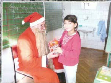
A Mikulásnak örültek a gyerekek