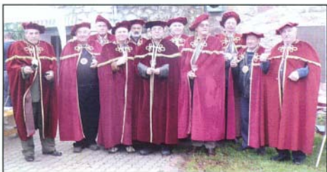
A Szent Márton Borrend tagjai

A jövőre vonatkozóan szeretném, ha a tájegységünkön induló projekteknek alkotó résztvevői lennénk – gondolok a