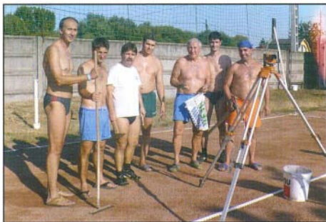
A Lábtenisz Szakosztály tagjai újították fel a salakos pályát

Ezúton szeretnék köszönetet mondani mindazoknak, akik támogatták mun-