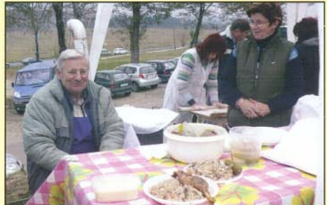
Márton-napi finomságok és készítőik