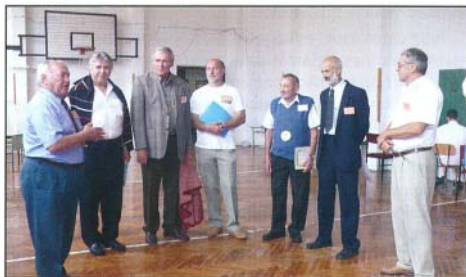
A legszebb szőlőültetvényért járó oklevelek átadása