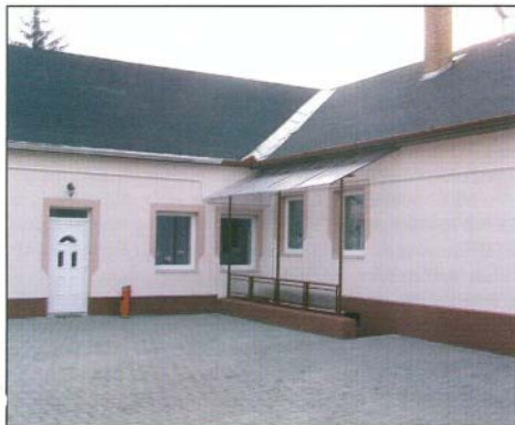
A Polgármesteri Hivatal udvara is megszépült

Az üdülőingatlanok tulajdonosa/használója, amennyiben nem veszi igénybe a szolgáltató gyűjtődényét, úgy a szolgáltató – azonosító jelével ellátott – 120 literes zsákokat vehet igénybe. A szolgáltató azonosító jelével ellátott 120 literes zsák igénybe vétele esetén az ingatlantulajdonos (használó) köteles, tárgyév április 30-ig minimum 13 db, a szolgálta-