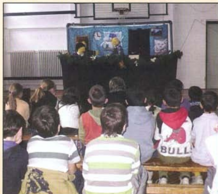
A karácsonyi történet lekötötte a gyerekek figyelmét