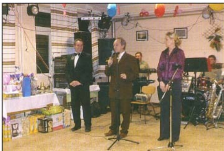
Jó szórakozást kívánok a bál szervezői és védnöke