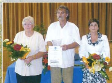
Aug. 20-i kitüntetettek