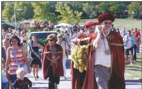
Szűret felvonulást nagy érdeklődés kíséri

A Bogácsot körülölelő dombok lejtőin már évszázadok óta természetesen szőlőt. Voltak olyan időszakok községünk történelmében, amikor földművelésből, elsősorban szőlőtermesztésből élt meg az itt élő ember. Mára sokat változott a falu élete, amire nemcsak a fürdő léte ad magyarázatot, hanem napjainkban az egész világon érezhető gazdasági válság. Évtizedekkel ezelőtt még művelt szőlőültetvények állnak műveletlenül Bogács határában is, magasak a művelési költségek, alacsony a felvásárlási ár, nincs piac.