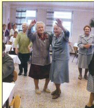
Így mulattak a 90 évesek