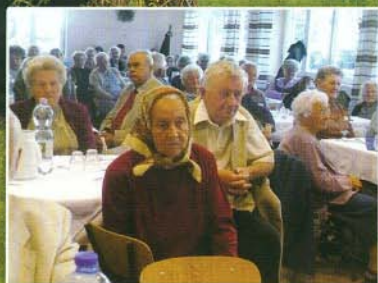
Száz idős bogácsi lakos ünnepelt az iskola ebédlőjében