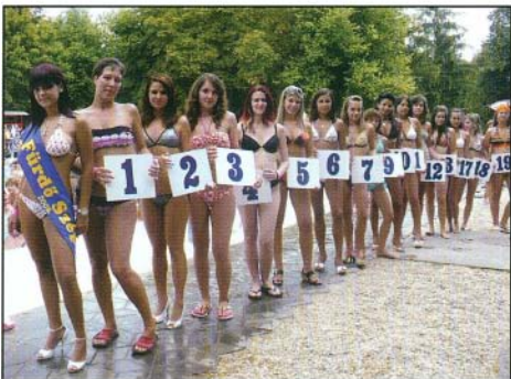
A Fürdő Szépe verseny résztvevői