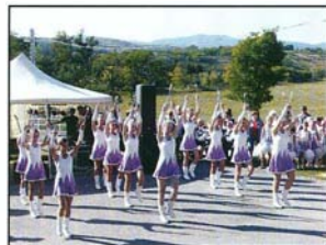
A mazsorettesek műsora