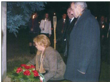
Koszorúzás az óvoda előtti emlékműnél