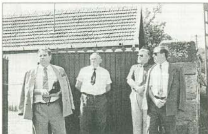
Tájház avatása a Szomolyai úton.