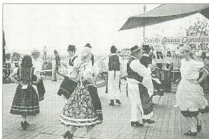
Magyar Kulturális Napok Ogradzieniecben.