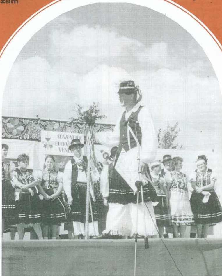
Hagyományörző Együttes a Vigh Rudolf Díj 1996. évi kitüntetettje