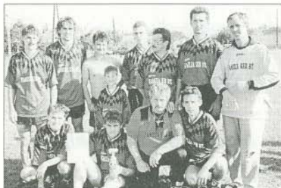
A kispályás labdarúgó-bajnokság győztes csapata a bogácsi páston.