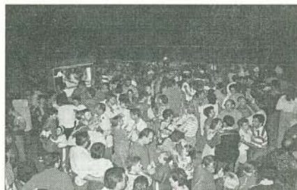
Lengyel Kulturális Napok augusztus 2–4. Esti táncmulatság a pincesoron.