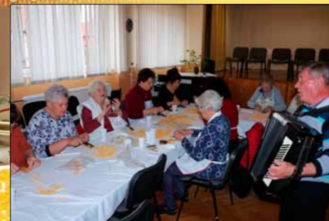
Éneklés közben a munka is könnyebbnek tűnik