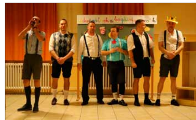
Az apukák rosszcsontról óvodások parádiája az est egyik fénypontja volt