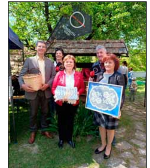
Noszvaj, Bogács és Szomolya polgármesterei a községükben előállított helyi kézműves termékekkel gazdagították a Kincsesládát.