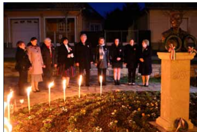
Nemzeti ünnepünkön a Fialatok terén énekelték a Bogácsi Pávakör tagjai