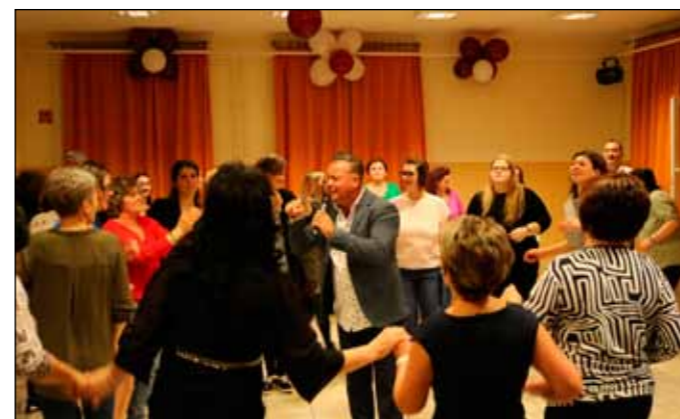
Hazánk egyik legnépszerűbb mulatós sztárja, Sihell Ferry remek hangulatot teremtett a bál kezdetén