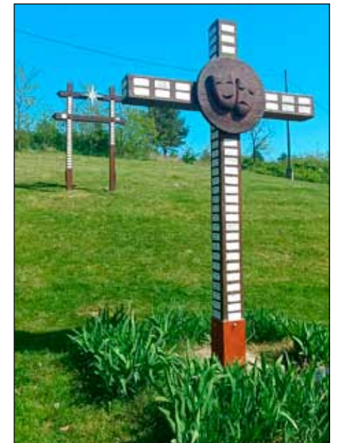
Az emlékfákra 200-tól több színészóriás neve olvasható