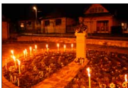
Fáklyák fénye világítja meg a „lánglelkű költő” mellszobrát

Este a Községi Házban folytattuk a megemlékezést. Csendesné Farkas Edit polgármester asszony ünnepi beszéde után a Bogácsi Amatőr Színjátszó Csoport kulturális műsora következett. Előadásukban hazafias énekek, versek bemutatását követően a Petőfi szülei című színjátékot tekinthette meg az ünneplő közönség. A színjátékból megtudtuk, hogy az 1848. március 15-ei pesti és