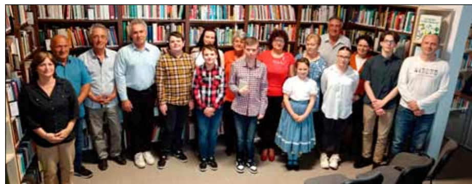
A legkedvesebb verseiket bemutató irodalomkedvelők

A költészet varázsa érintette meg az óvodásokat másnap, április 11-én is, amikor könyvtári foglalkozás keretében ismerkedhettek meg magyar költők gyerekverseivel és oldottak meg játékos feladatokat.