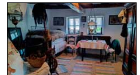
A régmúlt lakáskultúráját bemutató szoba