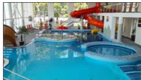
A fedett élményfürdővel és szaunavilággal kibővült fürdőnk egész évben biztosítja a feltöltődést