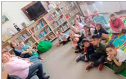
A könyvtári látogatás kis lépés az olvasóvá nevelés megalapozásában

Szeretettel gratulálunk minden kisgyermeknek! Biztatom őket a további versmondásra, és a többi kis társukat is arra, hogy tanuljanak verseket és legyenek bátrak, nyitottak az önkifejezés ezen formájára ők is.