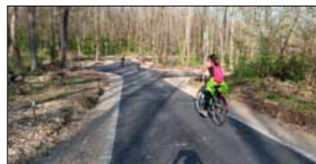
A kerékpározás szerelmeseinek örömeire elkészült a Bogács – Szomolya közötti kerékpárút

Az önkormányzati vagyonnal való gazdálkodást is valamennyien fontos feladatnak tartottuk, több ingatlant vásároltunk, pl. a Thermál Szálló épületét, vagy a Szarvas út 2. sz. alatti ingatlant, melyeket a fürdő fog hasznosítani, de megvásároltuk a Takarékszövetkezet épületét is kedvező áron, ezt