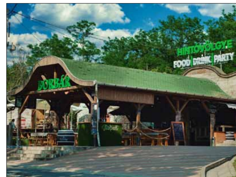
A Hintóvölgye Retro Terasz Club & Étterem finom ételekkel, borokkal és változatos szórakoztató programokkal várja vendégeit

A pincesoron főszezonban hétfévente egy nap alatt akár 1000-1500 főt is kitehet a turistalétszám. A zenezolgáltatás a teraszokon 24:00-ig engedélyezett, az éjszakai szórakozás a pincékben pedig 03:00-ig. Az esték és éjszakák nyugalma a közterületeken az önkormányzattal közös biztonsági szolgálat biztosítja, emellett a rendőrség és a polgárőrség is megerősített szolgálattal járul hozzá a közbiztonság fokozásához.