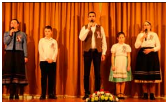
„Isten uja megérintett” bennünket a fiatalok szép előadását hallgatva