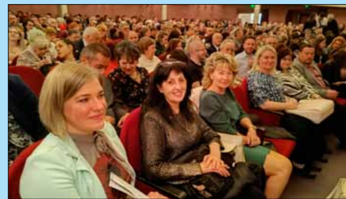
Előkelő helyekről, az első sorokból nézhettük az előadást

2024. március 30-án, húsvét ünnepének előnapján a Miskolci Nemzeti Színházban a Jézus Krisztus Szupersztár című előadást tekintette meg az a 49 fő, aki jelentkezett a helyi önkormányzat felhívására. Régen volt már ehhez hasonló közös színházlátogatás,