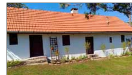
A felújított bogácsi Tájház

A háromszatú parasztház minden részének megvolt a sajátos rendeltetése. Középső részen található az egyetlen bejárat, mely a pitvarba, az előtérként és konyhaként is működő helyiségbe vezet. Itt tekinthetjük meg a nagy méretű szabadkéményes konyhát, a mennyezetbe beépített nyílt füstelvezetővel. A konyha és a pitvar között boltíves válaszfal húzódik, a boltív azonkívül, hogy esztétikai látványt nyújt, praktikus is volt, ugyanis felső része megakadályozta, hogy füst a pitvarba jusson. A boltív tányérok függnek, a falat kézzel hímzett rajzos, egyszerű rímpárokból álló szöveges falvédők díszítik. A szabadkémény régen nem csak a füst kivezetésére, de a malacölés utáni füstölésre is tökéletes volt.