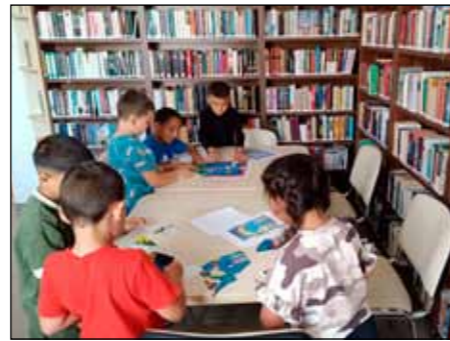
Az elsős gyerekek csapatokban oldották meg a versekhez kapcsolódó feladatokat

A költészet napja alkalmából látogattak el az első osztályosok is a könyvtárba. József Attila, Petőfi Sándor, Móricz Zsigmond, Weöres Sándor, Nemes Nagy Ágnes és Osváth Erzsébet egy-egy gyermekeknek szóló költeményét nagy érdeklődéssel hallgatták és szavalták a tanulók, meglévő ismereteiket bővítve új információkat szereztek, és aktívan vettek részt a tevékenkedtető feladatok megoldásaiban.