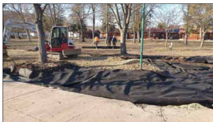
Dréncsővezetés és geotextília borítás a fürdő területén

Örömmel jelenthetem, hogy a fürdő egy energetikai pályázatot is elnyert, amelynek köszönhetően további fejlesztéseket tervezünk: napelemek telepítését, automatizálási fejlesztéseket, tartalék termálkút fúrását, valamint egyes medencék vízforgató rendszerének cseréjét.