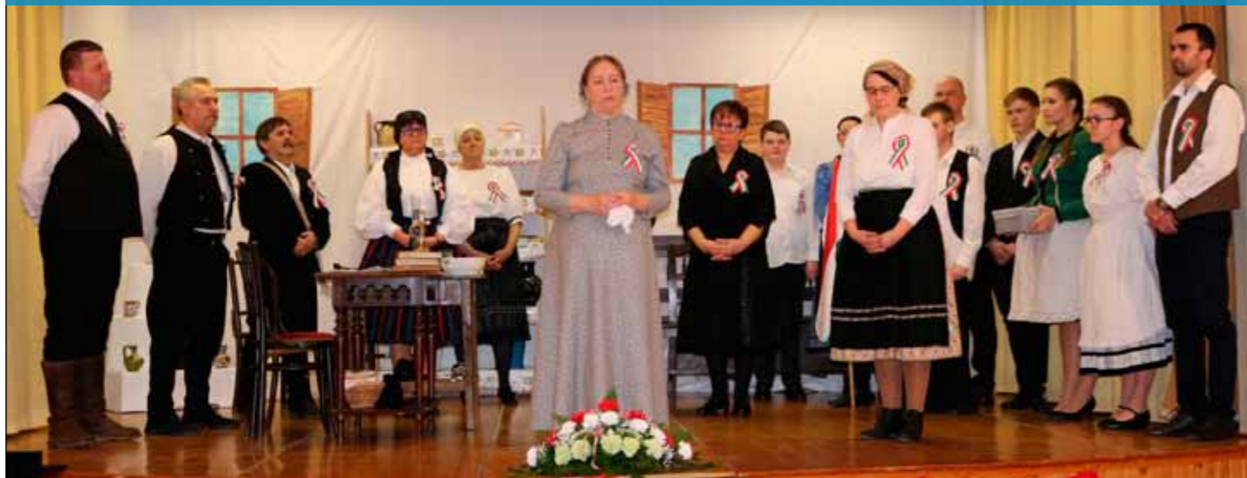
Időutazás történelmünk dicső napjaiba - Petőfi szülei című színjáték a Bogácsi Társulat előadásában

2024. március 14-e Bogácson az 1848/49-es szabadságharc hősei előtti tisztelgésről szólt. Ezen a szép tavaszi napon mindannyian kokárdát tűztünk szívünk fölé, és történelmünk nagyjaira, azok hőstetteire emlékeztünk.