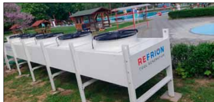
Aszályos időben különösen felértékelődik a hűtőtorony megléte

Korábban már bejelentett turisztikai pályázat keretében ez év végén a fürdő területén zajló fejlesztések is elkezdődhetnek. A tervek között szerepel egy új vízi játszótér csúszdákkal és további vizes attrakciókkal, az egyik ikermedence élménymedencévé alakítása, valamint az ikermedencék és a pillangó medencék részleges fedése. Ezen kívül egy új vizesblokk is építésre kerül.