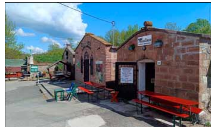
Zenés vendéglátóhelyek és borozók jól megférnek egymás mellett

Borozók: Muslinca, JaSo, Kompa Pince, Szent Borbála, AZ Pincészet, Szajlai Pince, Csáter Apó Pincéje, Judit Pince, Viktor Bácsi Pincéje, Rudolf Pincészet, Nagy László Pincéje, Dósa Pince, Gál Pince