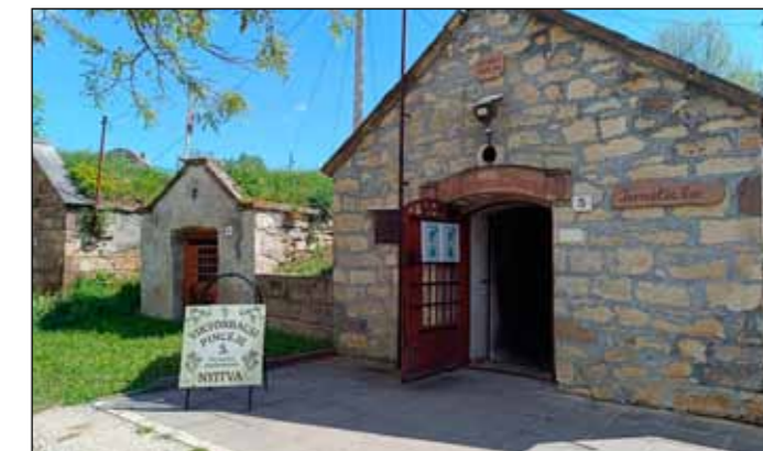
Viktor Bácsi Pincéje hűen őrzi a régi pincésori hangulatot