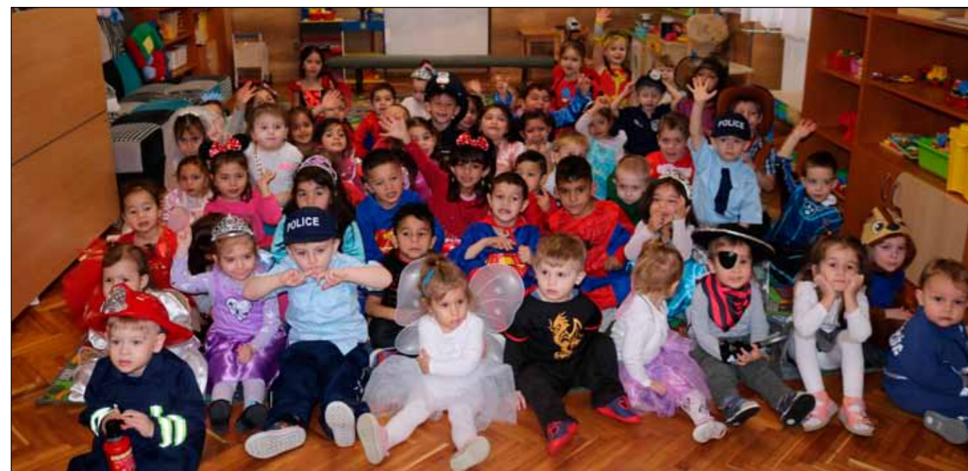
Az óvodások és a bölcsődések szívesen bújtak jelmezbe idén is

A „köszönöm” azonban, nem csak a bálozó vendégeinknek szól, hiszen a bál szervezése, zavartalan lebonyolítása nem lenne lehetséges segítők keze nélkül. Köszönöm a segítőkész háttér munkát mindenkinek, akikre a bál előtt, alatt és után mindig számíthattunk.