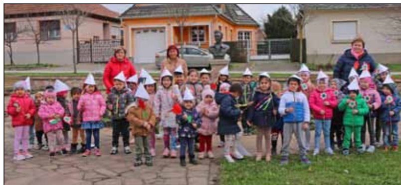
A legkisebbek kis piros-fehér-zöld zászlókat, tulipánokat vittek a Fialatok terére