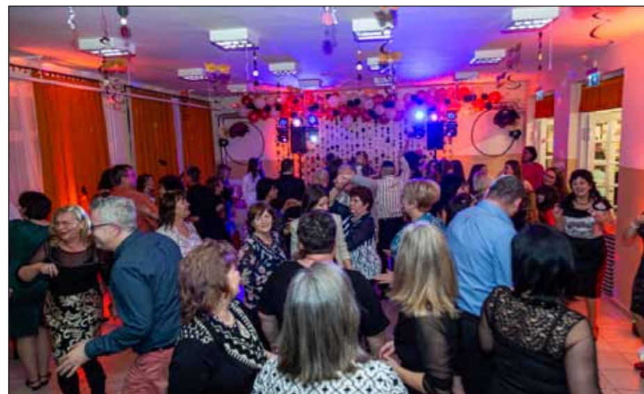
A résztvevők hajnalig ropták a táncot

Már a tavalyi bál előtt megfogalmazódott bennünk, szervezőkben, hogy - amennyiben tetszést arat - egy hagyományt szeretnénk teremteni a katolikus farsangi bállal, hogy napjaink üde színpoltja legyen a szürke téli hónapokban. Így ennek nyomán idén is nagy lelkesedéssel, örömmel és az elmúlt bál minden tapasztalatával felvértezve vágtunk bele a szervezkedésbe. Az idő rövidsége miatt nagyon tudatosan igyekeztünk haladni az előkészületekkel. Nem áruunk el nagy titkot, hogy minden ilyen munka rengeteg egyeztetést, szervezést, logisztikát, lemondást és háttér munkát igényel, s ezt nem is lehetett volna kivitelezni, ha nem tudunk és szeretünk jól, együtt csapatban dolgozni.