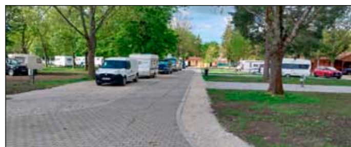
A kemping területén új utakat építették