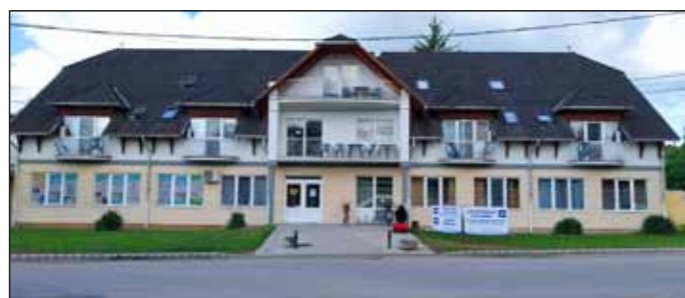
A felújításoknak köszönhetően a Thermál Szálló új külsőt kapott