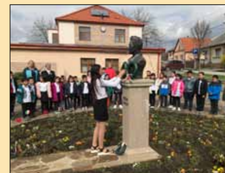
Iskolánk tanulói a Petőfi-szobornál koszorúztak