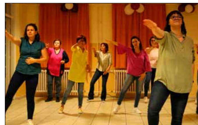
Az óvoda dolgozói táncos műsorszámokkal lepték meg a közönséget