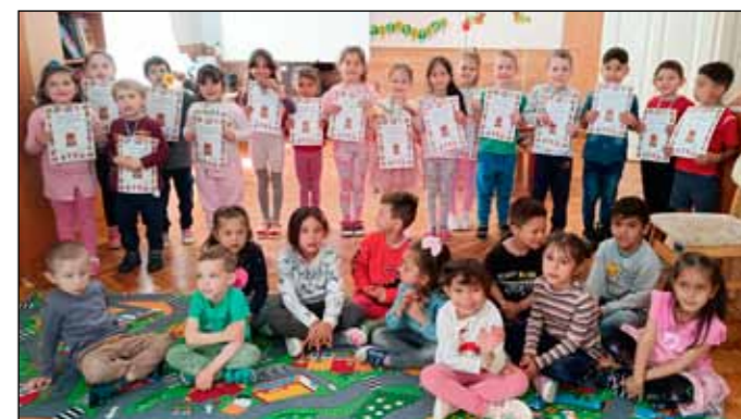
A költészet napján szavalóversenyt rendeztek a gyerekeknek