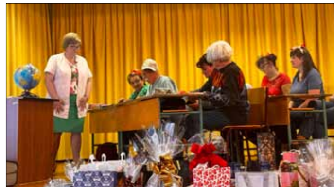
Jelenet egy iskola életéből - a bogácsi pávakörösök szerint