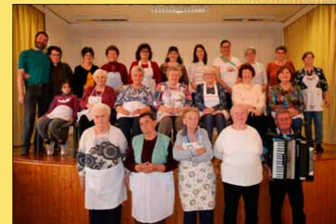
A közösségi csigacsinálás helyi ápolói