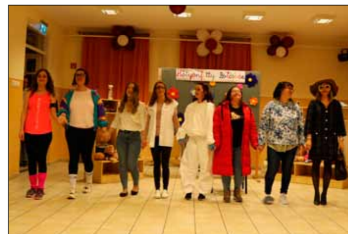
Humoros előadás során azonosulhattunk az anyukák különböző csoportjaival