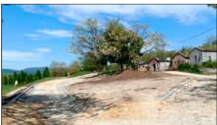
A Cserépi úti pincesoron jelenleg zajlik az útépités

Jelentős infrastrukturális fejlesztéseket sikerült megvalósítani. Az önkormányzati utak közül több megújult: a Fazekas Mihály, a Szegfű, az Erzsébet, a Rózsa, a Viola, a Fürdő, a Jókai, az Alkotmány és Hórvölgye