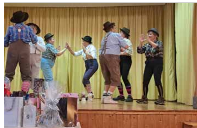
A bükkábrányiak bajor sörtánca

Hiszen ahhoz, hogy egységesen, stílusosan és kottakép nélkül tudjunk műsort adni, hónapok próbáira van szükség!