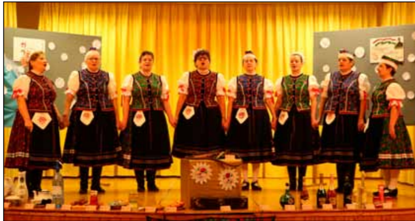
Bogácsi népviselet és népdal – mindkettő csodálatos

Nemzeti ünnepünkön -március 15-én- való föllépésünkre a fölkészülés nekünk már januárban elkezdődött.