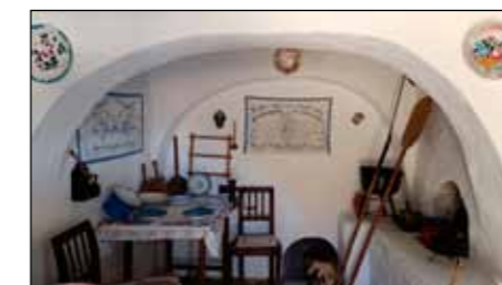
Konyha a paraszti világban

A valamikori kecskeistállóban, ami a lakóházzal egyben volt építve, használati tárgyakat, morzsolókat, mángorlót, gerebent, a kőbányászat és kőfaragás eszközeit, faszerszámokat láthatunk. Az itt lévő gazdag kiállítási anyag is arról árulkodik, hogy