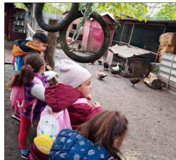
A kicsik néhány órára betekintést nyerhettek a tanyasi életbe