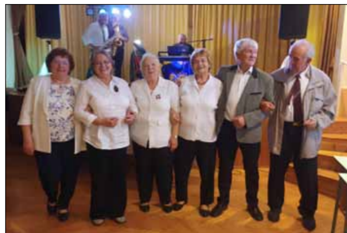
A szomolyai dalostársak