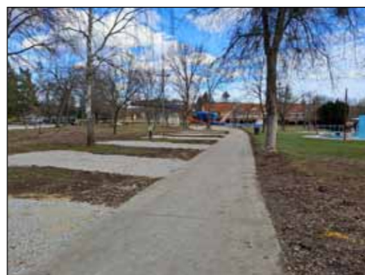
A lakókocsi beállók még komfortosabbá teszik a kempinget