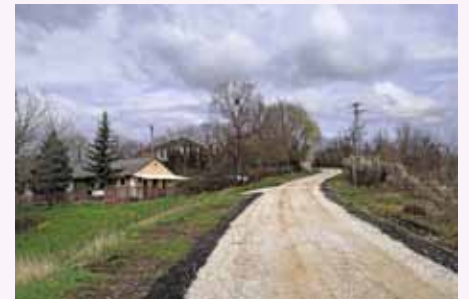
Pályázati támogatásból felújításra került az Ady Endre, Ibolya utca vízvezetőinek egy-egy szakasza, az Ibolya és Fürdő út egy része, a Pap-güdri árok közel kirakott szakasza, a Rákóczi út, Névtelen út egy részén a földmedrű árok.