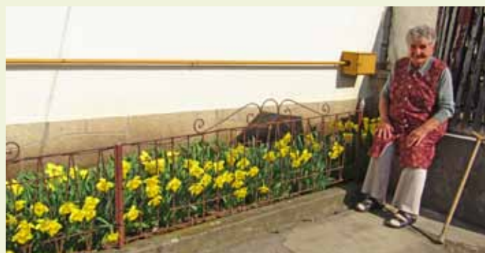
A virágok látványukkal és illatukkal hálálják meg Róza néni gondoskodását