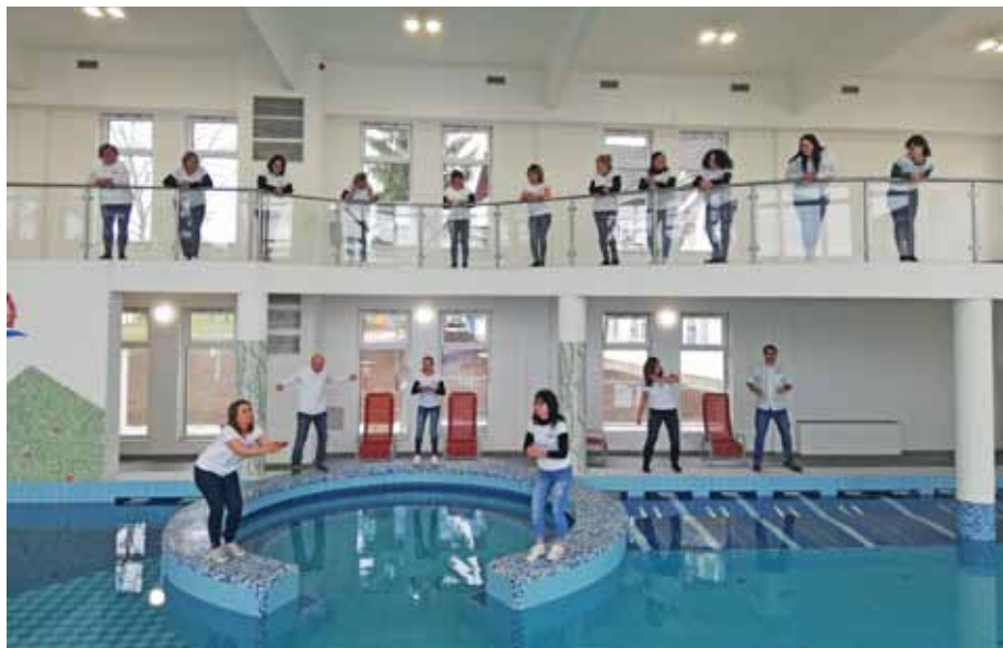
Az egész világot bejáró Jerusalema tánckihívás lélekelmelő és erőt adó hatását megtapasztalták fürdőnk dolgozói is