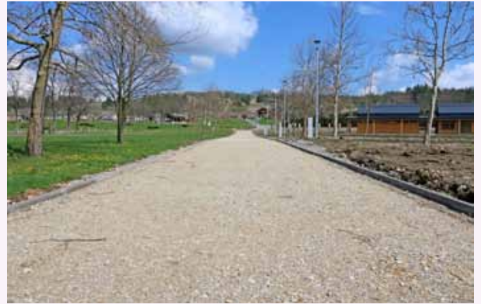
Épül a kerékpárút Mezőkövesd-Bogács-Cserépfalu-Bükkzsérc között