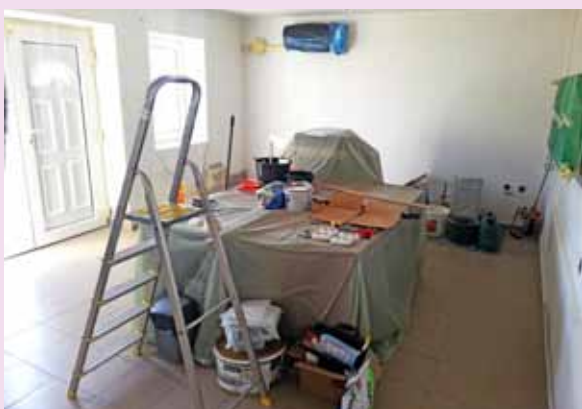
A felújítás előtti napokban

Márciusban új megjelenést kapott a Turisztikai Információs Iroda. A járványügyi intézkedések miatt az irodát be kellett zárunk - ekkor jött az elhatározás az iroda dolgozói részéről, hogy itt az ideje a megújulásnak. Munkásruhát öltöttünk, gletteltünk, festettünk és immáron új környezetben várjuk, hogy ismét a régi kerékvágásban jöhessenek vendégeink, valamint, hogy mihamarabb újra színes programokat szervezhessünk, találkozhatunk régi kedves ismerősökkel, új emberekkel.