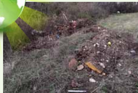
Kidobott tárgyak, eszközök a bogácsi határban