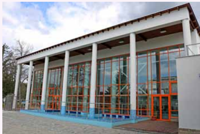
500 millió Ft állami támogatással és 200 millió Ft önerővel elkészült a fedett fürdő és wellness épülete.