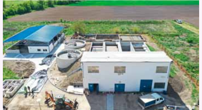
555 millió Ft-os EU-s pályázati támogatásból korszerűsítettük a szennyvíztisztító telepet.