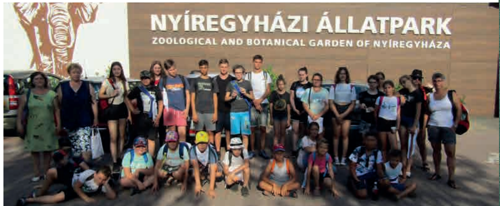
A kikapcsolódás mellett hazánk kulturális és természeti értékeit is megismerték a táborozók