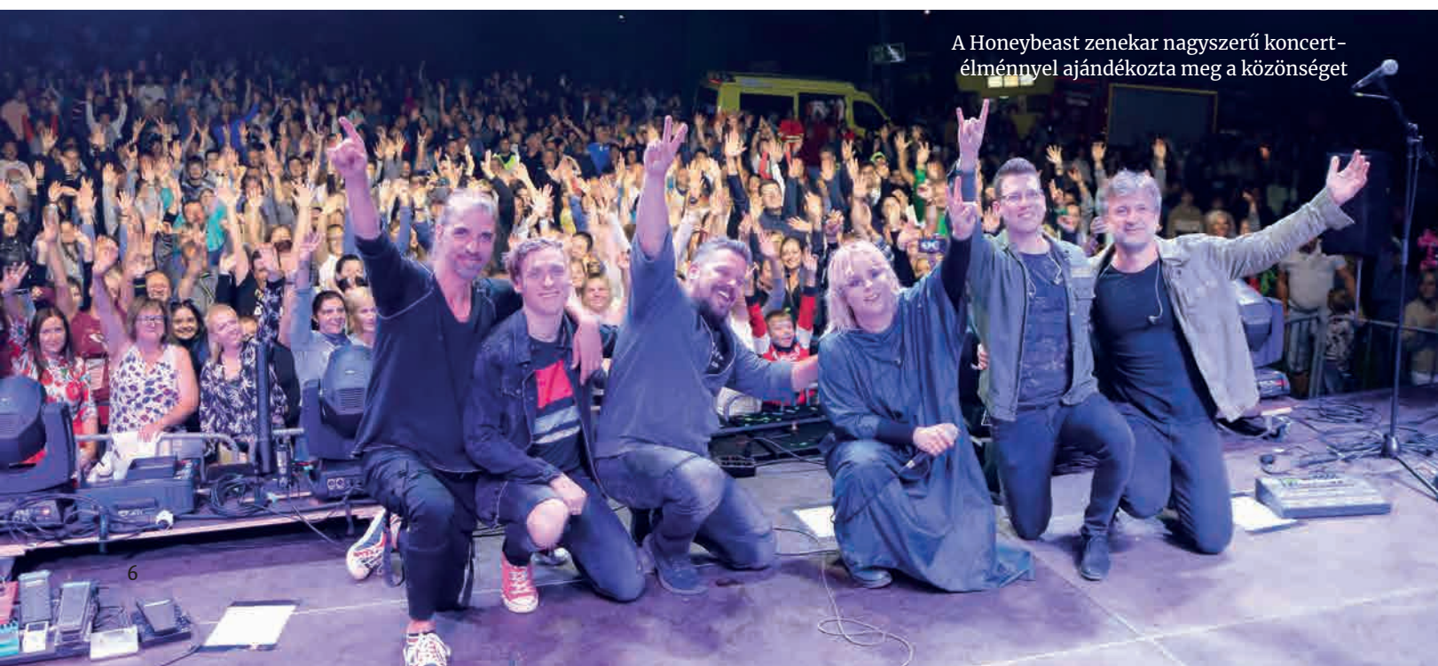
A Honeybeast zenekar nagyszerű koncert-élménnyel ajándékozta meg a közönséget