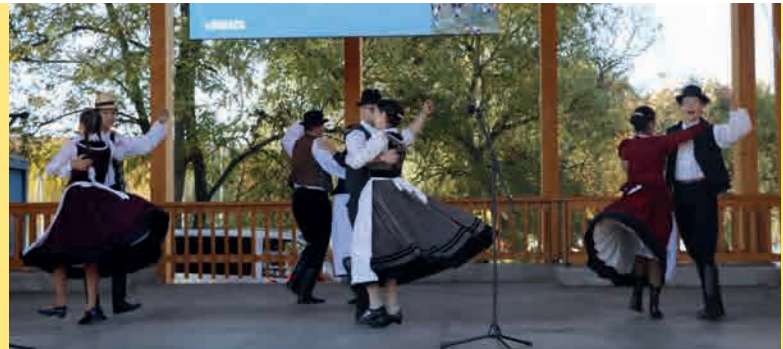
A Rendezvénytér új színpadának első fellépője a Mezőcsáti Néptáncsoport volt