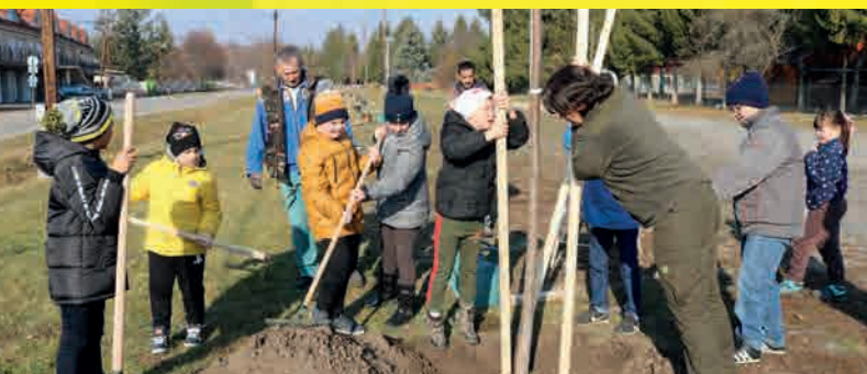
A bogácsi iskolás gyerekek lelkesen segítettek a faültetésben

A települések vagy bárki, AKI FÁT ÜLTET, BÍZIK A JÖVŐBEN! Emellett – tudatosan vagy csak a jó termés reményében - olyan globális célkitűzésekhez járul hozzá, mint a klíma-, víz- és talajvédelem, nem utolsósorban pedig új élőhelyet teremt és növeli a természet immunrendszerét.