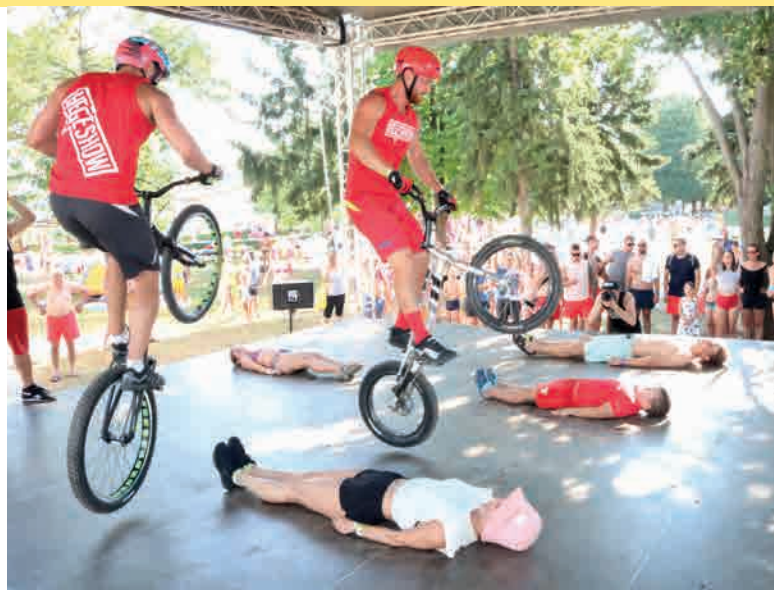
A közönség lélegzetvisszafojtva figyelte a kerékpárosok bemutatóját

Augusztus 7-én a Kerékpártúrával a mozgásért programon közel harminc sportolni kedvelő vett részt, három útvonal közül választhattak, s a túrát követően meleg étellel vártuk őket, a rendezvény végén pedig kisorsoltunk egy kerékpárt a résztvevők között.