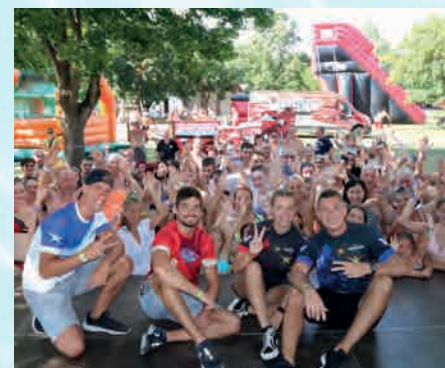
A fürdőnkben rendezett közönségtalálkozón sokan voltak kíváncsiak az Exatlon-Hungary sztárjaira

A továbbiakban rövid tájékoztatást adok az idén végrehajtott és folyamatban lévő beruházásokról, nagyobb volumenű karbantartásokról: Megvalósult a „gömbcsúszdás” gyermekmedence és a Jurta medence új műanyagburkolatának kialakítása, ennek nagy előnye a csempe burkolással szemben a kisebb költségű kivitelezés, illetve az általános újrafugázások és csempecserék elkerülésével a kedvezőbb karbantartási költség is. Folyamatban van a csúszdapark 8 db nagyteljesítményű szivattyújának cseréje takarékosabb kivitelűre. A kinti fürdős és kemping vízcsatlakozók ajtóinak cseréjét is végrehajtottuk. A jurtamedence gépészeti felújítását is megkezdjük. Kivitelezésre kerültek a pillangó és a jurtamedence körüli új járdák, burkolatok. Folyamatban van a Jurta és a kemping terület nyugati kerítésének cseréje (130 m). Új szennyvízvezeték kerül kialakításra a kemping vízcsatlakozók és a gerincvezeték között tisztítóaknával. A leállás idején újraburkoltuk a hátsó bejárat épületében lévő 4 db apartman fürdőszobáit. Megvalósítjuk az ún. hátsó tetőtér lépcsőjének cseréjét. Vásároltunk 40 db új ágyat, valamint 100 db napozóágyat. Itt csupán a nagyobb tételeket írtam össze.