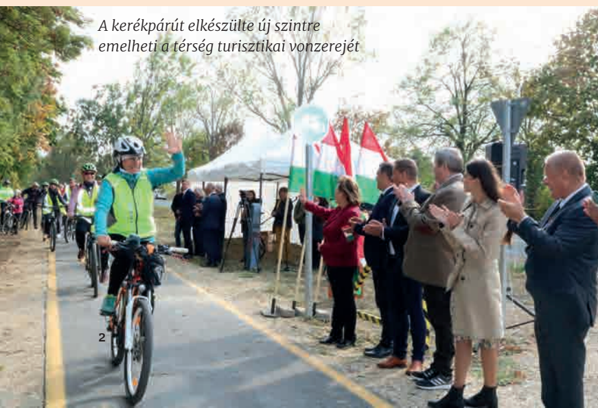
A kerékpárút elkészülte új szintre emelheti a térség turisztikai vonzerejét