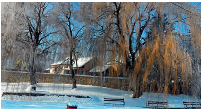
Minden télen szeretnénk gyönyörködni a természet szépségében

Bogácson idén elmaradtak a már tradicionális adventi ünnepi rendezvények, és nem volt szent család-járás. Ennek ellenére az év végéhez közeledve a várakozás napjai mindenki számára elhozhatták a belső békét. Otthonunkban, a templomban vagy a Fialatok terén a betlehem melletti adventi koszorú felragyogó fényeinel is átértelmeztethetjük hitünk mélységét, imánk erejét, szeretetünk önzetlenségét. Az elcsendesedés, a ráhangolódás megváltoztat bennünket, s a tevékeny hétköznapjainkba így lopja be magát a karácsony hangulata, mely más-más módon, de elér minden ember szívéhez.