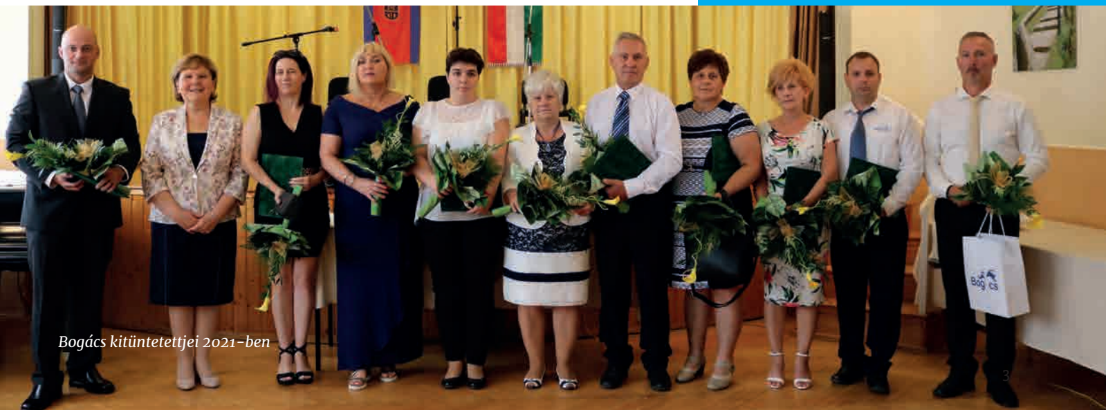
Bogács kitüntetettjei 2021-ben

Köszönjük szépen áldozatos tevékenységüket! A további munkájukhoz jó egészséget és kitartást kívánunk!