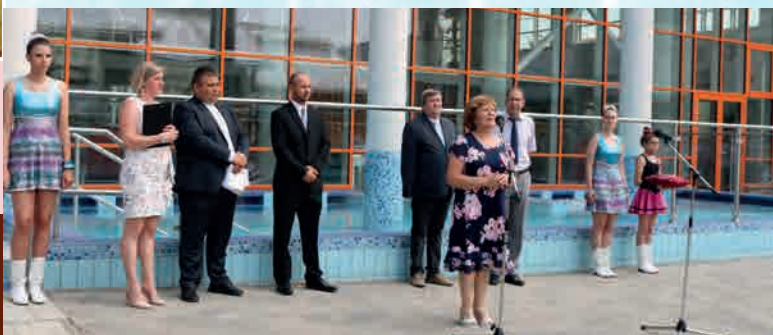
Az új élményfürdő és wellness részleg népszerű a vendégek körében

Július 9-én nyitottuk meg az 500 millió Ft kormányzati támogatással megvalósult új fedett élményfürdőt és szaunarészleget, amelynek elnyerésében nyújtott segítségét ezúton is köszönjük parlamenti képviselőnknek, Tállai András úrnak. Jó hír, hogy az élményfürdő és a szaunarészleg is egész nyáron telt ház közeli forgalommal működött, abszolút túlhaladva a hozzá fűzött reményeket. A 2014-ben megvalósult csúszdapark, a 2016-os faházkomplexum építést, valamint a 2018-ban elkészült panzió beruházást követően ismét egy sikeres, eredményesen működtethető projektet tudhatunk magunk mögött, ami a jövőben tovább növeli a társaságunk eredményességét, és a település fejlődési lehetőségét.