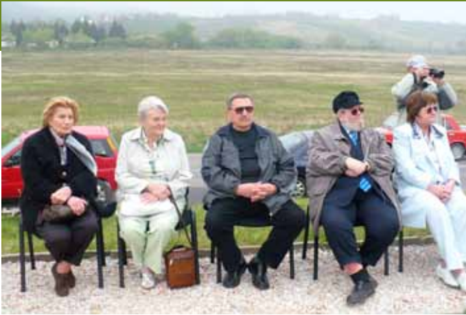
A Nemzet Színészei 2009-ben látogattak először Bogácsra