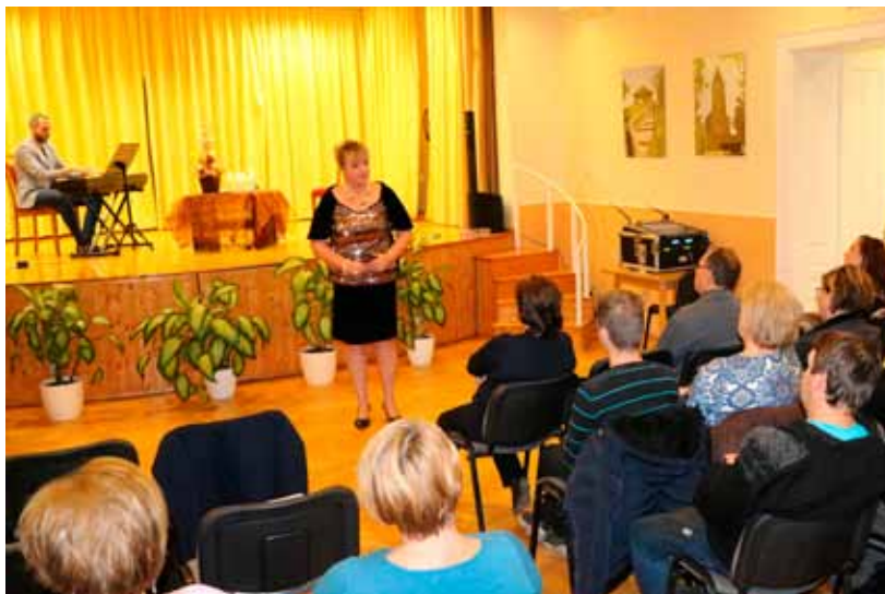
Hajtmann Ildikó csodálatos énekhangjával és varázslatos személyiségével elbűvölte a közönséget