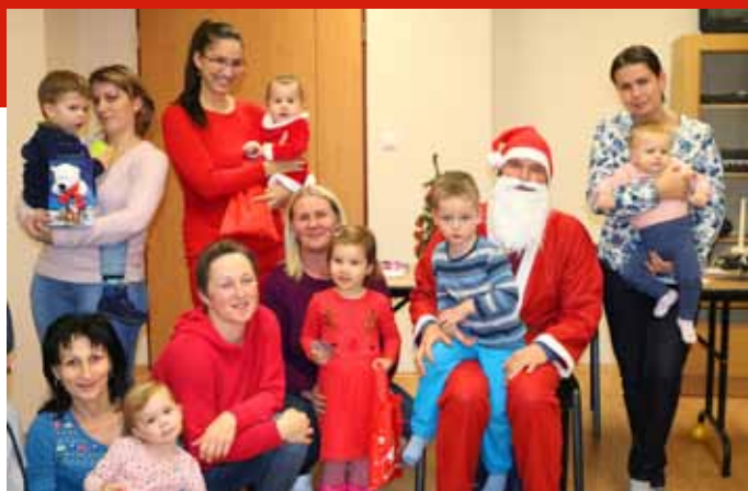
A legkisebbekhez is ellátogatott a Mikulás

Az évek alatt a családoktól számos játékot kapott a klub, amiknek nagy hasznát vesszük. Sokszor a legegyszerűbb már kiselejtezett játékokkal a legizgalmasabb a közös móka. A gyermekek szeretik és élvezik a közös programokat, megtanulnak egymáshoz alkalmazkodni, lényegében az óvodára is részben felkészülnek. A visszajelzések alapján könnyebben beilleszkednek azok a kisdedek az óvodába, akik a klubba jártak korábban. Szociális érettségük is jobb lesz, főleg a családban egyedüli gyermekként cseperedő gyermekeknek. Sok esetben új dolgokat tanulnak meg egymástól és mindemellett az édesanyák is kicserélhetik tapasztalataikat, megbeszélhetik a gyermekneveléssel kapcsolatos problémáikat. Segítségemmel egy-egy egészségügyi és gyermekneveléssel kapcsolatos témában irányított beszélgetések zajlanak, segítve ezzel is a résztvevőket. Az évszakoknak megfelelően alkalmanként külső helyszínt is választunk, így történt ez az idei nyáron is, amikor a fürdő vendégei voltunk. Felfedezhettük a gyermekmedence és a játszótér izgalmas játékait, kizökkenhettek az anyukák a hétköznapi monoton