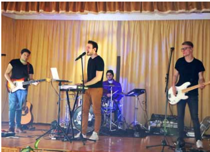
A Kávészünet zenekar tagjai a mindennapi oktatás módszereitől eltérően tanítják a tanulókkal a verseket