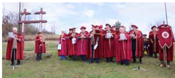
A Szent Márton Borlovagrend tagjai idén is elítették a férfiakra káros szőlő boszorkányt