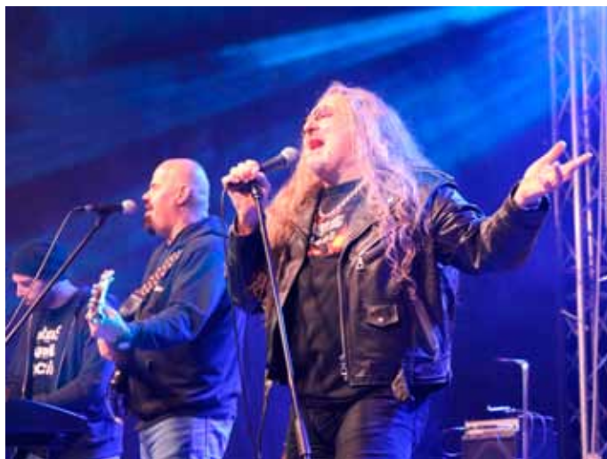
A Rudán Joe Band fergeteges hangulatot teremtett a pincesoron