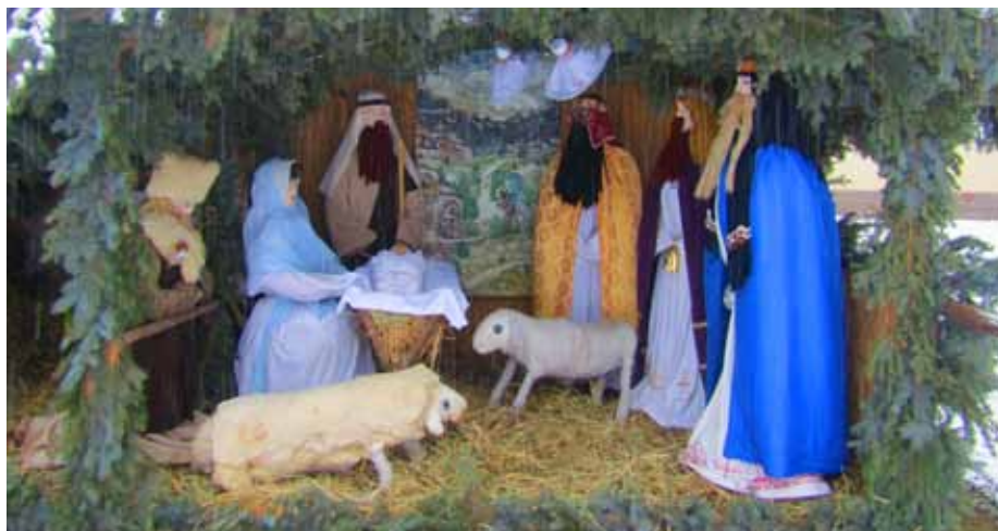
A betlehemi kisded felébredését a közönyből, általa a remény és a gyöngédség hordozói lehetünk

A csodák pedig körülöttünk zajlanak. Nincs kis csoda vagy nagy csoda, csak csoda van. Észrevételükhöz azonban szem kell.