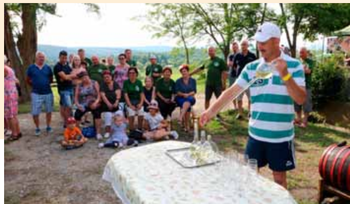
A Borlopó verseny megrendezését a Borrend vállalja

Ezen most már hiába sírunkozunk, inkább jó fajtaválasztással kell kihozunk a legmagasabb minőséget a helyi adottságokra tekintet-