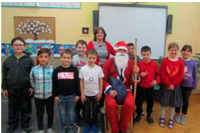
A Mikulást az idén is nagy örömmel fogadták az iskolások

Az idei december hóeséssel érkezett, igazi téli meseországot várva körénk. Intézményünkbe december 6-án délután látogatott el a Mikulás bácsi. Az iskolában ilyenkor a gyermekek megváltoznak, teljesen kivirulnak, hevesebben ver a szívük, mert személyesen is találkozhatnak a jószágos adakozóval. Az első osztályosok vidám műsorral, A három fenyőfa című jelenettel köszöntötték a Mikulást, aki dicséretet, néha dorgálást, jó tanácsokat adott a legkisebbeknek. Majd finomságokkal ajándékozta meg azokat, akik jól viselkedtek az elmúlt esztendőben. A délután hátralévő részét játékos, zenés-táncos feladatokkal töltöttük.