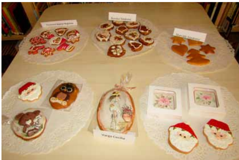
Néhány mézeskalács a kiállításra érkezett darabokból. A teljes kiállítási anyag január végéig megtekinthető a könyvtárban