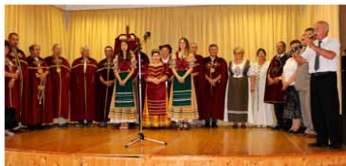
A borfesztivál az év kiemelkedő rendezvénye volt

A borturizmus közösségformáló erő és nagyon jó lehetőség a kapcsolatok elmélyítésére. Az a végtelen, kimeríthetetlen gazdagság, amely a borra jellemző egyetlen más élelmiszer esetében sem képzelhető el.