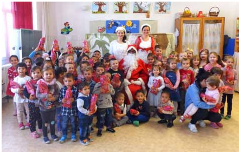
Az óvodásokhoz a színészekkel együtt érkezett a Mikulás