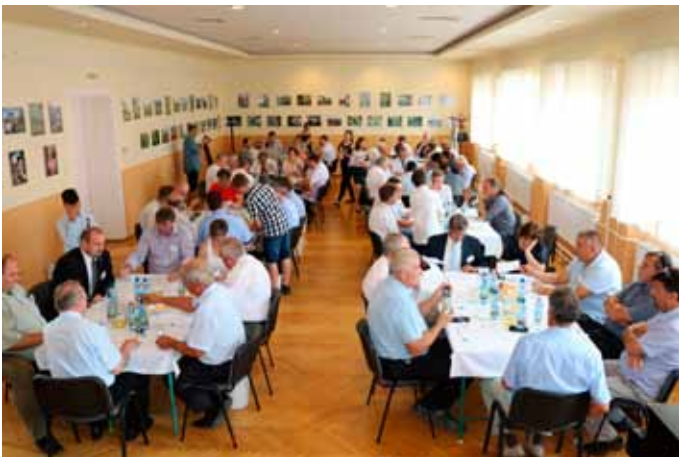
A borverseny idején sok borász, borbíró szakember érkezik Bogácsra