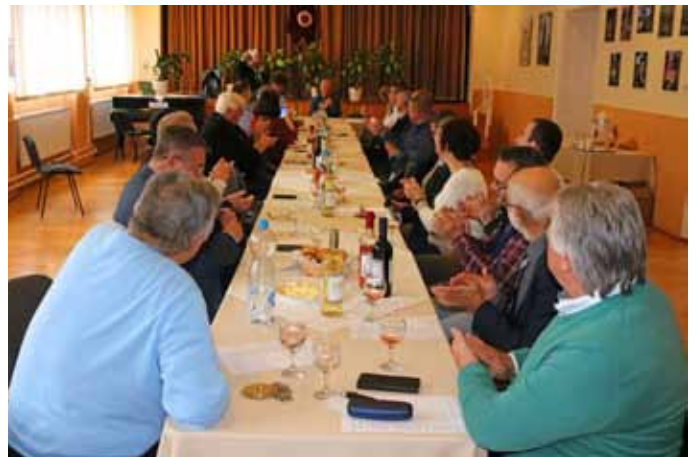
Minden év novemberében a bogácsi Községi Házban tartja éves közgyűlését a Borrend