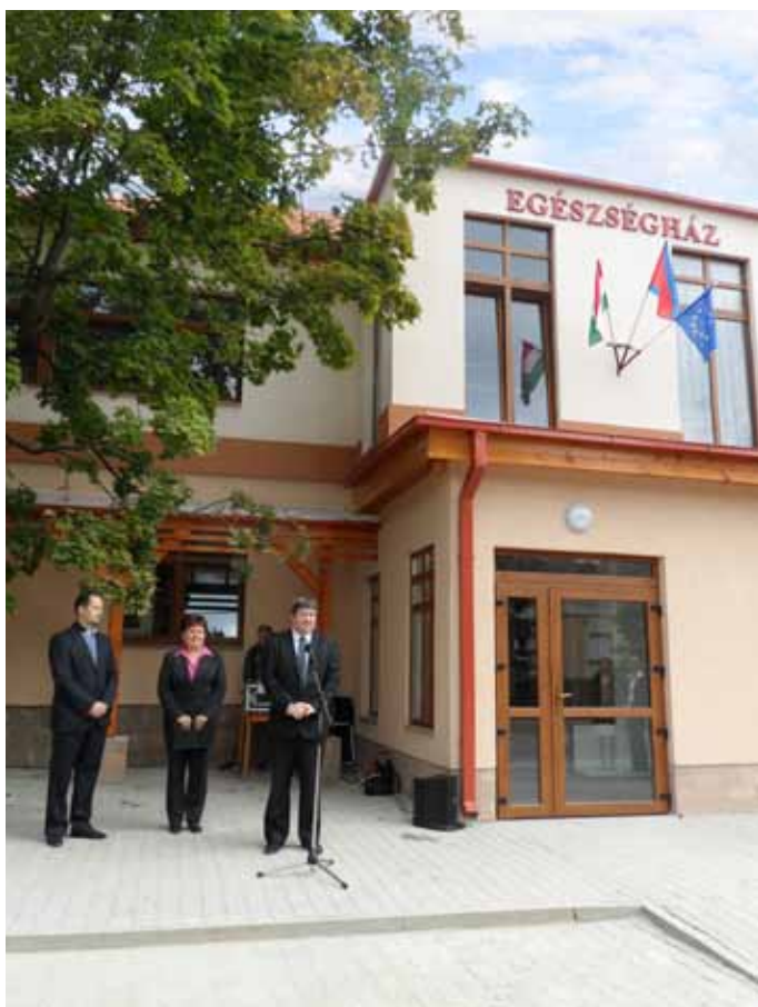
A korszerű Egészségház átadásával bővült az egészségügyi ellátások köre