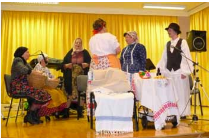
2004-ben először szórakozhatott a közönség a Bogácsi Pávakör humoros színpadi játékán