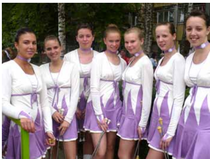
Bogácsi mazzorettek 2009-ből