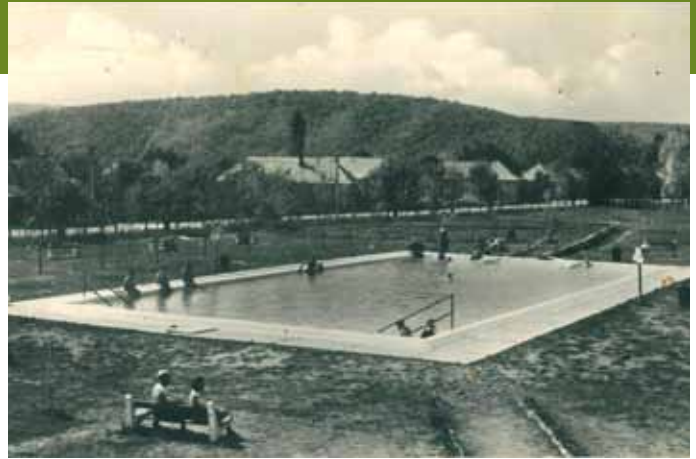
Az első fürdőmedence átadásától 60 év telt el