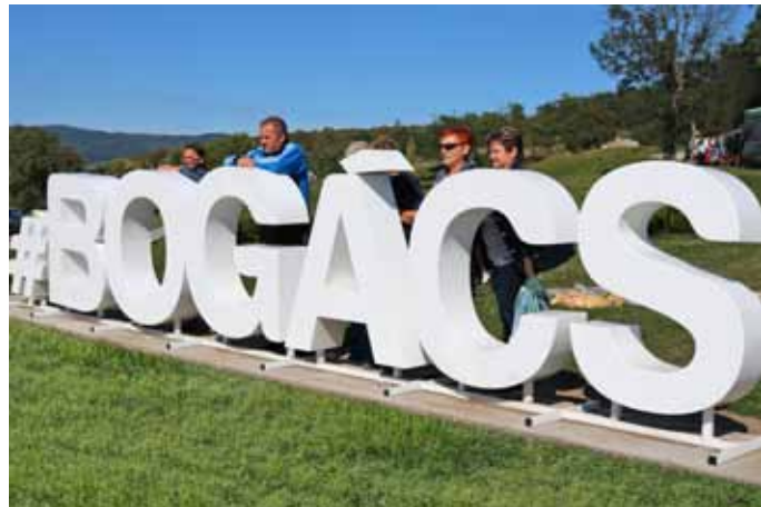
Településünk idén óriás betűkből álló „BOGÁCS” szelvi ponttal gazdagodott

A kerékpárút megvalósítására kiírt közbeszerzési és kisajátítási eljárás is lezárult végre, eredményeként a jövő év tavaszán elkezdődhet az építés. A kisajátítási folyamatot nehezítette, hogy több