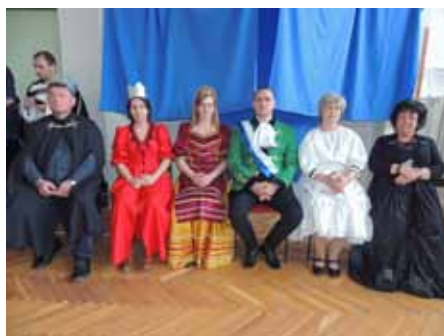
A mese és a regény szereplőinek találkozója