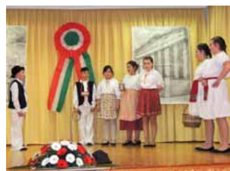
A Bükkalja Általános Iskola tanulóinak ünnepi műsora hozzájárult a történelmi tudat építéséhez

1848 március 15. eseményei mindannyiunk iskolai emlékeiben szerepelnek. Évek folyamán hozzánk nőtt Petőfi Sándor, Jókai Mór, Kossuth Lajos neve, Petőfi Nemzeti dala, a Landeler nyomdájában kinyomtatott első szabad sajtó terméke, a 12 pont, a szívünk fölé kitűzött nemzeti színű kokárda.