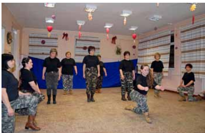
A bálon mutatkozott be az OVI TEK csapat