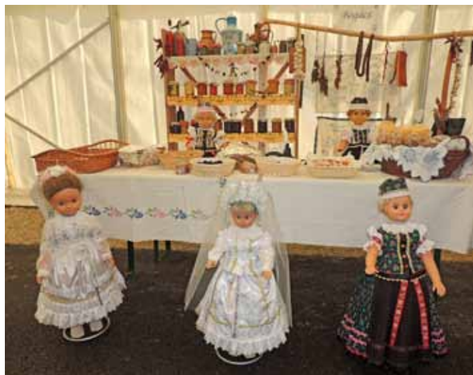
A Bogácsi Pávákör kamrájánál községünk ünnepi és hétköznapi népviseletét is megcsodálhattuk

Akik nem a sütemény sütés területén akarták megméretetni magukat, azoknak lehetőség volt a kocsonyakészítő versenyen részt