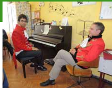
A Mozart család otthona

A zenei párbajt a fenséges lakodalmi ebéd követette, majd ezután kihirdettük a Meg-