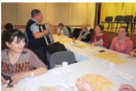
Énekszó mellett könnyebben ment a munka