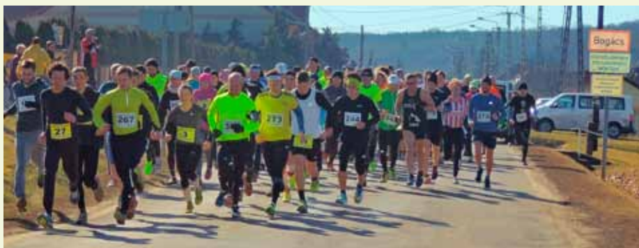
A rajt után még együtt voltak a futók