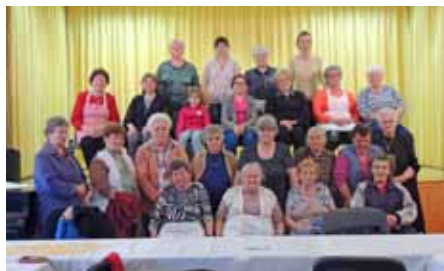
2017. április 1-jén újra csigát csináltak az asszonyok, lányok