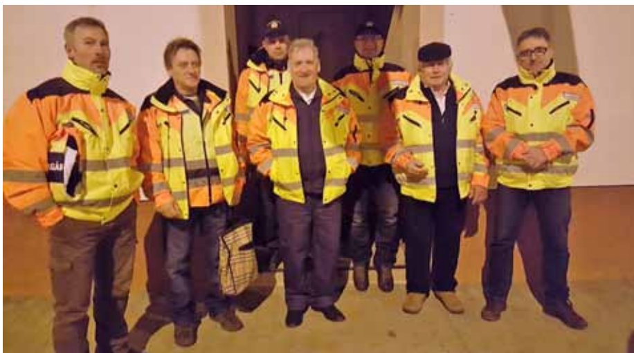
A Bogácsi Polgárőr Egyesület oszlopos tagjai

Ezen előzmények után teljes erőbedobással vetette be magát az egyesület a munkába. A feladat teljesen új volt mindenki számára. Lassan a tapasztalatok felhasználásával alakult ki a szolgálatok rendje, az ellátandó feladatok rendszere. Közben teltek az évek és folyamatosan változott az egyesület létszáma. Volt, aki kilépett, mert nem erre a feladatra gondolt, volt, akit fegyelmezetlensége miatt kellett eltanácsolni.