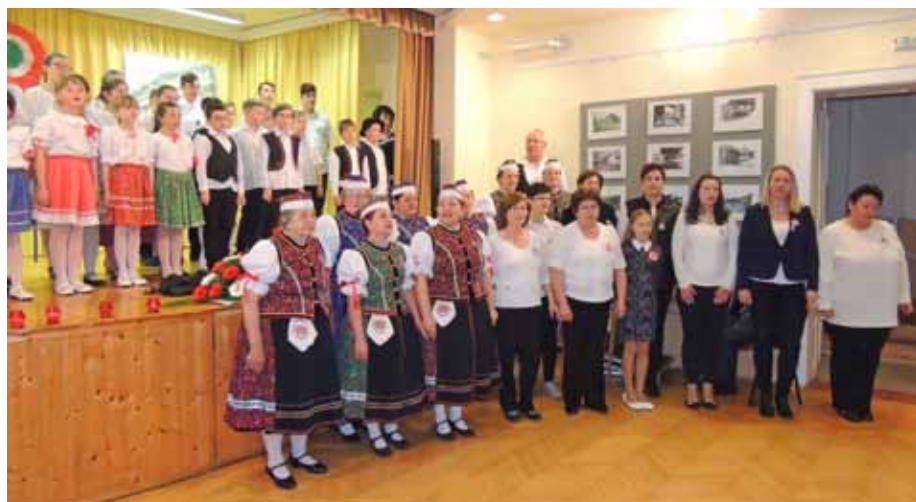
A Millenniumi óda éneklésébe bekapcsolódott a pávakör mellett a közönség néhány tagja is