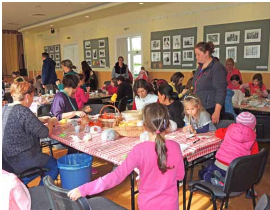
A játszóház programjai az ünnepre hangolnak

Jeles napjaink újraértelmezését a politika is befolyásolja, gondoljunk csak a szocialista rendszer ellentmondásos kapcsolatára a vallási ünnepekhez. Ennek és a fogyasztói társadalom kialakulásának következményeként a kereszténységhez kötődő ünnepeink – főleg a vallásukat nem gyakorlók körében – ajándékozási ünnepé alakultak át. Ennek ékes példája a tojás mellé elvárt locsolópénz.