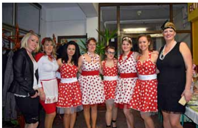
Az anyukák jelmeze és tánctudása magával ragadta a bálózók figyelmét