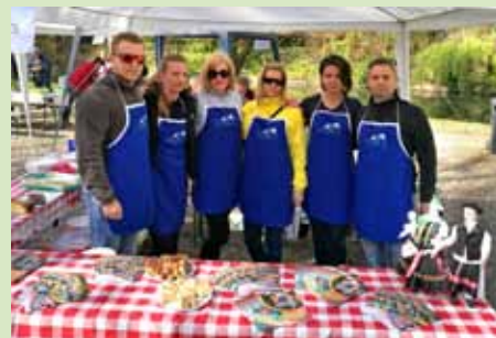
A bogácsi csapat eredményes volt Békésen

Az alföldi város a Virágvasárnapi Vásár keretén belül rendezte a töltöttkáposzta-főző és süteménysütő versenyt, amire újra benevezett 6 fős csapatunk a Bogácsi Turisztikai és Szolgáltató Nonprofit Kft. szervezésében. Ezzel is erősítve a két település közti, négy éve töretlen baráti kapcsolatot – és a bogácsi büszkeségét, hiszen a Szajlai Sándor által készített káposztánk elnyerte az első helyezést!