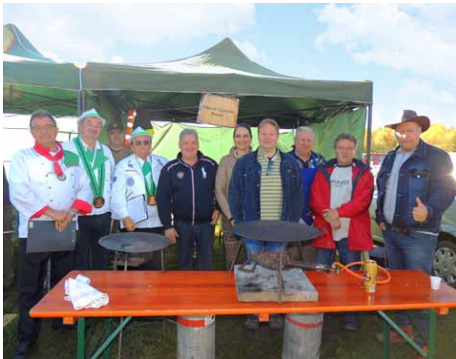
A Bogácsi Polgárőr Egyesület csapata a 2016-os Tárcsás ételek fesztiválján

A megalakulása óta állandó változáson megy át egyesületünk. Az elvégzett munka viszont minden esetben minőségi. Működésünk alatt sok esetben intézkedtünk, legfőbb feladatunk általában a megjelenés és a jelzés. A jó együttműködés jegyében számtalan esetben közös járőrözéssel, akciókban való részvétellel, közúti ellenőrzéssel segítettük a rendőrség hatékony munkáját. Működésünk ideje alatt különösen nagy figyelmet fordítottunk az idegenforgalommal járó megnövekedett közbiztonsági feladatokra. A vagyonvédelem érdekében számtalan szolgálati órát töltöttünk járőrözéssel a község bel- és külterületén. Együttműködési szerződést kötöttünk a Hór-Agro Zrt.-vel a postával és a hegyközséggel. Több esetben kapott egyesületünk elismerést a Megyei és a Mezőkövesdi Rendőrkapitányságtól az elvégzett munkáért.