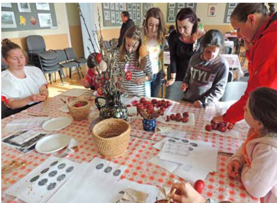
A régi világban a tojásfestés mintáinak üzenete, varázsereje volt

Lehet az táncház vagy egy elmélyült ima, esetleg egy csobbanás a medencébe, ki hogy éli meg, mindegy is. Az ünnep kimozdít a mókuserékből, egy pillanatra megállít a rohanásban, elgondolkodásra ad időt, reményt ad. Nincs más dolgunk, csak megnyitni szívünket és befogadni a remény madarát!