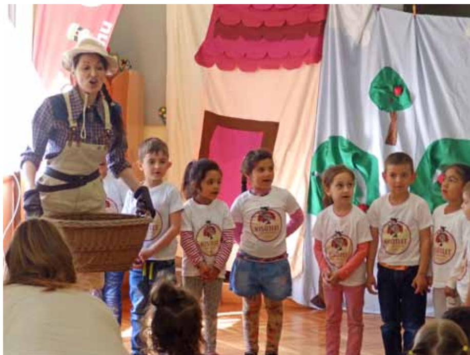
Óvodásaink lelkesedéssel várják a kéthetente sorra kerülő változatos programokat, feladatokat

A rekordlétszámú jelentkezésből (216 fő) adódóan a köszöntők és a műsorszámok a központi konyha éttermében kaptak helyet.