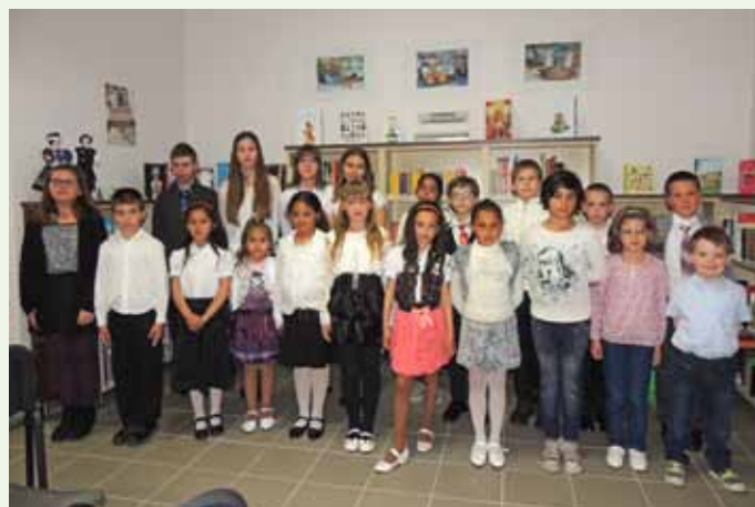
A gyerekek szép szavatokkal ajándékozták meg a közönséget

Szép szavakat hallhattunk az óvodásoktól, a helyi általános iskola tanulóitól, középiskolások közül csupán egy tanuló vállalkozott arra, hogy a számára legkedvesebb verset bemutassa. A magyar költészet nagy alakjainak- Petőfi Sándor, Arany János, József Attila - verseit szavalták a gyerekek, de hallhattunk kortárs költők műveiből is. Jó volt látni és hallani, hogy a költészet varázsa a legkisebbeket is megérintette.