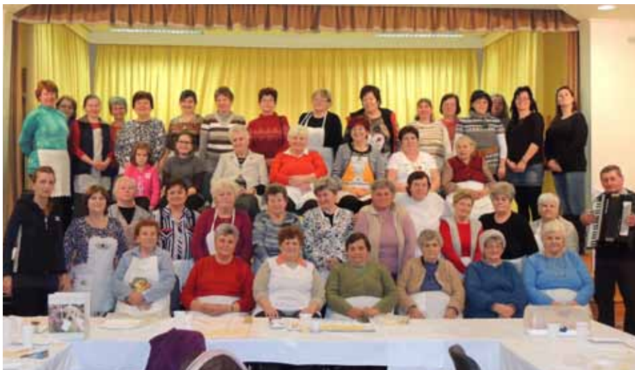
A 2017. január 28-i csigacsinálók

2017. január 28-án immár IV. alkalommal népesítették be a Községi Házat a hagyományátörökítő csigacsinálók.