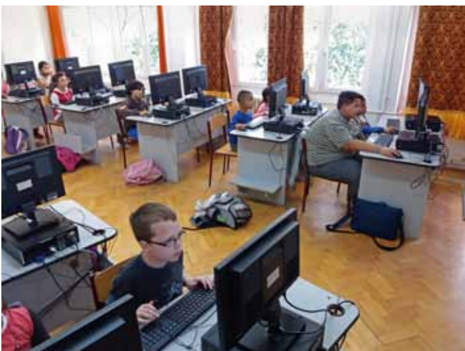
A bemeneti mérés nagy koncentrációt igényelt

Más tanodákkal való találkozások, műhelymunkák és beszélgetések nagyban segítik a