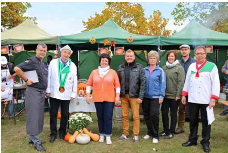
A Zöldvárálja Tanoda lelkes pedagógus csapata a Tártság ételek versenyén is jeleskedett