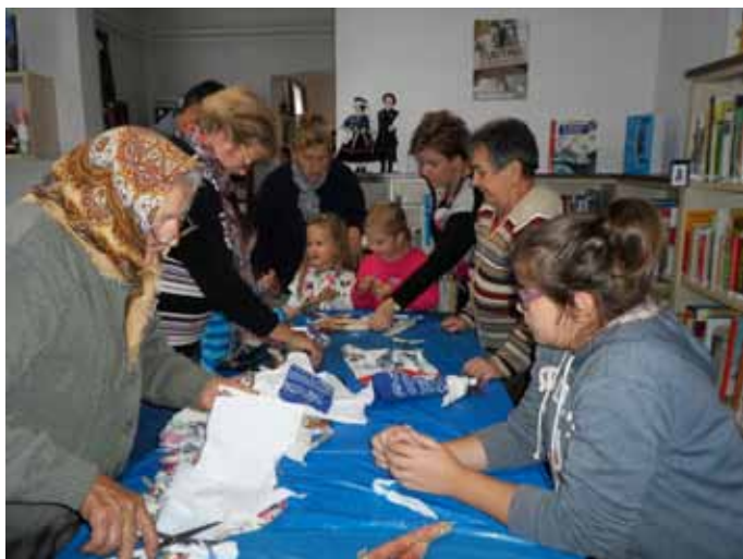
Az alkotókedv -kortól függetlenül- mindenkin feléledt