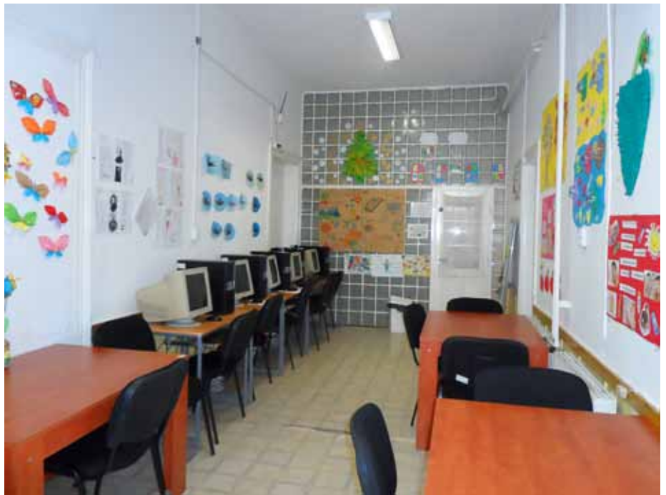
Az Idősek Klubjának épületében helyet kapó tanoda falai a gyerekek keze nyomán váltak színessé, otthonossá