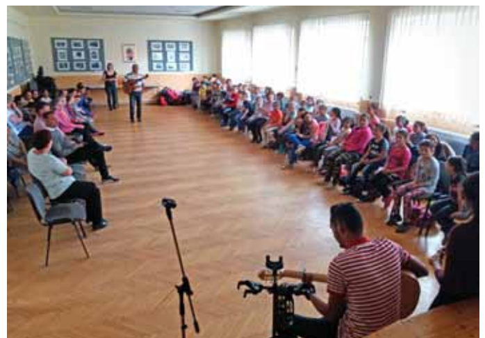
A Romano Glaszo Művészeti Csoport már az első bemutatkozás idején elnyerte mindnyájunk tetszését