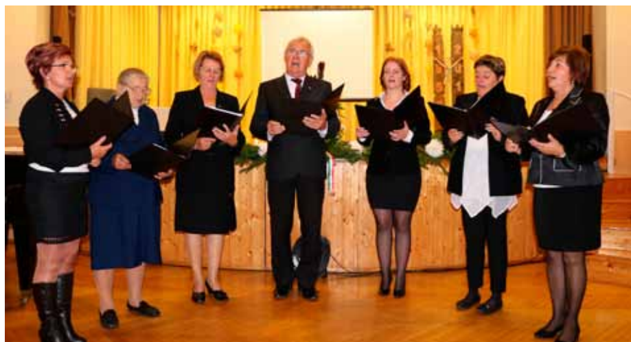
Hagyományörző csoportunk, a Bogácsi Pávakör dalsókrával járult hozzá '56 eszmeiségének átérzéséhez