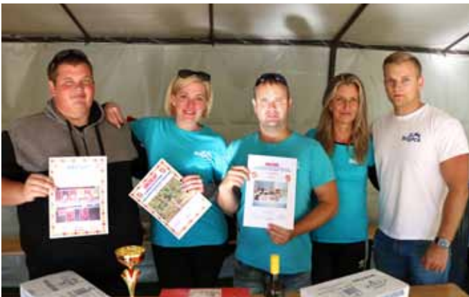
A VIII. Dánszentmiklósi Almás Ételek Főzőversenyén Bogács csapata a II. helyen végzett, a süteménysütő versenyen pedig I. helyen