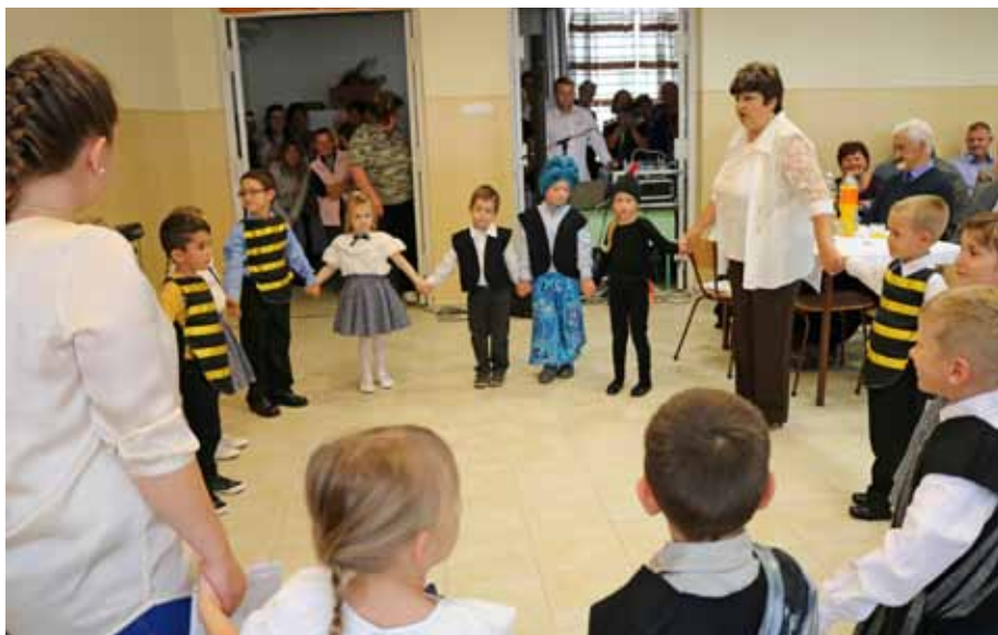
Ünnepi műsorukkal az óvodások jókedvre derítették a néniket, bácsikat