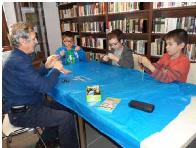
Régen üreges belsejű növényből készítettek sípot, most műanyag szívószálból.