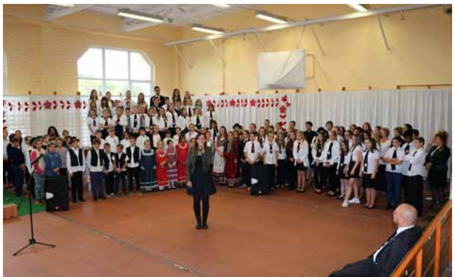
150 gyerek élte át a közös éneklés örömeit