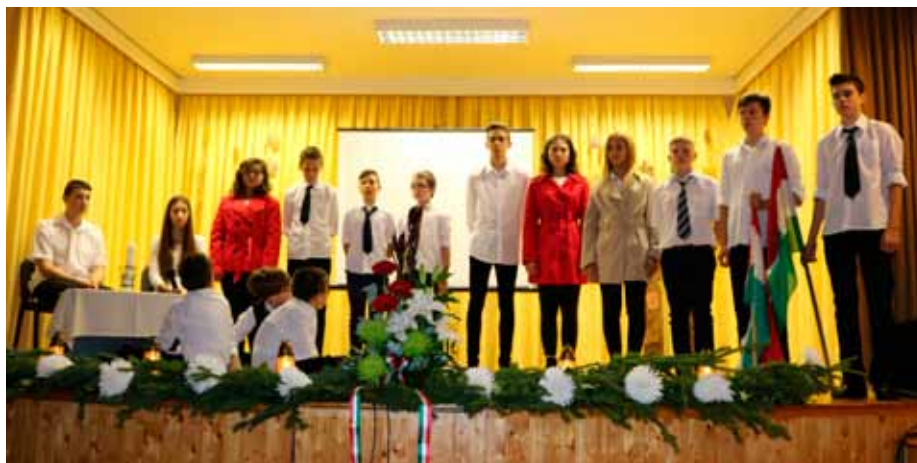
Iskolánk tanulói '56 szellemiségéhez méltó műsorral emlékeztek meg az októberi eseményekről

Jelentős előrelépést tettünk annak érdekében, hogy ez az ünnep a rangjának méltó helyre kerüljön az emberek, az itthon és külföldön élő magyarság tudatában és a nemzetközi megítélés szintjén is.