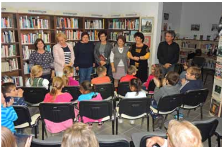
A népmesék varázslatos világát keltették életre a pedagógusok

Október 25-én a KönyvtárMozi keretében iskolánk 30 tanulója tekintést nyerhetett az animációs filmek készítésének világába. A