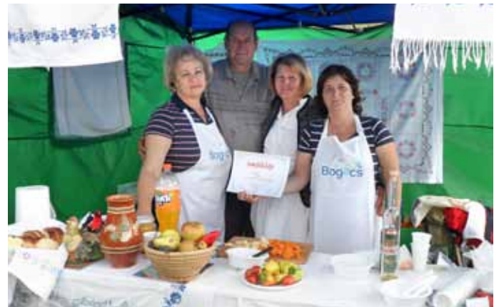
A XIV. Tardi Kakasfesztiválon bogácsi lagzis húslevest készítettünk - természetesen - kakasból

Október 7-én két bogácsi csapat is részt vett egy-egy gasztronómiai megmérettetésen, ahol kiváló eredményeket értünk el. Ezúton szeretném megköszönni a csapattagoknak, és a támogatóink-