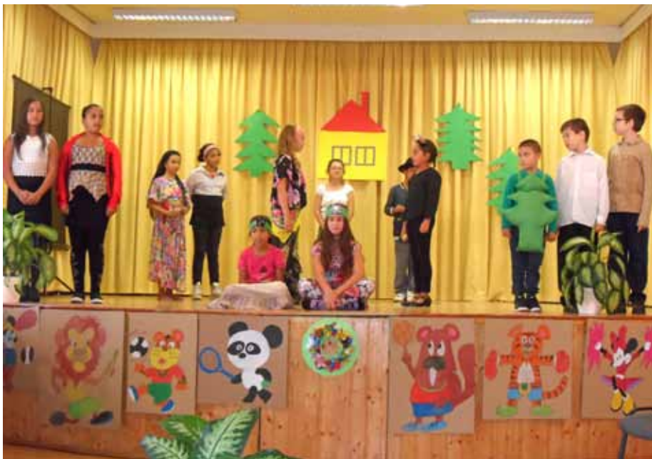
A nyitott tanodai programon a tanulók kedves mesejelenetet adtak elő

tapasztalatok átadását és a jó gyakorlatok munkánkba való beillesztését.