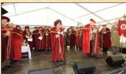
1996 májusában alakult meg a Szent Márton Borlovagrend.

1996. május 29-én a bogácsi fürdőbe látogatott Németh Miklós volt miniszterelnök.