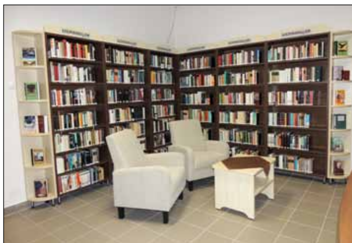
A könyvek átláthatósága megkönnyíti a választást

2013. január 1-jétől településünk könyvtára könyvtári szolgáltató helyként csatlakozott a II. Rákóczi Ferenc Megyei és Városi Könyvtárhoz, a Könyvtári Szolgáltató Rendszer (röviden: KSZR) keretében. Ennek köszönhetően a megye többi kistélepülési könyvtárához ha-