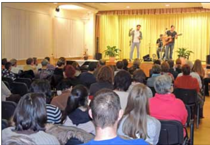
A Kávészünet zenekar dalos köntösbe öltözteti a magyar irodalom legismertebb verseit