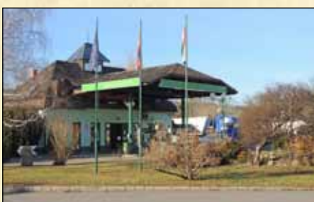
1996 decemberében adták át a benzinkutat.