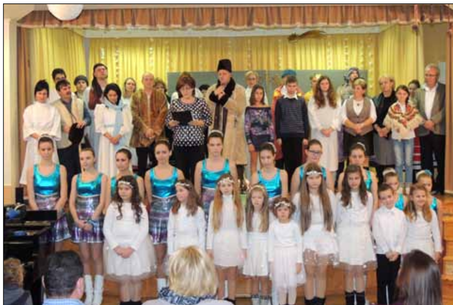
A karácsonyváró műsor népes szereplőgárdája

Régen a telek is másak voltak, mondják az idősek. Az '50-es években nem volt ritka