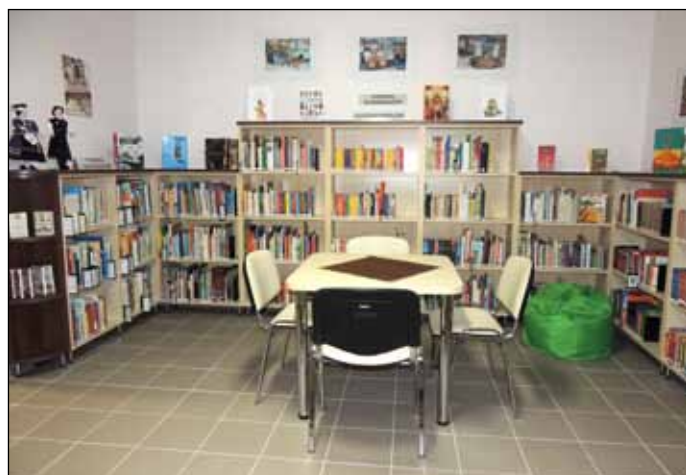
Új gyermekrészleg barátságos