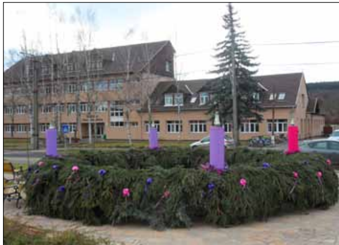
Az óriás adventi koszorú a község új látványosságá

A 20. század elejétől terjedt el a Szentcsalád-járás. Karácsony közeledtével 9 napon át 9 közel lakó vagy ismerős család el-ellátogatott egymáshoz, a Szentcsalád képét magukkal vitték és felidéztek a betlehemi szálláskeresés történetét. Ez az adventi ájtatossági szokás még ma is él Bogácson a katolikus emberek egy szűk körében.