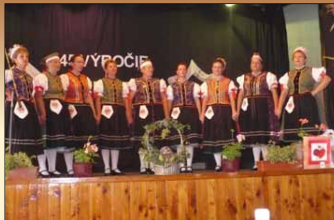
Fellépés Hárskúton 2009-ben

Az eddig tanult dalsokrokat nem feledve, arra törekedett, hogy a Palócföld dalainak mind szélesebb körét ismerjék meg. Ennek érdekében népdalkörvezetők továbbképzése, kutatómunkával gyarapította saját ismereteit.