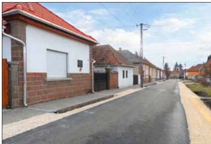
Új burkolatot kapott a Széchenyi utca

A fürdőn kívül komoly bevételi forrás a helyi vállalkozók által fizetett iparüzési adó, és a szállásadóik idegenforgalmi adója. Mindkét összeg az elmúlt években folyamatosan emelkedett annak ellenére, hogy a mértékében nem volt változás, az iparüzési adó a csökkentett nettó árbevétel 2 %-a, az idegenforgalmi adó pedig vendégéjszakánként 280 Ft már évek óta. Nagyon fontosnak tartom, hogy az adózók megértsék: ez nem egy kötelező „sarc”, mellyel az önkormányzat megrövidíti a vállalkozásokat, hanem egy olyan – jogszabályi kötelezettségen alapuló – közösségi hozzájárulás, melyet egyrészt minden vállalkozásnak fizet-