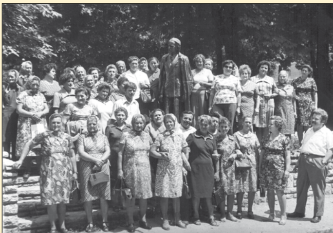
1977 – fellépés Csornán

Már 6 éve énekel akkor az asszonyokkal együtt, amikor felkérték erre a feladatra.