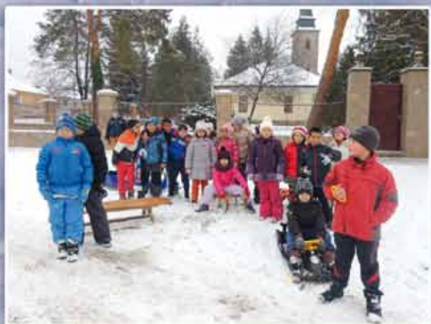
A gyerekek ezen a télen is nagyon várják a havat

Bogács minden lakójának kívánunk szent karácsonyi ünnepet és eredményekben gazdag, örömteli új esztendőt!