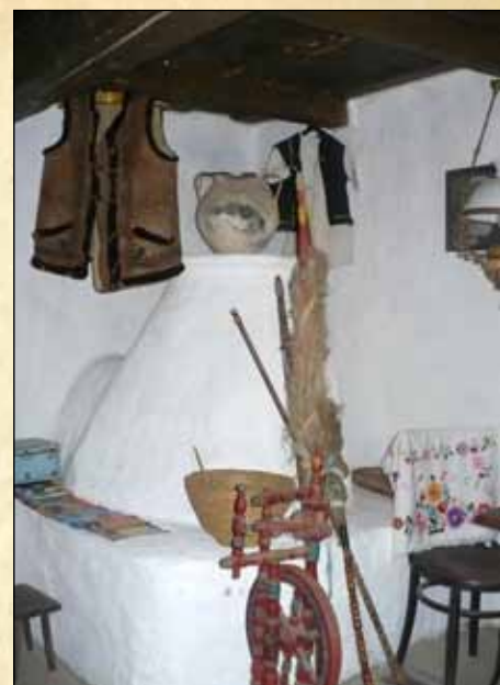
1996 - Tájház avatás a Szomolyai úton.