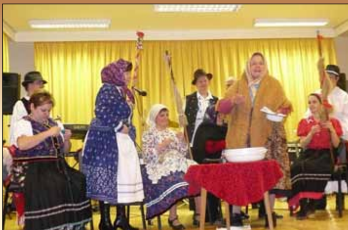
Pávakörös farsang 2008-ban