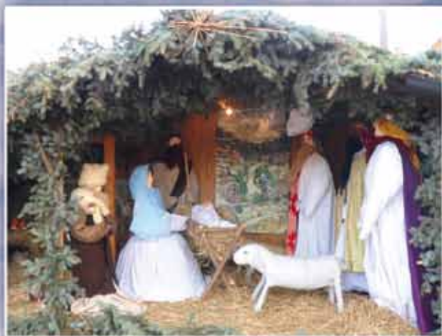
A betlehem a Fialatok terén található