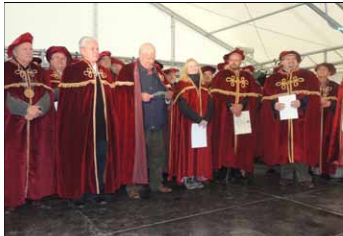
Borlovagrendünk új tagjai

„Szeresd a bort, mert az a barátság itala!”