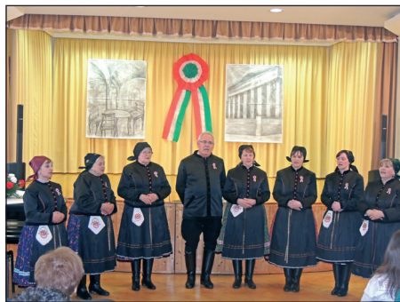
A Bogácsi Pávákör dalsokra

Bogácson évtizedek óta közös majális tartanak a falu lakói. A hagyományos zenés ébresztő évtizedek óta hozzátartozik az ünnephez. A civil szervezetek és az önkormányzat képviselői hatalmas üstökben, bográcsokban főtt jellegzetes bogácsi ételekkel vendégelik meg a majálisozókat. A gyerekek szórakozását kézműves foglalkozás, ugrálóvár, játékos versenyek, óriás trambulín biztosítja. A felnőttek számára tavaly először rendezték meg a parasztolimpiát, ahol bárki kipróbálhatja magát.