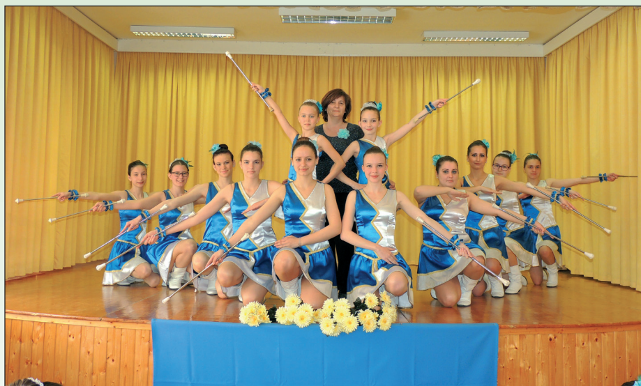
A Bogácsi Tündöklő Mazsorett Csoport