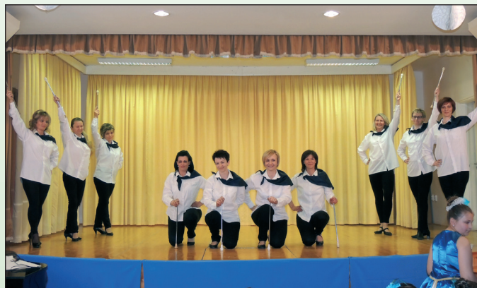
Az anyukák első fellépése jól sikerült