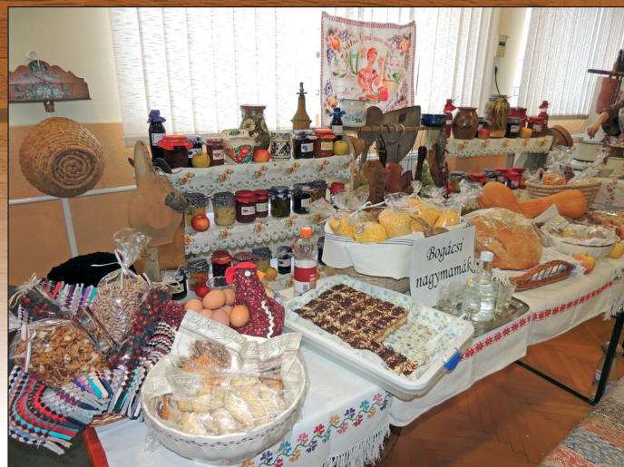
Bogács mindkét kamrája kivíta a zsűri elismerését

A múlt századig a kamráknak nagyon fontos szerepük volt a vidéki emberek életében, a házaik egyik alapvető, meghatározó helyisége a kamra volt. Az élelmiszerek mellett a háztartás és a gazdaság viteléhez szükséges felszereléseket, eszközöket, anyagokat tároltak benne. Emberi tartózkodásra is használták ezt a helyiséget, a fűtetlen kamrákban aludtak a nagycsalád lányai, asszonyai, fiatal házaspárok vagy idős családtagok. Védtek a hőmérsékletváltozástól, sohasem fűtötték, a dunna alá felmelegített követ, téglát tettek ágyemelegítő gyanánt.