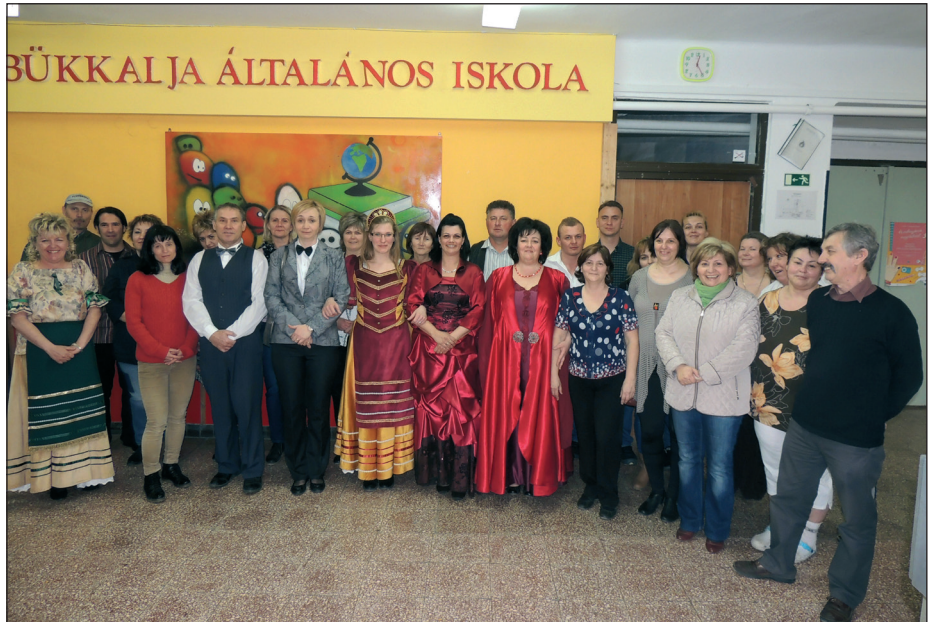
A verseny sikeres lebonyolításáért tevékenykedő szülők és a nevelőtestület néhány tagja

A verseny végére mindnyájan feloldódtunk, s kellemesen el is fáradtunk, de a