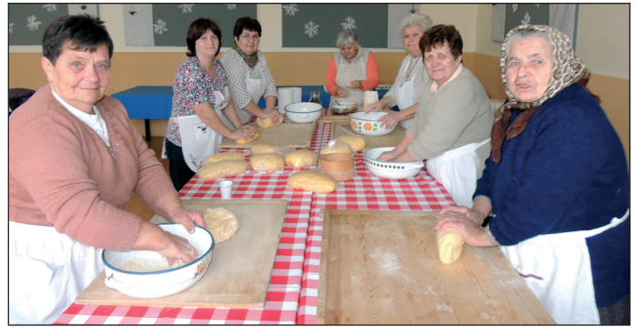
A tésztagyúrárs kemény fizikai munka, de mindnyájan tudjuk, hogy a házilag készített tésztá összehasonlíthatatlanul finomabb a boltban vásároltnál