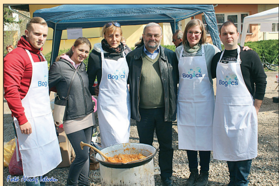
A bogácsi csapat Békés polgármesterével, Izsó Gáborral

BOGÁCSI TAVASZ Bogács Község Önkormányzatának lapja