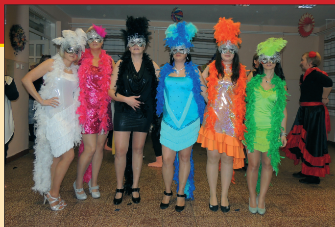
Színes műsorszámok és színes jelmezek jellemezték a felnőttek műsorát

Újítottunk abban is, hogy idén a Horizont zenekar húzta a talpalávalót – még hozzá hajnali 5 óráig.