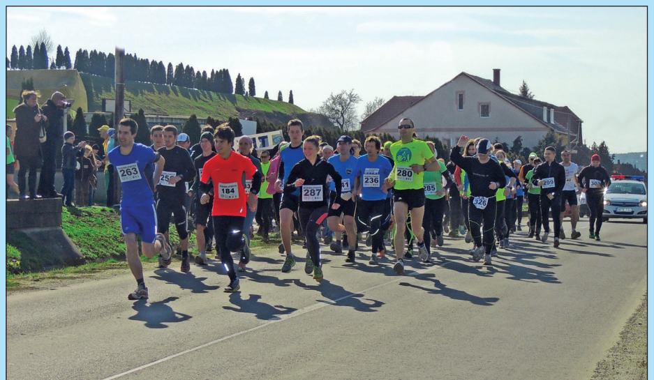
Rajtolnak a XII. Bo-Cse-Bükk futói

A sportolókat hagymás zsíros kenyérral, meleg teával és forralt borral várták a szervezők Bogácson. Minden nevezett induló a futás végén, a Bogácsi Thermálfürdő jóvoltából, a medencékben pihenhet ki a fáradalmait.