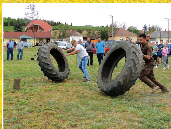
Traktorkerék gurítás az I. Bogácsi Parasztolimpián