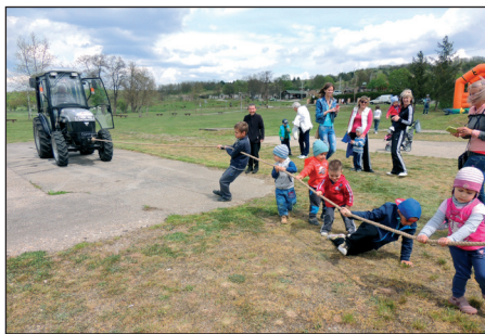
A traktorhúzásban a legkisebbek is részt vettek