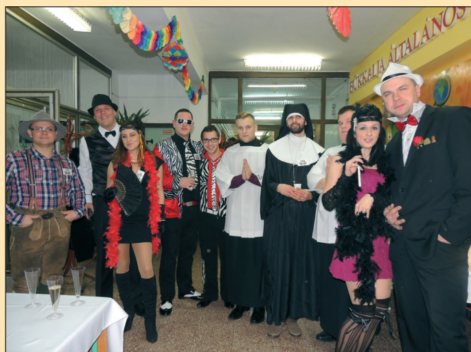
A bálozók is változatos jelmezekbe bújtak