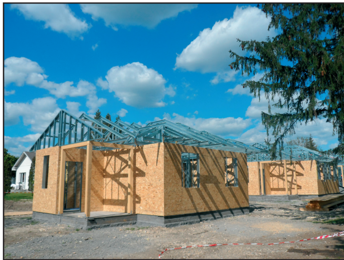
Június elejétől 8 modern apartmannel növekszik a fürdő területén lévő igényes szálláshelyek száma

Még elgondolni is borzasztó! Mégis vannak olyan vélemények, mely szerint az önkormányzat, mint tulajdonos túl sok figyelmet és pénzt fordít a termálfürdőre, és a település szépítésében elsőbbséget élvez a falu északi, a fürdőhöz közelebbi része. Ez valóban így van, hiszen ez a motor! Olyan gép, melyet, ha karbantartunk, fejlesztünk, és rendszeresen ellátjuk üzemanyaggal, akkor megbízható pontossággal üzemel, megkönnyíti az életünket, jobb életminőséget biztosítva valamennyiünknek.