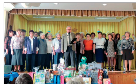
A mezőnagymihályi, a bükkábrányi és a bogácsi népdalkör együtt köszöntötte a vendégeket

Amennyiben anyagilag is lehetőségük van a támogatásra, azt megtehetik a Bükkalja Takarékszövetkezetnél vezetett számlánkra való utalással.