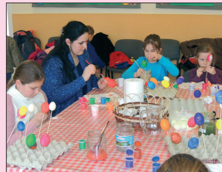
A tojásfestés különböző technikáját sajátíthatták el a résztvevők