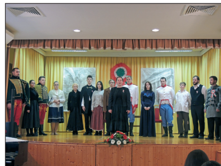
A Mezőkövesdi Amatőr Színjátszó Kör előadása