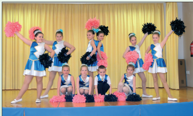
A Bogácsi Liliom Mazsorett Csoport

A csoport hagyománya szerint a 18 évet betöltött, nagykorúvá érett mazsoretteseknek ünnepélyes keretek