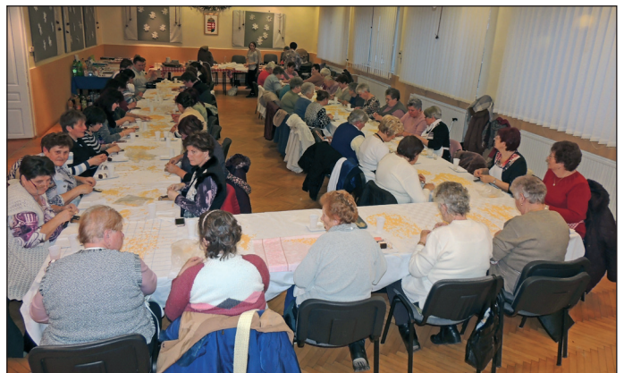
A jelenlévő 60 asszony és lány szorgos munkával 30 kiló csigatésztát készített