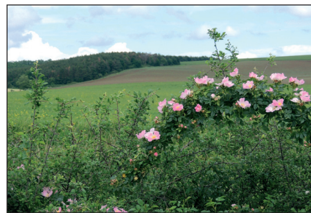
A Bogácsot körülölelő táj csodálatos tavasszal

bálhatta magát gumicsizma- és sodrófa dobásban, traktorhúzásban, traktorkerék gurításban és számos, pihent ésszel kitalált versenyszámban, ami az erőfitogtatás mellett módot ad a jókedvre, kikapcsolódásra.