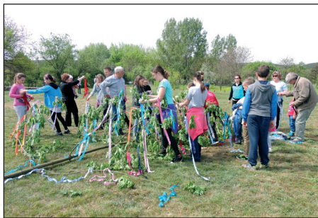
A májusfa közös díszítése hagyomány lett községünkben