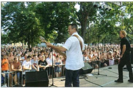
A BIKINI együttes koncertjére ezertől is többen voltak kíváncsiak

- Már a beruházás előkészítése folyamán felmerült a kérdés, hogy külön jegyáras legyen vagy beépítsük az alapárba a csúszda használatát. Megvizsgáltuk mindkét lehetőséget várható bevételi és üzemeltetési vonatkozásait. Az első lehetőség esetében, figyelembe véve a többi fürdő példáját, 1000 forintos külön napi csúszdajegy bevezetésével számoltunk, ebben az esetben – szintén más fürdők adataiból kiindulva – arra lehetett volna számítani, hogy a vendégek 10 %-a váltja meg a külön jegyet. A nyári vendégek száma 160.000 körül szokott alakulni, ez 16.000 csúszdajegyet jelent, ezt 1000 Ft-tal besorozva megkapjuk a várható bevételt. A másik esetben azzal számoltunk, hogy ha a tavalyi alap jegyárát 200 Ft-tal megemeljük a nyugdíjas jegyen kívül, akkor a nyári vendégszámból az átlagos 25.000 nyugdíjas vendéget levonva, 135.000 főt kapunk, ezt a számot 200 Ft-tal besorozva megkapjuk az ebben az esetben várható bruttó bevételt. A második verzió