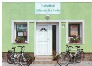
A Turisztikai Információs Iroda szolgáltatásai: kerékpárköcsönzés, ajándéktárgyak értékesítése, túraajánlatok, fénymásolás, nyomtatás, hirdetésfelvétel (a képviselőgala), ingyenes tájékoztatás, ingyenes internethasználat és wifi

Mindezek mellett szükséges az iparterületként kijelölt településrész fejlesztése, új munkahelyek létesítése. Kívánunk élni