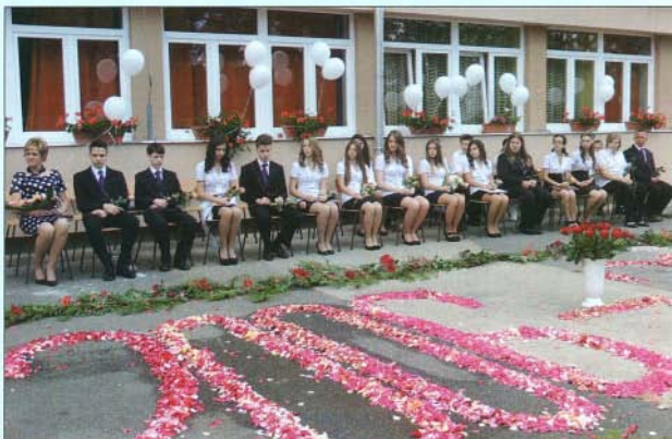
Ballagó diákjaink 2014 júniusában