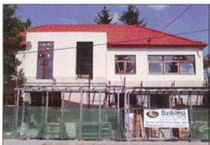
Tervezett ütemben halad az Egészségház felújítása és bővítése

A helyi gazdaság legfőbb motorja a turizmus, az önkormányzat tulajdonában lévő termálfürdő fejlesztései jelentős hatással vannak a helyi vállalkozások működésére, stabilitására. 2011-ben került sor arra a beruházásra, amelynek során medencék kaptak új burkolatot a fürdőben, egy vízi-játszóterérel bővült a legkisebbek szórakozási lehetősége, megújult a kempinghez és a medencéhez tartozó szociális blokk, és a nagymedence egy része fedés alá került. Ezt követte 2014-ben egy új csúszdapark építése, amellyel a településünk régi álma vált valóra, végre a fiatalok számára is vonzó lehet a bogácsfürdő!