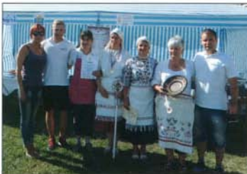
A mezőkövesdi Hagyományos Ételek Főzőversenyén csapatunk palóclevessével. Helyen végzett

Május 24-én tartottuk itthon a szokásos május végi főzőversenyünket. Tájak, ízek, hangulatok néven, „Hagyományörzés a fakand