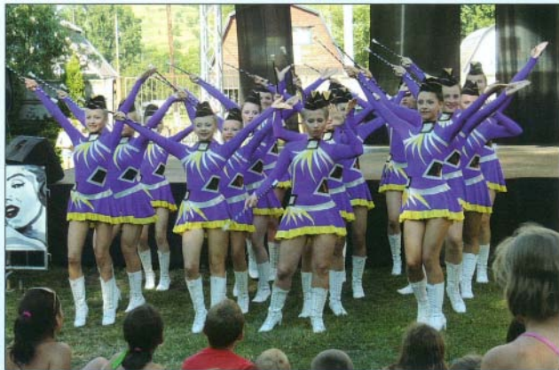
A lengyel országos bajnokságot nyert Ogrodzieniec-i mazsorett csoport műsorúrvál elkápráztatta a közönséget