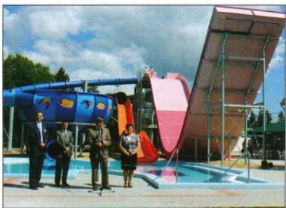
Június 27-én ünnepélyes keretek között adták át a csúszdaparkot a fürdővendégeknek

-Köszönöm az interjút. Viszontlátásra a bogácsi fürdőben!