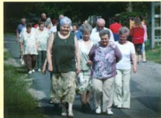
Együtt jökeadvien, mint 50 évvel ezelött

A találkozó következő programját így fogalmaztuk meg: 50 év 5 percben. Mire elegendő 5perc? Semmire vagy minden lényegesre. Szerecsnére az utóbbi tírten. Beszámolólag hangzottak el az általános iskola utáni továbbtanulásról, a családalapításról, a gyerekek, ma már unokák születéséről, munkahelyi sikerekről, munkanélkülségről, válságokról, családi tragédiákról. Többünk életében voltak nehéz időszoak, de mindig mindenkinek sikerült talpra állni, újrakezdeni. Öröm volt hallgatni, hogy a bajokat elfelejtve a jövőt tervező beszélgetések hangzottak el.