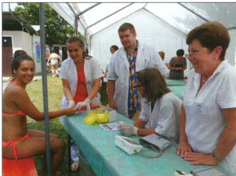
A szűrővizsgálatokba a fiatal egészségügyi dolgozók és egyetem hallgatók is bekapcsolódtak

Ízeleteink védelme és megővézése nagyon fontos, hiszen az időskori mozgásszabadságunknak és fizikai aktivitásunknak is ez az alapja, arról nem is beszélve, hogy minden egyes testmozgással eltöltött idő két órával hosszabbítja meg az életünket. Minden embernek naponta javasolt mozogni, ami leg-