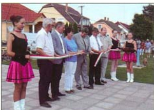
A pályaváratás ünnepélyes pillanata