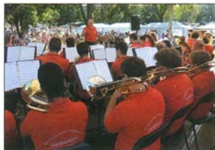
A Mezőkövesdi Fúvószenekar fergeteges koncerttel ajándékozta meg a hallgatóságát