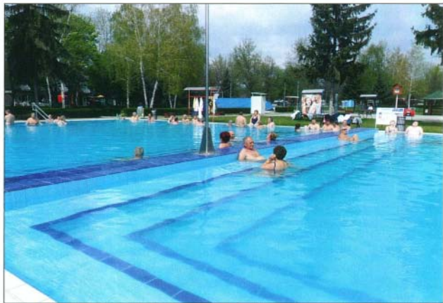
Az új burkolattal ellátott ikermedencét már használhatják a gyógyulni vagy felüdülni vágyó fürdővendégek

Nagyjából kétszer ekkora utat tehetünk meg a „ Blackhole + Up hill flying boats ” (magyarul mondhatjuk így: „ egy fekete lyuk után felfelé repülő csónak ”) kettős csúszdáján. Előbb egy csőben (fekete lyuk) ha-