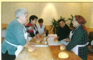
Tapasztalt asszonyok gyúrták a tésztát

A közelmúltra visszatekintve láthatjuk, hogy a fürdő megnyitása, majd az ismert-