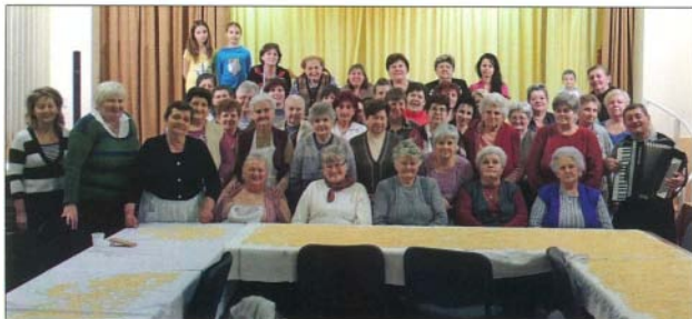
A csigacsinalók népes tábora