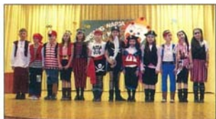
A 2. osztályos kis kalózok

Március első napján került megrendezésre az iskolai farsangi bál. Hosszas előkészületek után jó hangulatban tel el ez a szombati délután. Az előző évekhez hasonlóan az első osztályosok egyéni jelmezzel vonultak fel. A színpadon cica, királylány, legó, virág, varázsló jelmezbe öltözve jelentek meg. Bizonytalan kis léptekkel mutatták meg magukat és jelmezüket a közönségnek és a zsűrinek. A felsőbb osztályosok csoportos produkciókkal készültek. A próbákkal telt délutánoknak, a jelmez- és díszletkészítések munkálatainak eredményeként színvonalas jeleneteknek lehettünk tanúi. A másodikok kalózok a tengerek fenegyerekeit, a harmadik osztályosok a vadnyugat country hangulatát igézték meg, majd a negyedik osztály segítségével egy circuszi előadás részesei lehettünk. Végül a hatodikosok Fekete-fehér és a hetedikesek Egy szoknya egy nadrág című táncos produkciója következett. Az összhangban lévő láb és kézmozdulatok, a ritmusos zene tapsra buzdította vendégeinket. A zsűri tagjai hosszas tanakodás után a Csibum circuszi előadását értékelték az első helyre, de természetesen minden résztvevő kapott apró ajándékot és oklevelet a Szülői Munkaközösségtől, amit a gyerekek boldogan vettek át.