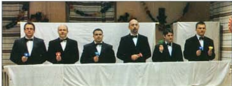
Az apukák műsora most is mosolyt csalt az arcokra