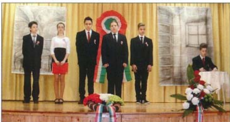
Az ünnepi műsor főszereplői az általános iskolások voltak