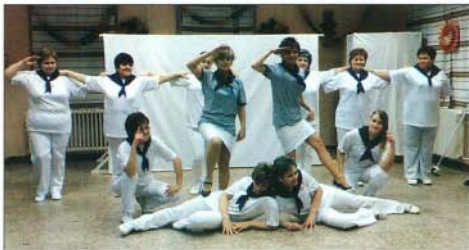
Az óvónők matrözruháiban is „megálták helyüket”