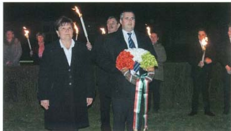
Koszorúzás az iskola előtti emlékműnél