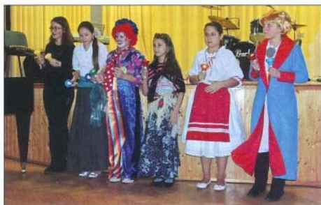
A zene hangulatához illő látványos jelmezekben léptek fel a résztvevők a farsangi koncerten