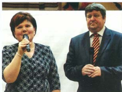
Csendesné Farkas Edit polgármester asszony és Tállai András államtitkár úr köszöntötte az óvodai bál résztvevőit