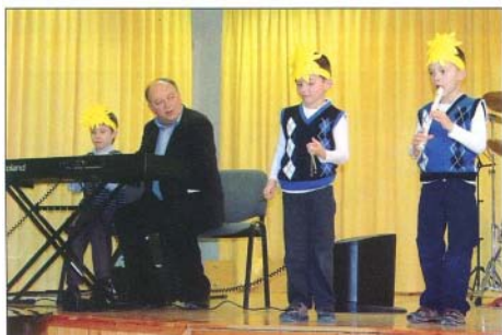
Ügyesen megszólaltatták hangszereiket a legkisebbek is