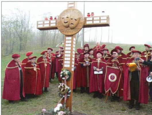
A Szent Márton Borrend tagjai évek óta sokat tesznek Bogács jó hírért

Egy biztos, az Akik bogácsinak vallják magukat című lexikon június első felében – Önnel vagy Ön nélkül – megjelenik.