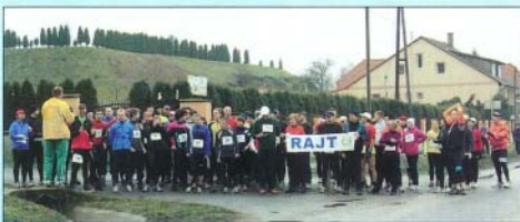
A rajt előtt mindenki bizakodó volt