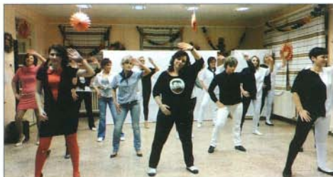
Szülők, óvónők önelekt tánc