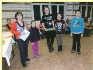
A győztes csapat az eredményhirdetés után

A 4 órás rendezvény végén, a Kerti étterem felirattal helyszínen a pincéreknek öltözött szülő felöltözött a Vadvirág étterem szakácsai által elkészített izletes vacsorát, amit a tanulók jó étvágygyal fogyasztottak el a nagy kalandok után, az eredményhirdetésre várva.