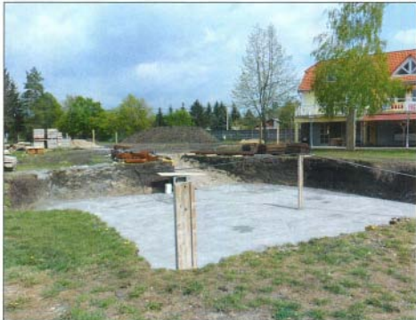
Áprilistól elkezdődtek a csúszdapark építési munkálatok