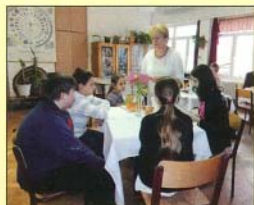
A regény szereplőivé váltak a gyerekek és a felnőttek

Nekem, mint könyvtárosnak különösen szívet melengető volt találkozni az olvasás népszerűsítésének ügyéért tenni akarókkal, támogatni hajlandó emberekkel, szervezetekkel 2014 tavaszán is. A 8. Meglevenídedt oldalak kalandos olvasóverseny sikeres lebonyolítása érdekében ugyanis most is sok szülő, volt tanítványunk, intézményvezetőnk, helyi vállalkozók fogtak össze a pedagógusokkal.