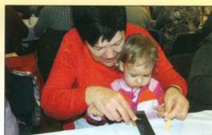
Nem lehet elég korán kezdeni a csigacsinalást sem

Előre meg nem beszélt rendben haladt a munka: a népes jelenlévők egy része még több kiló tésztát gyúrt be, néhányan nyújtották és darabolták, két kislány rendületlenül hordta az asztaloknál ülőkhöz a tésztacsikokat, legtöbben viszont ördögi gyorsasággal pincergették a csigát. Az idősebeiktől azt is megtudtuk, hogy régen kis-méretű kockákra vágták a tésztát, az orsó