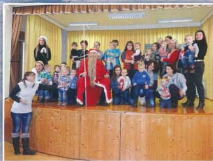
A legkisebbekhez is ellátogatott a Mikulás