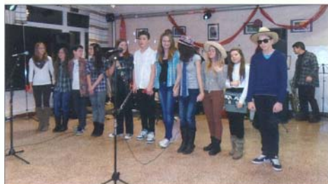
A 8. osztály zenekara és énekesei a KFT együttes nagyszerű számát adták elő