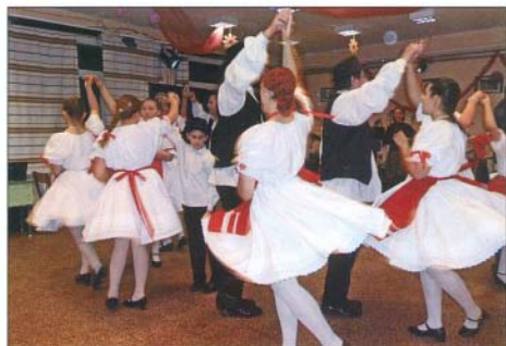
Jótékonyági bál az iskolában