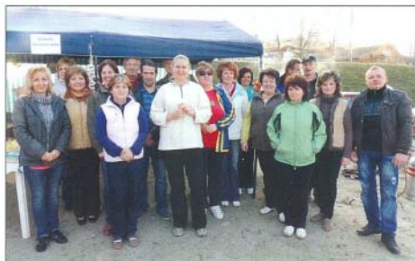
A sátrat legszebben díszítők csapata