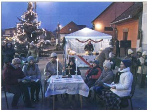
Szentcsalád-járás hagyományának felelevenítése