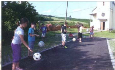
Sportversenyekre mindenki szívesen jelentkezett