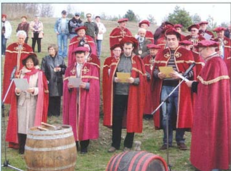
Az új borlovagok eskütétele