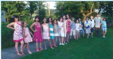
A divatbemutatóra szépen felöltöztünk

A harmadik napon a reggeli után buszra ültünk és elindultunk Miskolcra. Egy bevásárlóközpontban vásároltunk ajándékokat szüleinknek, testvéreinknek, majd izgatottan ültünk be a moziba. A filmnek Szörny egyetem volt a címe. Nagyon tetszett mindnyájunknak, mert érdekes és vicces szörnyek voltak a mesében, amit 3D-ben néztünk meg. A film után ebédelünk. Ezután a Színház-történeti Múzeumot látogattunk meg.