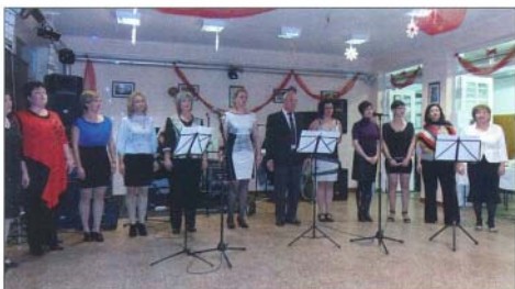
A pedagógusok és szülők kórusa vastapsot kapott