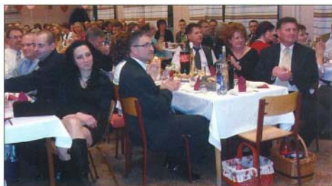
Ismét sokan támogatták az iskolás gyermekeket