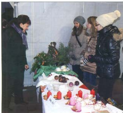
Első bogácsi karácsonyi vásár