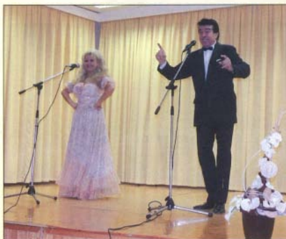
Az operett utazó nagykövetei Bogácsra látogattak