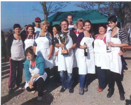
Kiemelt Fődíjait érdemelt főztjéért a Thermálfürdő Kft. csapata

A csapatok szeretettel várták a kóstolni vágyó érdeklődőket. A programon kiváltképp nagy volt az érdeklődés a kóstolójegyek iránt, hisz több mint ezer kóstolójegy került beváltásra. A bogácsi csapatok ismét kiemelkedő eredményeket értek el a tárcsás ételek elkészítésében. A Lövészklub a „Legötletesebb Étél” címet, a Téli Sport Egyesület a „Legszakmaibb Étél” címet, a Polgármesteri Hivatal csapata a „Legegységesebb Csapat” címet, a Bogácsi Thermálfürdő Kft. pedig a Kiemelt Fődíjait, azaz a vándorserleget nyerte el, míg a Bükkalja Általános Iskola csapata a szépen feldisznított sátrával hívta fel magára a zsűri figyelmét.