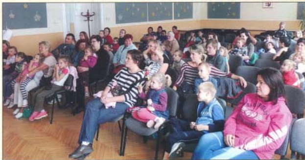
A bábeloadás nézőinek tetszett a történet

Aki a fűtcán sétál, a bogácsi könyv-tár épületének falán a következőket ol-vashatja: II. Rákóczi Ferenc Megyei és Vá-rosi Könyvtár Könyvtári, Információs és Közösségi Szolgáltató Helye. Ez azt jelen-