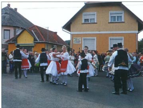
Fellépés a szüreti mulatságon

2011 őszén egy kevés tagot számlálók, de annál lelkesebb csapat állt össze azzal a céllal, hogy kultúránkat, hagyományainkat újra megszerezzék, ápolják és megalapítsák Bogács néptáncsoportját. Mi voltunk az a lelkes csapat, a Tündérrózsák! Az első órákon még kicsit szegényesen ismerkedtünk a zenével, egymással, a lépésekkel, majd egyre jobban kinyitunk, ügyesedtünk, és ami a legfontosabb: gyarapodtunk! Nemsokára jött is a majális, az első fellépésünk, ahol megmutattuk mit is tanultunk fél év alatt. A sok gyakorlás és izgalom után a siker sem maradt el, vastapsot kaptunk!