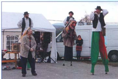
A Vaga-Banda Társulat a közönséget is bevonva szórakoztatott