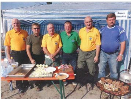
A legötletesebb étel készítői

A tavalyi évhez hasonlóan az idén is bebizonyosodott az, hogy egy ilyen gasztronómiai eseményre szüksége van Bogácsnak. A fesztiválon 13 csapat készítette tárcsán az ételeit, voltak, akik egyszerre több tárcsán is megmutatták, hogy mire képesek. Több mint hatvan féle ételből válogathattak az érdeklődők, a csapatok különböző ételkülönlegességeket is készítettek, mint például: mustban és borban áztatott mazsolás szüreti kolbász, pácolt császárhús és oldalas, tárcsán sült mangalicakolbász és bősös vaddisznósült.