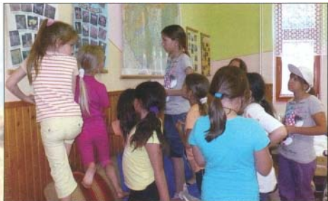
Szobánk falain a védett növényekről olvastunk