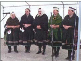
A pávakörösök téli viseletben nem fázta a zord időben

életében legendák keringtek, püspökké akarták szentelni. A monda szerint mikor ennek hírért vette, az érte jövő küldöttek elől nagy alázatosságában a ludak ójába bújtt. A szárnyasok azonban gágogásukkal, szárnyuk verdesével óriási zajt csaptak, így elárulva Márton rejtekhelyét. Márton 371-ben püspökké szentelték és haláláig, 398-ig Tours-ban segítette a rászorulókat. Szent István tisztelete jeléül a zászlaira a hadvezér Márton képét festette. A hagyomány szerint a szent egy álomban a király és az ország védelmére sietett. Így lett Szent Márton az ország védelmezője Szűz Mária után.