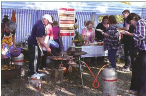
A női tornászok fitteek voltak a főzésben is

Mindkét napon szép számmal érkeztek csapatok, akik mind a zsűrit, mind a közönséget szeretnék volna főztjükkel elkápráztatni. A főzősátrak közül többet is helyi csapatok foglaltak el, de a határon túlról és az ország más pontjairól is érkeztek társaságok, akik főztjét minden érdeklődő megkóstolhatta.