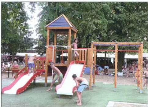
A gyerekek örömmel vették birtokba a modern játszótér