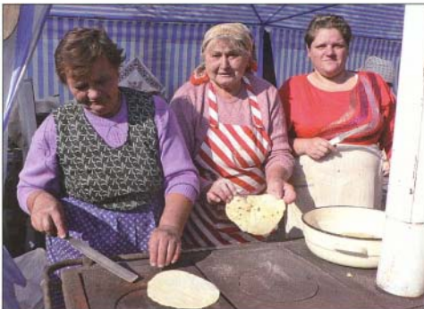
A hamisíthatatlan placki masinán sült

A Tárcsás Ételek Fesztiválja második alkalommal került megrendezésre a gyönyörű őszi hosszú hétvégén. A tavalyihoz hasonlóan, az idei évben is bebizonyult, hogy szükség van egy ilyen jellegű gasztronómiai rendezvényre Bogácson. A programon 10 csapat tárcsán készített ételeit – különböző húsokat, zöldséget, gyümölcsöt – volt lehetősége megkóstolni a pincesorra ellátogatóknak. Az érdeklődés kiváltképp nagy volt, hisz több száz kóstolójegy került beváltásra. A bogácsi csapatok kiemelkedő eredményt értek el a tárcsás ételek készítésében. A Turisztikai Egyesület a „Legjobbban Összeállított Ételek” címet, a Lövészklub a „Legvidámabb Csapat” címet, a Női Fitt-lesz Csapat a „Szabadtűzi Lovagrend Hagyományörzésért” díját, a Polgármesteri Hivatal csapata a „Legegészsé-