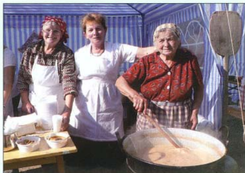
A pávakörös asszonyok nagy rutinnal készítették a summáss ételeket

gesebb Étel” díjat, a Bükkalja Óvoda a „Legszebben Összeállított Étel” címet nyerte el, míg a Pulykakör az ifjúsági kategória 1. helyeztje lett.