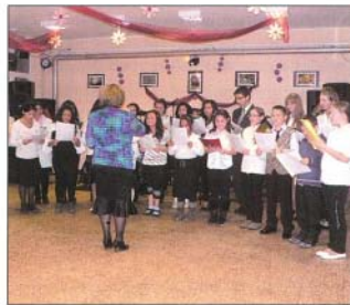
Az énekar vidám dalt énekelt a Bükkalja Általános Iskoláról