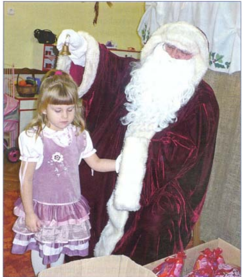
A Mikulás csengője megszólalt minden jó gyerek feje fölött

Október végén ellátogatott hozzánk a már ismerős DIRIDONGÓ Együttes az Őszköszöntő című zenés interaktív műsorával, melyet nagyon élveztek a gyerekek. November elején fogászati szűrővizsgálatra mentünk át a fogorvoshoz.