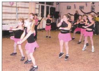
A kicsik akrobatikus táncra zárta a gyerekek műsorát