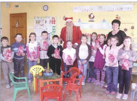
Az iskolában az elsősök nagyon örültek a Mikulásnak