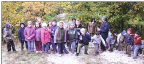
A legkisebb tanulók is felkapaszkodtak a kaptárkövekhez.