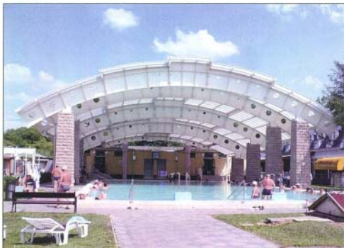
A felújítás új arculatot adott fürdőnknek

Nem volt önerő a pályázatokhoz, vagy ha volt is, azt másra használta fel az önkormányzat, például saját erőből meg