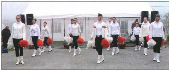
A Mazsorett Csoport is „téliestette” öltözetét