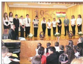
Az iskolások ünnepi műsora

Tizenhárom nap. A forradalom tizenhárom napja az 1956. október 23-i tüntetések kezdetétől a szovjet Forgószél hadműveletig, a szabadságharc kezdetéig. Ha a történelem léptékével mérnénk, még a magyar történelemhez mérten is kevesebb, mint egy tizedet részben számolhatnánk. A legújabb kori magyar történelem dicsőséges tizenhárom napja még sem valami múltó villanás. A forradalom és az ezt követő szabadságharc éles rést ütött az akkor megdönthetetlenek, legálábbis az akkor élő nemzedék életében megingathatatlanul hitt szovjet rendszer alapzatába. Ahhoz kevés volt ez az idő, hogy kialakuljon a forradalom egyéges eszmerendszere, letisztuljanak a la-