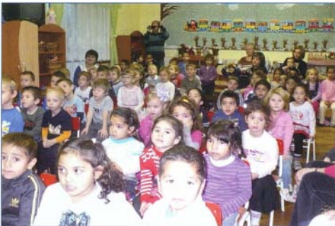
A kicsik figyelmét lekötötte a bábjáték