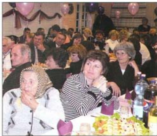
Nagy örömről sokan vettek részt az iskolai bálon