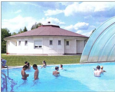
A Jurta Üdülési Központ ideális pihenőhely

Megnövekednek az ellátandó feladatok is, hiszen nagyobb projektek nagyobb adminisztrációt és bonyolultabb megvalósítást jelentenek az Európai Unió pénzfelhasználása pedig köztudottan egyre nehezebb, bürokratiku-