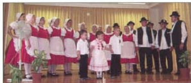
Színpadon a Szomolyai Népdalkör