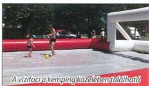
A vízifoci a kemping közelében található

Az Önkormányzat gyors és hatékony intézkedéseinek köszönhetően sikerült a kivitelező gondatlansága következtében tönkrement ikermedencék rendbehozatala, a medencék teljes újraberuházásával, így június 12-től teljes kapacitással működünk. Néhány mondat az eredményességről.