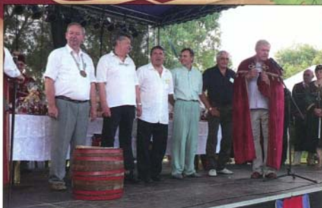
5 új tagot avatott a Szent Márton Borrend