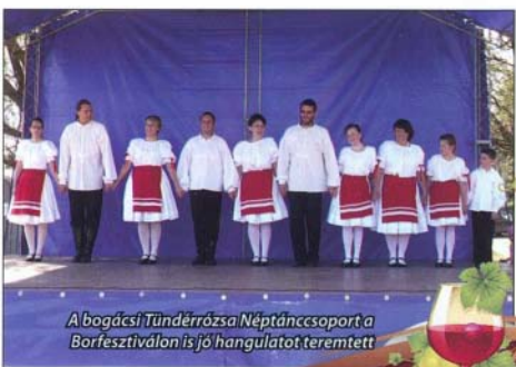
A bogácsi Tündérróza Néptáncsoport a Borfesztiválon is jó hangulatot teremtett