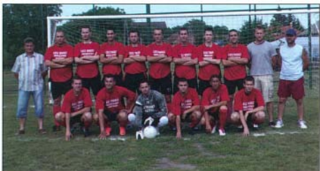
A 2011/2012 B.A.Z. Megyei II. osztály Közép csoport