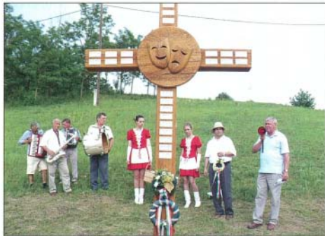
A bortúra résztvevői a magyar színészekre is emlékeztek