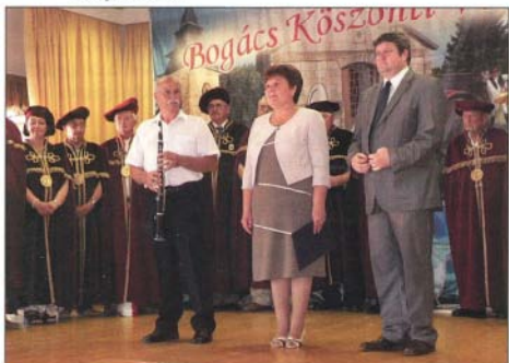
Tállai András államtitkár úr volt a jubileumi borfesztivál egyik védnöke

A hagyományokhoz híven, az idén újra elindult a bortúra június 22-én, pénteken a Cserépi úti pincesoron Csáter apó pincéjétől, a zamatos borokra szomjazókat számos pincékben várták a tulajdonosok.