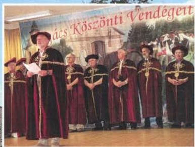
A XX. Borverseny szervezői a Szent Márton-Borrend tagjai voltak