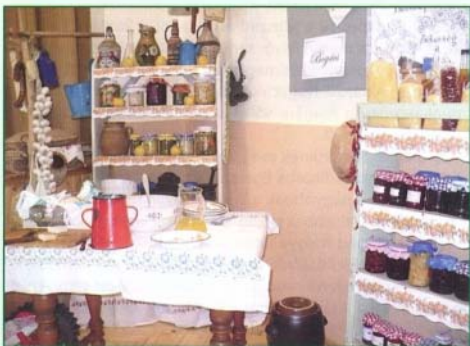
A bogácsi „komrában” sokféle ételtárolásra használatos eszköz is láthatunk

A házilag készített tészta, lekvárok, gyümölcsök, zöldségek, savanyúságok, befőttes mellett a hagyományörzők bemutatták használati tárgyaikat is; a nyersanyag-tárolás céljának megfelelő edénye-