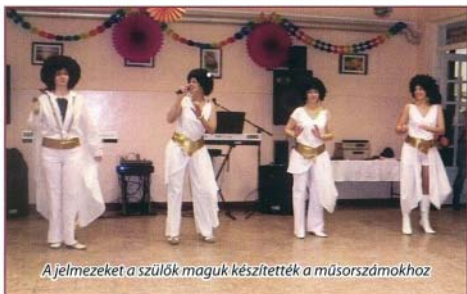
A jelmezeket a szülők maguk készítették a műsorszámokhoz