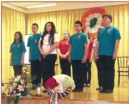
1948/49 emléket a szívűnkben őrizűk