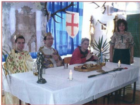
A korhűen berendezett lovagteremben „királyok” várták a versenyzőket

Az újszerűnek mondható, kalandos vetélkedőn mindnyájan jól éreztük magunkat. Együtt izgultunk és együtt örültünk a gyerekekkel. A regény szemelvényeivel kapcsolódó feladatok teljesítése közben részesei lehettek a tanulók az izgalmas történetnek. A leleményességet, bátorságot, ügyességet, erőt, logikus gondolkodást igénylő feladatokon keresztül mi pedig pontosabb képet kaptunk tanulóink emlékezetének, fi-