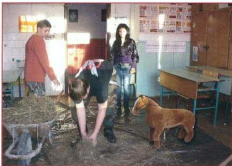
Az egyik tanteremben berendezett istállóban dolgozni kellett a megszerezhető pontokért