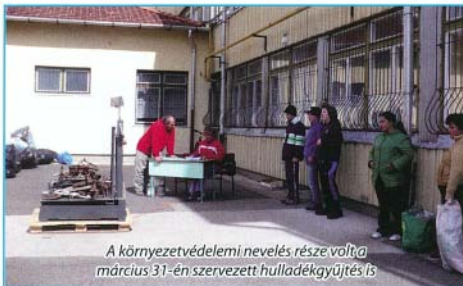
A környezetvédelmi nevelés része volt a március 31-én szervezett hulladékgyűjtés is.

A Bükkalja Általános Iskolában már hagyománnyá vált, hogy megemlékezünk erről a napról. Az idén vetélkedő formájában hívtuk fel a figyelmet a víz fontosságára. A tanulók csoportokban versenyeztek egymással. Vízikereket készítettek, megismerkedhettek a bogácsi gyógyvíz kedvező élettani hatásával, az ivóvíz fontosságával. A községét bejárva, térkép segítségével felfedezték a közutakat. Bizonyították a vízrel kapcsolatos földrajzi és történelmi ismereteiket totók ki-töltésével. Tanári vezetéssel érdekes fizikai és kémiai kísérleteket végeztek el. Az izgalmas levelezéseket játékos „vizés” feladatokban is jeleskedtek.