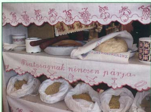
Egyszerűségükkel nyugtözték le bennünket a népi hagyományok