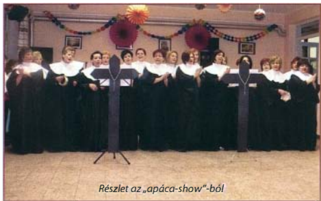
Részlet az „apáca-show”-ból