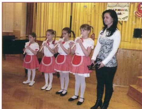
Üde színfoltja volt a zenei farsangnak az 1. osztályos lányok előadása

A hangverseny koronája mégis csak a koncertet záró közös éneklés volt, ami az előre kiosztott dal (Kell még egy szó, mi-