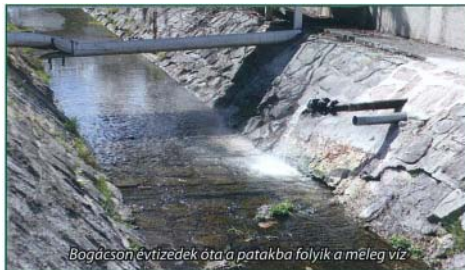
Bogácsosn évtizedek óta a patakba folyik a meleg víz