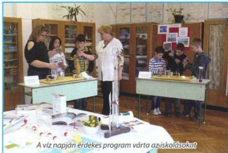
A víz napján érdekes program várta az iskolásokat.

Ahol víz van, ott élet is van, de sajnos egyre kevesebb az életető vízzel. A Földön kevés víz keletkezik, a meglévő forog körbe. Az esővíz végigfut a szárazföldön a folyókig, tengerekig, ott párologni kezd és felhő lesz belőle, majd eső formájában a földre hullik.