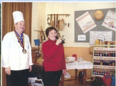
Az I. Kamra Mustra sikeres volt

Kellemes húsvéti ünnepeket kívánunk olvasóinknak!