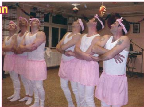
A balett-táncos apukák nagy sikert arattak