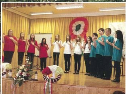
Az iskolások felemelő márc. 15-ei megemlékezése