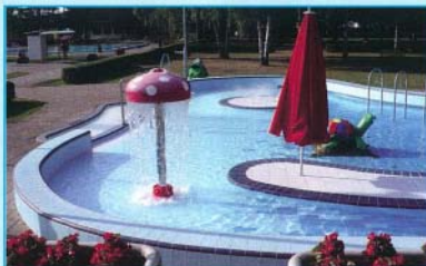
Az új medence élményelemei a kisgyermekeknek nyújtanak játékos felüldülést

A Mikulás-party sikerén felbuzdulva további zenés fürdőbulik rendezését kezdtük meg. Az első farsangi és nőnap karaooke-s medence-party is sikeresnek volt mondható, hiszen mindkét rendezvényen közel 200 vendég élvezte a bulit. A következő zenés éjszakai esemény a húsvéti lesz, április 7-én, szombaton „Locsolkodj termálvízzel!” szlogenrel.