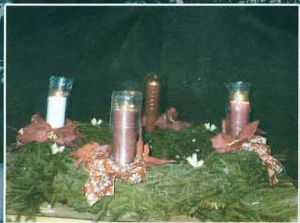
A Bogácsi Emlékkő előtti adventi koszorú a karácsony közeledtét jelzi

Szeretetteljes, békés karácsonyt kívánunk olvasóinknak!