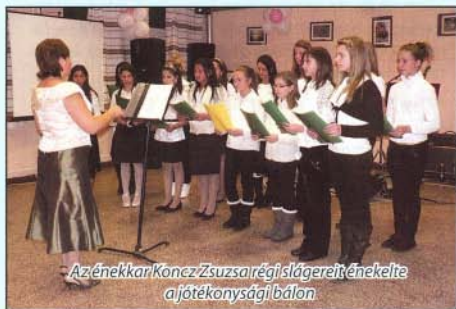
Az énekkar Koncz Zsuzsán régi slágereit énekelte a jótekonysági bálon.