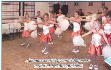
A kis mazsorettek gyermekslágerekre mutatták be koreográfiájukat.