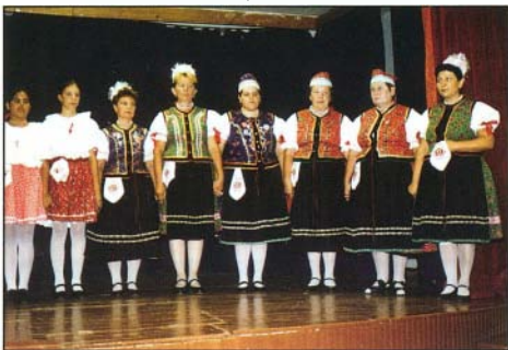
Kulturális rendezvény a Közösségi Házban 2002-ben

Egyházi ünnepeinken mindig szeretettel és szívből énekelnek a több mint 750 éves templomunk falai között.