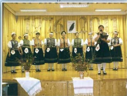
35 éves a Bogácsi Pávákör.