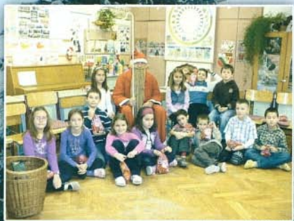
A másodikosok az Idén nagyon várták a Mikulást