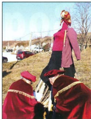
Boszorkányégetés borlovagrend módra