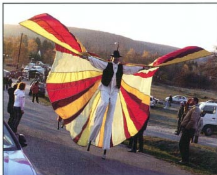
A golyálabasok lenyűgözték a közönséget

Pénteken újra sor került a Thermálfürdőben a kedvelt esti fürdőzésre. Szombat délelőtt a Szent Márton Borlovagrend tartotta ünnepi közgyűlését a Községi Házban, majd kora délután a főszerep ismét a borlovagoké volt, akik a Nemzet Színészei Ligetébe vonultak, hogy vidám ünnepség keretében köszöntsék az új bort és a nagyszámú érdeklődő közönséget.