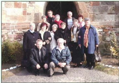
A templom előtt indult a félévszázados osztálytalálkozó