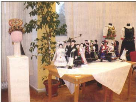
A matyó ünnepi népviselet mellett láthatjuk a bogácsi paraszti világ aratást bemutató életképet

A Mezőkövesden, illetve a kistérségben tevékenykedő népművészek és amatőr alkotók munkái voltak megtekinthetők november 25 és december 16 között a mezőkövesdi Községi Házban.