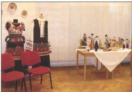
A szentistváni népviseletek között kapott helyet a bogácsi lakodalmas menetet bemutató életkép