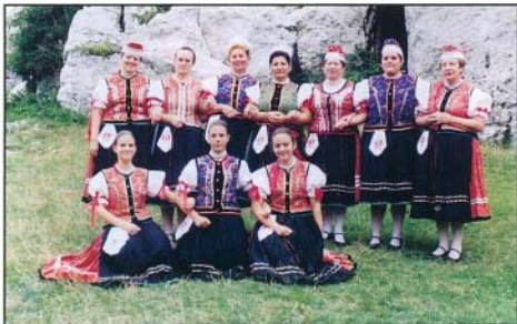
2004-ben a lengyel testvértelepülésünkön is száryalt a magyar népdal

1999-ben a Vass Lajos Szövetség által kiírt Kárpát-medencei verseny eredményeképpen Vass Lajos Nagydíjasok lettek, 2006-ban másodszer is azok lettek. Többszörös Arany-páva díjasok, s tavaly Vass Lajos Nívódíjat érdemeltek ki a zsűri elismeréseképpen.