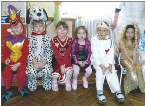
Jelmezben a nagycsoportosok egy része

A farsang vízeresztőtől, január 6-tól a húsvétot megelőző negyven napos böjt kezdetéig, hamvazószerdáig terjedő időszak. Ez egyben a bálók, a vidám mulatságok, a lakomák ideje is. Ennek a hagyománynak tisztelegve kerülnek megrendezésre szerte az országban ilyen idő tájt a farsangi bálók.