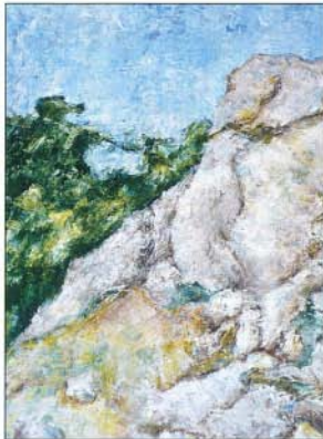
Illusztráció: Erdel Ferenc

Csiri Adriántól palóc legendamesét hallhattunk kitűnő előadásban. Zsák Terézia Mátyás királyról mesélt nyugalmat árasztó hangon.