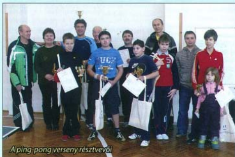
A ping-pong verseny résztvevői

Január 29-én, szombaton délelőtt került megrendezésre első alkalommal Bogács az Amatőr Asztalitenisz Verseny a Bükkalja Általános Iskola tornatermében. Két korcsoportban: felnőtt férfi és fiú ifjúsági kategóriákban zajlottak a küzdelmek a régi ping-pong szabályok szerint. A két korcsoportban bajnokságot rendeztünk, azaz minden induló játszott mindenkivel. A játszmák megnyeréséhez 21 pontot kellett elérni. Őt