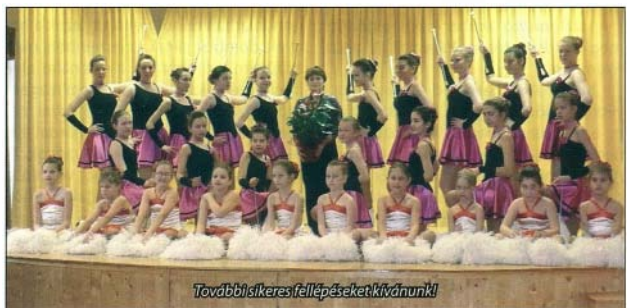
További sikeres fellépéseket kívánunk!