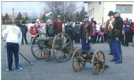
Szemléletes történelmi óra helyszíne volt az iskola udvara