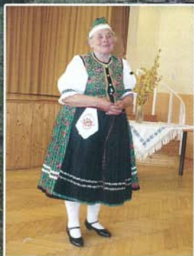
Manci néni ismét józseuen mesélt

Fürdőfejlesztés Télbúcsúztató vigasságok Nemzeti ünnepünk Turisztikai irányelvek Családias irodalmi est 10 éves a Mazsorett Csoport Diákönkormányzat munkája