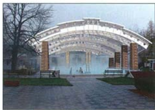
Látványterv az első medence lefedéséről