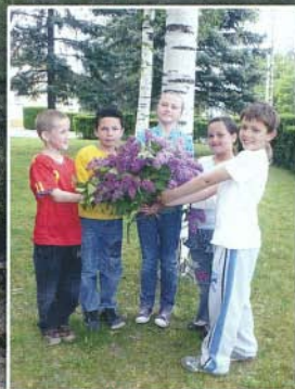
Szeretettel köszöntünk minden édesanyját és nagymamát!