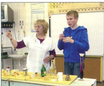
Érdekes kémiai kísérletek láthatók a víz világnapja program résztvevői