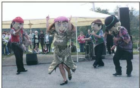
A mulatós zenét játszó Füstifecskek zenekar 4 roma zenésznek öltözött bábja először „rakott fészket” magának a Cserépi úti pincesoron. Nagyszerű koncertjük után reméljük költöző mádárként - közkívánatra - visszatérnek még Bogácsra.