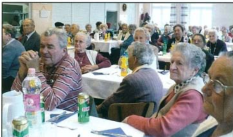
Az idősök figyelmesen hallgatták a köszöntő szavakat