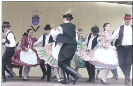
Augusztus 7-én a Táncfesztiválon a Gyöngykalásis Kamara Táncegyüttes fergetege előadása elnyerte a fürdővendégek tetszését. A magyar népzene és néptánc bemutató mellett, has tánc, salsa és mazsorett koreográfiákat látott a közönség.