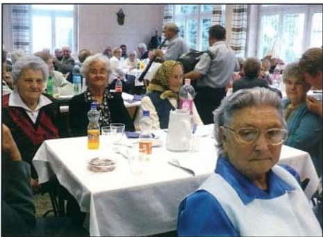
Az ismert dallamok felvidították az idős embereket