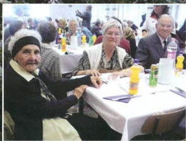
Október 1-jén az időseket köszöntöttük