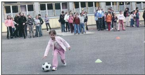
Kicsik és nagyok együtt ügyeskedtek a játékos sportversenyen

Elméleti tudásukról az Egészség totóban mérettettek meg az egyes csapatok, melyeket úgy alakítottunk ki az egyenlő erőviszonyok elérése érdekében, hogy minden csapatba kisebbeket és nagyobbakat is beosztottunk. A gyakorlatilag hibátlanul megoldott feladatok a gyerekek tájékozottságáról adtak tanúbizonyságot.