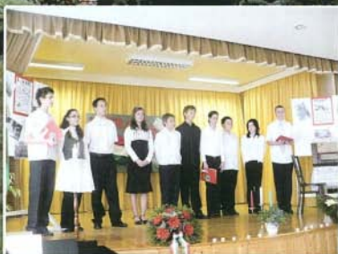
Október 23-i ünnepség