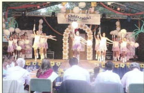
Augusztus első napjaiban a Bogácsi Mazsorett Csoport Abádszalókon táborozott. A kellemes pihenés mellett a lányok sokat gyakoroltak, és felléptek a település egyik leglátogatottabb rendezvényén, a Miss Alpok Adria Szépségversenyen.