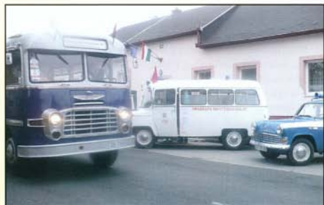
Szeptember 18-án a Polgármesteri Hivatal előtti parkolóban megcsodálhattuk az 50 évvel ezelőtti, sőt még ettől is öregebb járműveket. A VOLÁN által használt Ikarus 31-es veterán buszba beülő felnőttek mesélte volna gyermekeiknek a régi idők közlekedéséről.