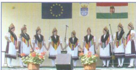
A Magyartradereskei Asszonykórus énekelésével és színes népviseletével is sikert aratott

E nemes gondolatokat tartalmazó beszéd után felcsendültek népdalaink a fűrdővendégek, a dalosok és a zsűri legnagyobb örömére.