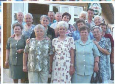
A fürdő „hős korának törzsgárdája”