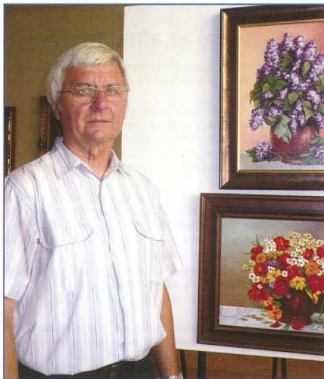
Járó Ferenc festményeivel