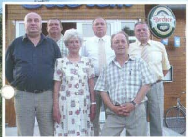
Almút és a jelen találkozósa: egykori és jelen fürdővezetők és polgármesterek