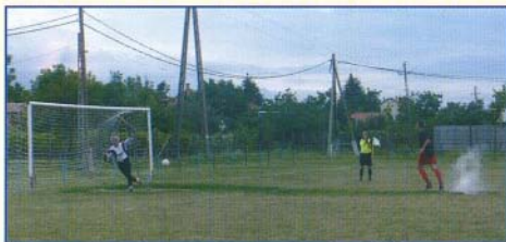
Hárskút ellen 11-est értékesít a bogácsi játékos

Nyikes Mátyás személyében új edzőt köszönhetünk a bogácsi futballcsapatnál. Ittes Endre a Sportkör elnöke több edzőmérkőzést szervez a nyárra, hogy a csapat összeszokjon az őszi idény kezdetére. Az eredmények eddig nem éppen biztatóak (Monostorpályitól 8, Hárskúttól 7 gólt kaptunk), de az új játékosoknak vannak jó megnyilvánulásai, ami a csapatszellem kialakulása után kedvezőbb eredményt hozhat.