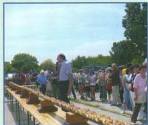
Az újvilágrekord hitelesítése

Megrendezésre került a hagyományos süteménysütő verseny és természetesen most is született világrekord: 14 méteres mazsolás fonott kalács, aminek elkészítési folyamatát lépésről-lépésre figyelemmel kísérhettek minden érdeklődő. A rekord hitelesítése után újabb csúcstól lehetett volna mérni, ha valakinek ez eszébe jut, hiszen az érdeklődők fürgeségének köszönhetően rekordgyorsasággal foggyott el a finom mazsolás kalács.