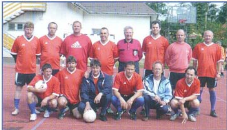
Bogácsi Öregfiúk csapata

Kezdező hír: Május 30-án a hagyományokhoz híven megrendezett Jurtá Kupa Öregfiúk focitornán Bogács Öregfiúk csapata 2. helyezést ért el.