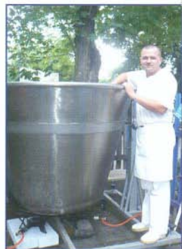
Óriásbográcsban főzni a szakácsnak sem könnyű

Ismét jól sikerült rendezvényt tudhatnak magukénak a szervezők.