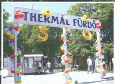
Ünnepi díszben a bejárat