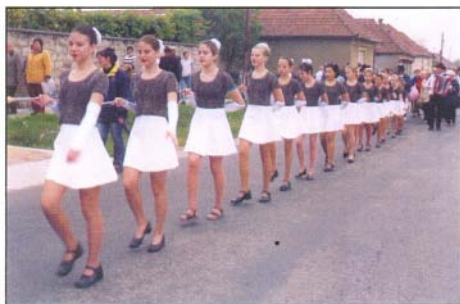
2003 - szüreti felvonulás

A születésnap ünnepség két részből állt. Az első részben a lányok indulóikra készített koreográfiákat mutattak be egy és két bottal.