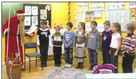
Minden jó gyerekhez eljött a Mikulás

Nagycsaládos kolléganőm humorizált a napokban. Jézus megkérdézheti tőlünk: Kértelek én benneteket arra, hogy a születésnapomat vásárlással ünnepeljétek? A szeretteinknek azt próbáljuk adni, ami a legdrágább számunkra, mint például az idő. A pillanat örök. Jó megtölteni tartalommal és ezt az örökséget megosztani velük. A szeretteink számára a jelenlétünket senki más nem adhatja meg helyettünk.