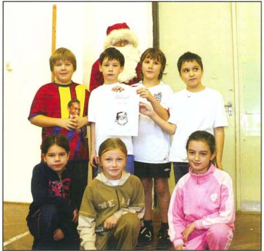
A Nyertes Hetes