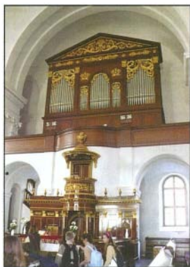
A Nagytemplom épületét megcsodálták iskolánk tanulói