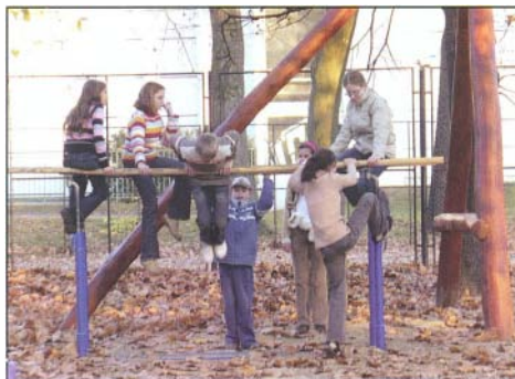
Játékra is jutott idő

A következő állomás a híres Debreceni Kollégium volt. A Nagykönyvtárban még kézzel írt könyveket is láttunk! 1849-ben itt, a Kollégiumban tartotta üléseit az országgyűlés. A Habsburg-ház trónfosztását azonban a Nagytemplomban mondták ki. Ide is ellátogattunk.