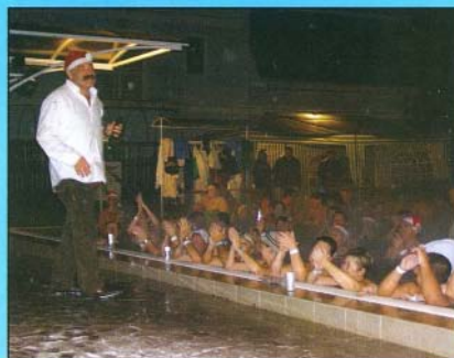
Lajsz András koktéllal örömmel fogyasztották az éjszakai fürdőzők