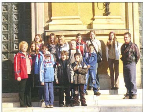
A Debrecenbe kirándulók csoportja

A nap hangulata bizakodóvá tesz, értelmesen és értékesen eltöltött nap áll mögöttünk.