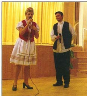
Mezőkövesdi Hang-Stúdió Egyesület meghatározó tagjai