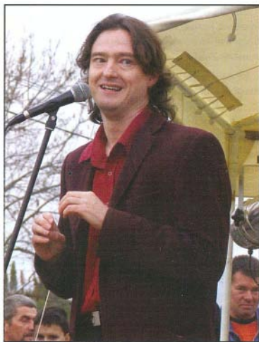
Beleznay Andre először járt Bogácson

A nagy mazzorettek mellett először mutatkoztak be pompos koreográfiajukkal mazzorett csoportunk legkisebb tagjai. Először lépett fel a bogácsi közönség előtt a Sky együttes, és először járt községünkben Beleznay Andre humorista, aki a Meglepo és mulatságos című műsor áliportereként országos ismertségre tett szert. A humorista sajátos stílusával feledhetetlen delutánt szerzett a fiatalabb és az idősebb korosztály tagjaiból kikerülő hallgatósnak.