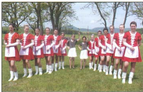
Csoportkép - a második formaruhában