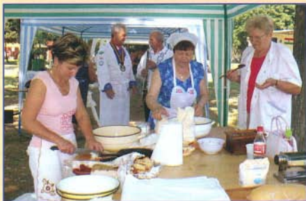
Készülnek a summás étek

A summás szakácsok nem könnyű életbe, immár harmadjára költhattam bele. 2008. július 12-én a III. Summás Étek Bemutatója rendezvény keretében néhányan a termalfürdő területén felállított tűzhelyeken ismét a summáskort idéző ételek elkészítésére vállalkoztunk. Az alapanyag legtöbb helyen teszta, krumpli és hagyma volt, mégis változatos és izletes ételek költsolására nyílt lehetősége az arra látogatóknak.