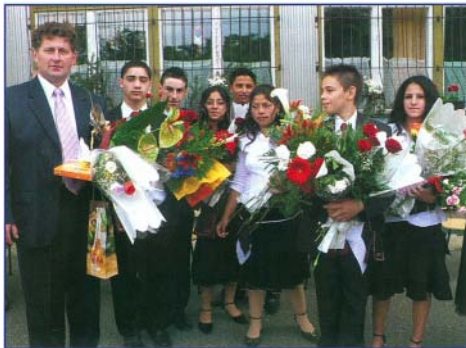
Búcsú az iskolától