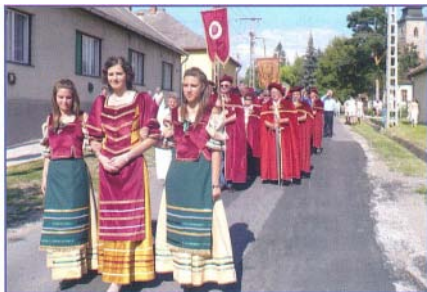
A borfesztivál felvonulása látványos volt