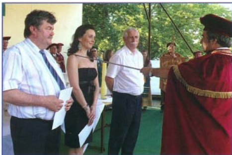
Csészy borlovaggá avatása