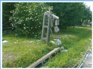
Az Alvég romokban hevert