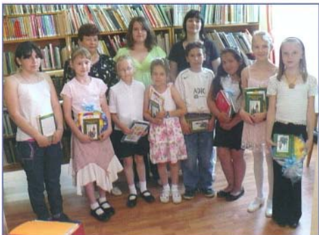
A versíró pályázat díjazottjai