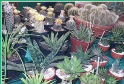
Különböző kaktuszok a Közösségi Házban

Ismét eltelt 1 év, túl vagyunk egy újabb kiállításon. A megszokott csapat és jó pár díszvendég.