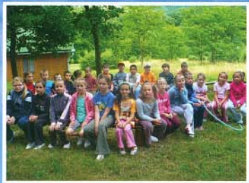
Az alsósok Parádfürdőn táboroztak