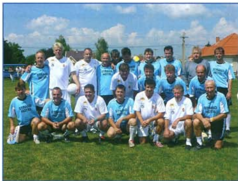
A jóteknysági meccs résztvevői: