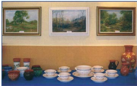
Gyönyörű és igényes alkotások

Az egyedülálló kiállítást nagyon sokan tekintették meg. Valamennyiünk nevében köszönjük az alkotóknak azt a szépséget, amit elének tártak. Gratulálunk gyönyörű, igényesen kidolgozott alkotásaikhoz, kívánjuk, hogy még hosszú ideig tegyék ezt saját maguk és a mi örömünkre.