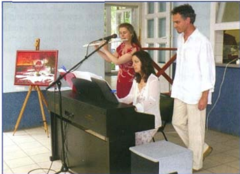
Festmények és zene csodálatos összehatása