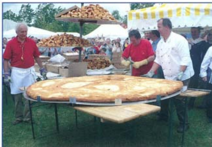
2,05 m átmérőjű óriásfánk – újabb Guinness rekord