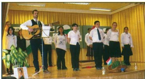
Az emlékműsor szereplői