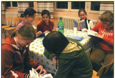
A tanulóink a „Megelevenedett oldalak” c. olvasóverseny után örömmel lapozgatták a jutalomkönyveket