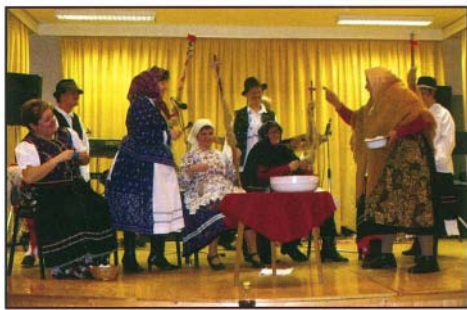
A régi fonák hangulatát idézte a pávakörösök vidám jelenete

Pávakörünk részéről immár hagyománnyá vált, hogy éventént Farsangi bált szervez.