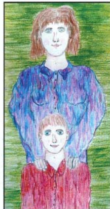
Rajzolta: Farmosi Erik

Nem kell beszéd, nem kell szó, Hogy szeretlek, jól látható. Szorítalak, megölellek, Így mutatom, hogy szeretlek.