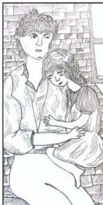
Rajzolta: Kocsis Viktória

Egy szál virágot, im, hozok, s mellé halkán ennyit mondok: „A sorstól csak azt kérem, maradj még sokáig nekem!”