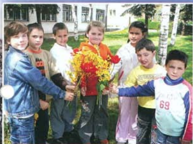
Szeretettel köszöntjük az édesanyákat!