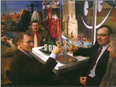
A rosznyói polgármester a bogácsiak egészségére üríti poharát az Utazás Kiállításon

Az idén a megszokottnál korábban, február 28. és március 2. között jelentkezett UTAZÁS KIÁLLÍTÁS kínálatában még több szakmai program, számos újdonság és úti cél, valamint színes kísérő esemény szerepelt a Hungexpo Budapesti Vásárközpontban. Öt földrész ötven ország, Magyarország tájai, régiói, utazási irodák és turisztikai hivatalok képviseltették magukat összesen 20 000 négyzetméteren. Az idei díszvendég Szlovénia volt, és először kapott kiemelt megjelenési lehetőséget Vietnám. Az idei Utazás kiállítás hangulysága témája - összhangban a Magyar Turizmus Zrt. Vizek Éve címen meghirdetett kampányával - a hazai fürdők és természetes vizek volt.