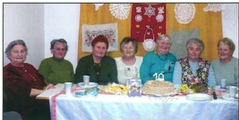
A Fűrge Újjak Klub tagjai