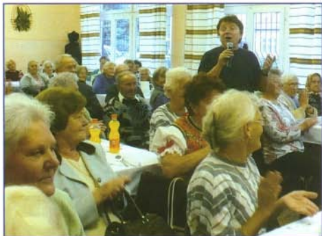
Aradszky László slágerei feleltették a hétköznapok gondjait

Az ismert sláger szerzői talán ösztönösen, de az is lehet, hogy tudatosan fogalmazták meg 40 évvel ezelőtt a fenti gondolatokat.