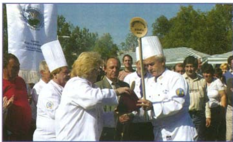
A gasztronómia népszerűsítéséért községünk elismerő díjat kapott

Mint a régi szüreti bálok, a 2007-es is színes felvonulással kezdődött. A fürdőtől indulva a kisbíró vezette a menetet, aki meghívta a lakosságot és az itt üdülőket a pincésori rendezvényre. A dobosok, a fúvósok és a Szent Márton Borrend tagjai követék a sort. A vállukra helyezett rúdon hatalmas szőlőfürtöt cipelő emberek Bogács címerében található kép megelevenítéséeként a múltat és a jelenet kapcsolták össze. Az utánuk haladó modern traktor húzta tutajon a múlt hagyományait őrző prés folyamatosan ontotta a frissen sutult mustot. A tutajon helyet kapott három szép borhercegnő, az előttük lévő szőlőkádában több zsák