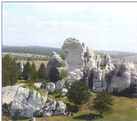
Ogrodzieniec nevezetessége a középkori vár

Ogrodzieniec, Lipovnik, Jochanisberg... Vajon mondanak-e valamit ezek a nevek annak, aki nem ismeri Bogács közelmúltját és jelenét?