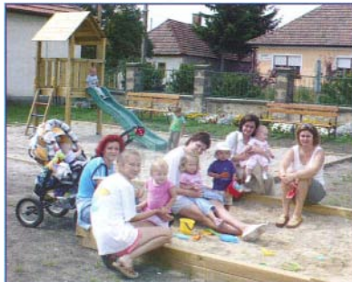
A játszótéren a gyerekek és az anyukák is jól érzik magukat

Átdadásra került a Községi Ház udvarán a modern, uniós szabványoknak megfelelő játszótér, amit a gyerekek és a szülei nagy örömmel vettek birtokba. Mindennapok itt a találkozók, a kicsik játszanak, az anyukák pedig megbeszélik a gyerekekkel kapcsolatos örömei-