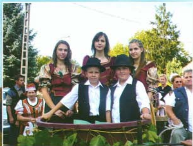
A szüreti felvonulás látványos volt