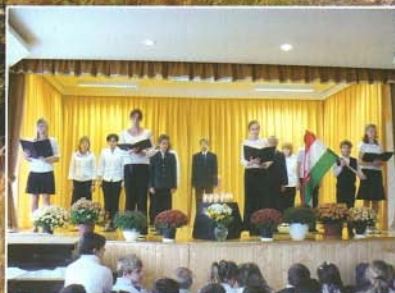
Az 1956-os forradalomra emlékeztünk