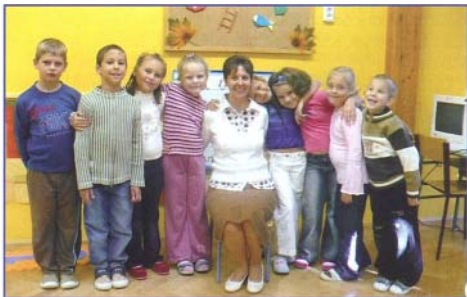
Az elsősoek egy csoportja