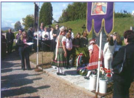
Pávákörünk tagjai elhelyezik a kegyelet koszorúját Hárskúton