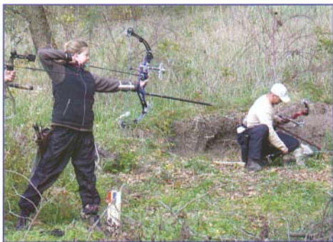
Az íjások mellett a pálya is sikeresen vizsgázott

Az idei év az íjások számára rengeteg kihi-vást tartogatott. Versenyekre jártunk, megmérettettünk, és sikerült a szezon végére az első önálló versenyünket is megrendezni. A Bogolyvári lőtér és a környező erdők adtak otthont az országos szintű eseménynek. A verseny jellegét nézve, úgynevezett 3D-s vadászíjász verseny volt, ami húsz célra két-két, élethű polifoam állatokra leadható lövést engedett.