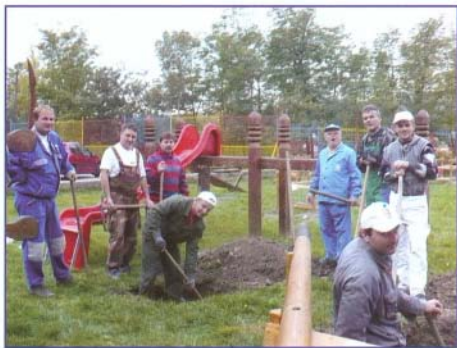
A szülök szivesen segítettek a játszótéri játékok felszerelésében