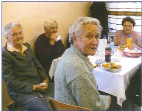
A finom estebéd mindenkinek ízlett