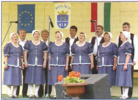
A Hárskúti Népdalkör bogácsi szereplése

pések sora erősíti. Kialakult az évek során személyes kapcsolat, barátság is a két község lakosai között.