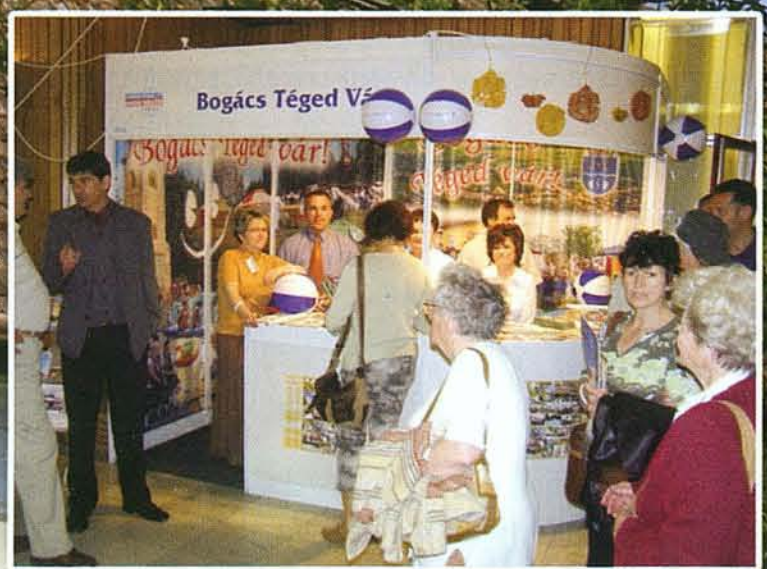
A bogácsi stand az érdeklődés közepontjában volt