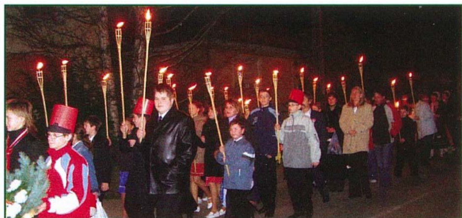
A márc. 15-ei fáklyás felvonuláson sokan vettek részt