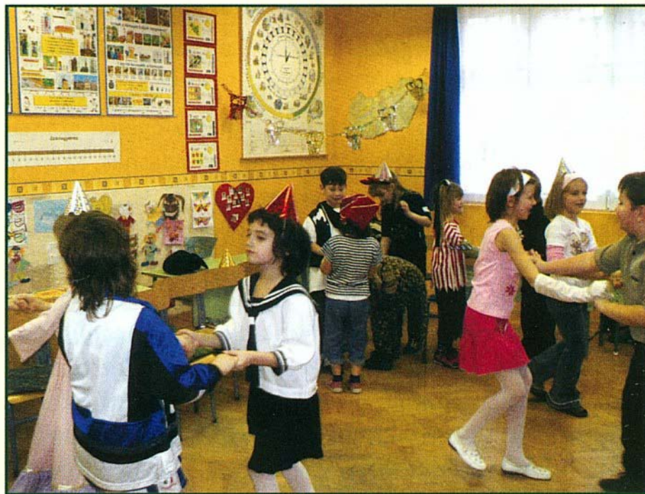
Így farsangoltak az 1-2. osztályosok