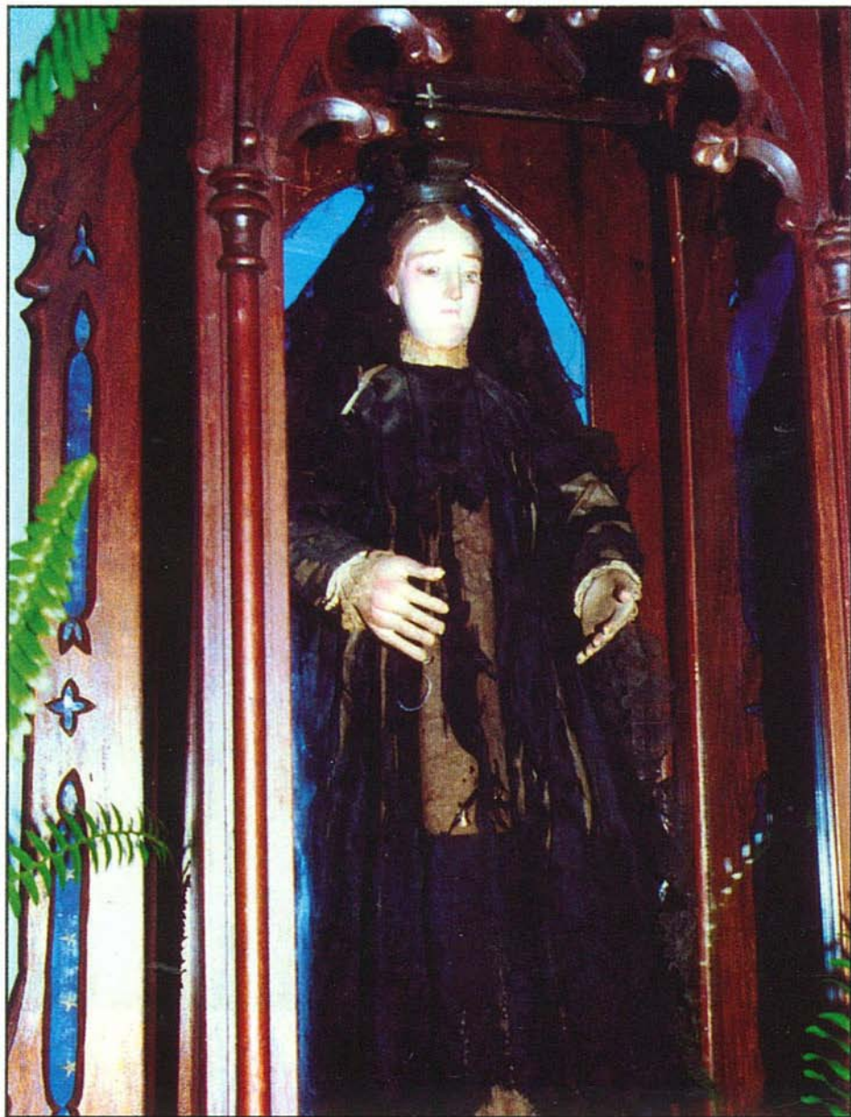
A Bogácsi Madonna