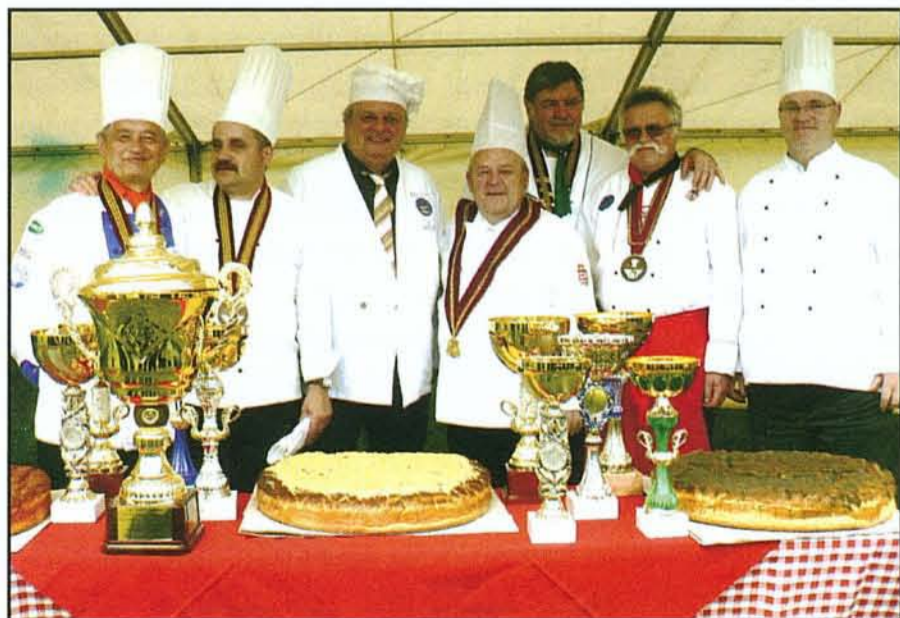
A főzőverseny ismert és elismert zsűrije

SÁRKÁNYEREGETÉS, ÍJÁSZBEMUTATÓ Ideje: 2007. július 28. Helyszín: Termálfürdő, Cserépi úti rendezvénypark