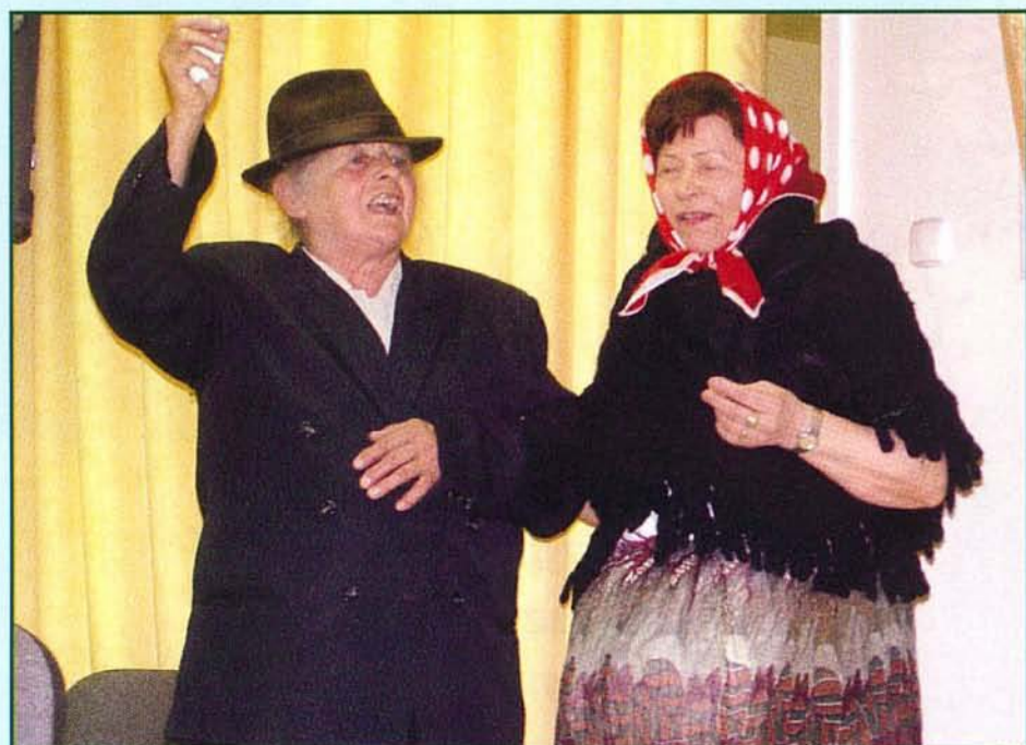
A humoros történeten jól szórakoztunk

Mindig izgatottan és lelkesen készülünk erre a zenés összejövetelre, ahol nemcsak mi, de a falu apraja-nagyja is nagyon jól érzi magát: délután 5 órától éjfélig rophatta mindenki a táncot, illetve szórakozhatott.