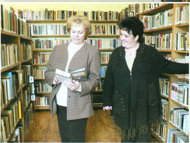
Kulturált környezet várja a könyvtárlátogatókat