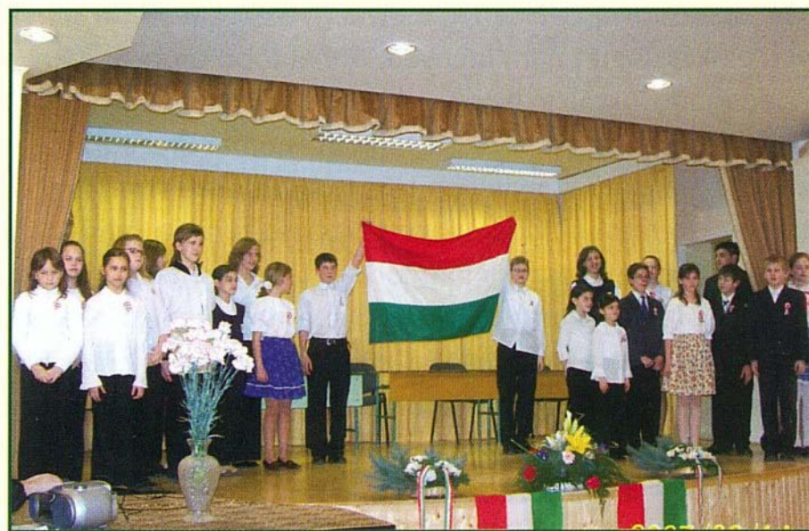
Iskolánk tanulói a március 15-ei ünnepi műsoron