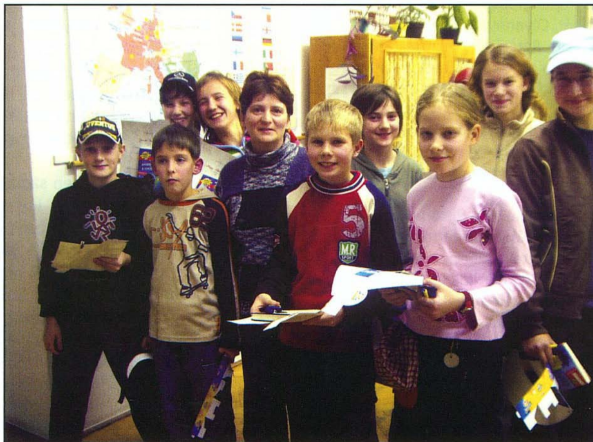
A játékos olvasóverseny legjobbjai és a verseny szervezője