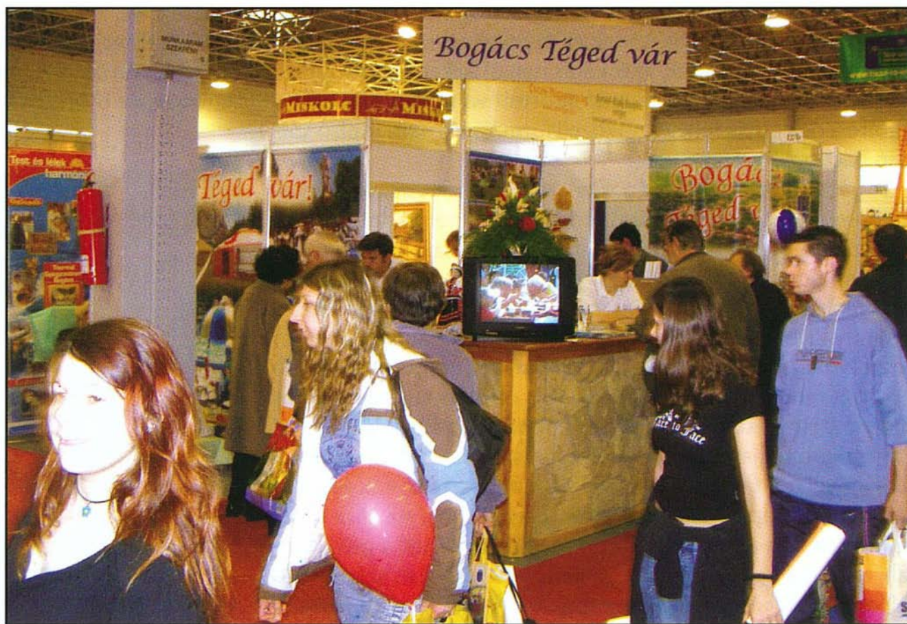
Bogács standját sokan keresték fel

2007-ben a rendezvény két díszvendége Mexikó és Füzér. A tél folyamán Magyarországról első alkalommal indult közvetlen repülőjárat a csodás mexikói tengerpartra. E lélegzetelállítóan szép tengerpart hangulatát hozták most el közénk.