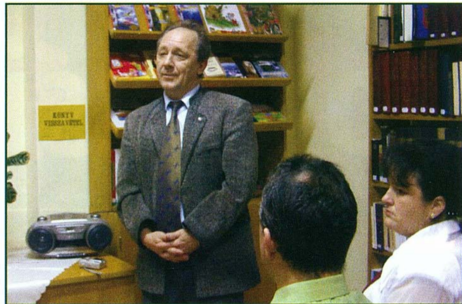
A könyvtár ünnepélyes átadása

A közel 100 könyv, úgyis írhatnám, „az egy szekrényi” könyvkészlet, ma 13 580 leltárba vett könyvállományra bővült, és az Alkotmány út 21. sz. alatti felújított szolgálati lakásban szerdánként 16-18 óra között a község lakossága és az itt üdülő vendégek rendelkezésére áll. Az itt található könyvek tükröként szolgálnak a különböző korokban élő emberek gondolatvilágának megismeréséhez. Könyvtárunkban lehetőség van a művelődésre, az önképzésre, a tanulásra, a kutatásra és a szórakoztató művek, lexikonok helyben használatára, illetve kölcsönzésére.