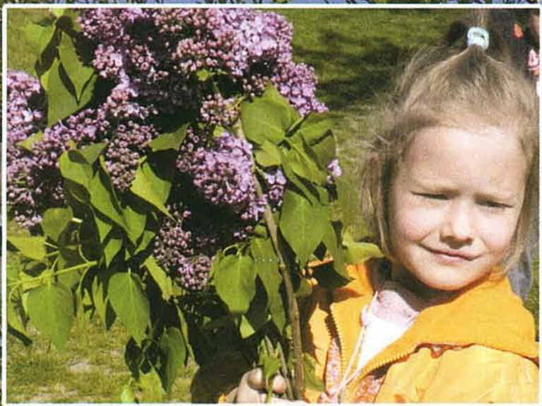
Szeretettel anyák napjára