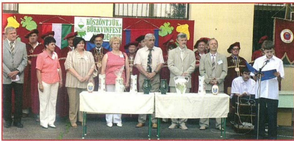
A borverseny megnyitója

Ebben az évben is – hűen a szokásokhoz – június utolsó hetében került megrendezésre Bogácson a XIV. Bükkvinfest Nemzetközi Borverseny és Borfesztivál. A versenyborok gyűjtése és besorolása 23-án zajlott.