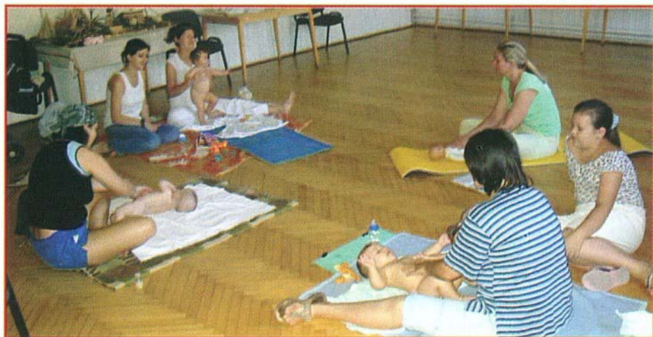
Az anya simogatásától jobban fejlődnek a kicsik