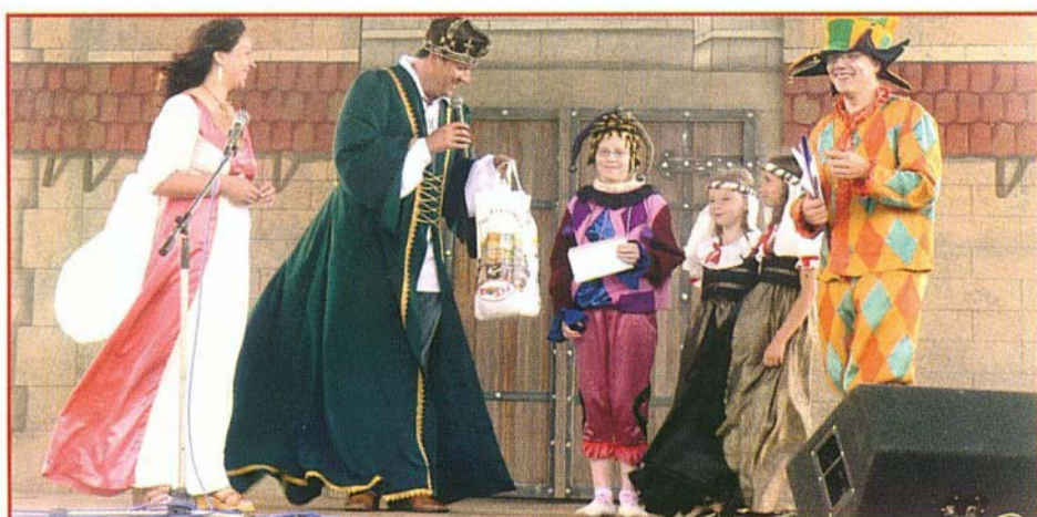
Színjátszósaink a mezőkövesdi Reneszánsz Hétvégén átveszik a megérdemelt jutalmat