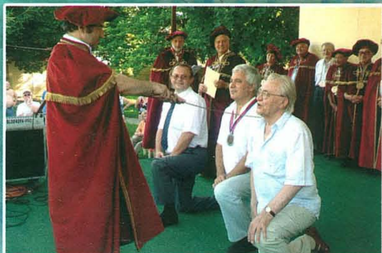
Színművészeink borlovaggá avatása