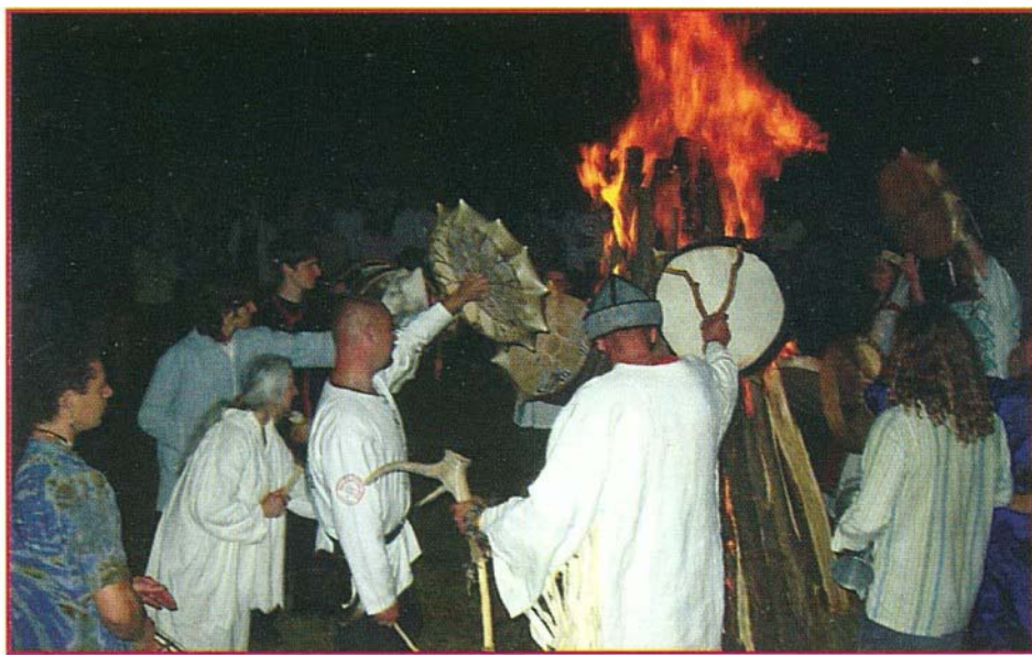
A sámándobok melegítése

A magyarságunk eredete homályba vész. Vannak elképzelések, hivatalos, nem hivatalos álláspontok, de a rendelkezésre álló leletek csak a kérdések kis részét tudják megválaszolni. Biztos, hogy keletről érkeztünk a Kárpát-medencébe. Őseink lovas nomád nép volt, használtunk jurtákat, félelmetesen kezeltük a nyilat és boszorkányos ügyességgel ültük meg lovainkat.