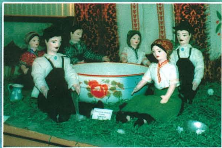
Summás babák a hatos tálnál