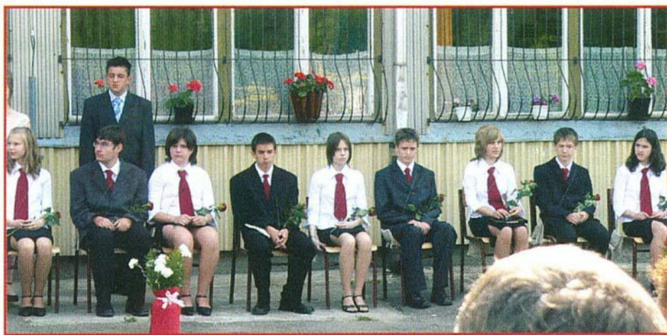
A ballagás pillanata