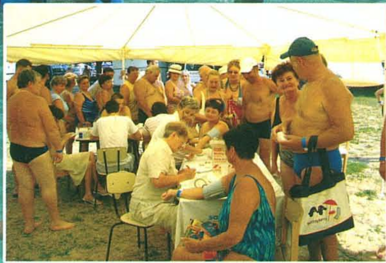
Az egészségnapokon sok véréadó volt