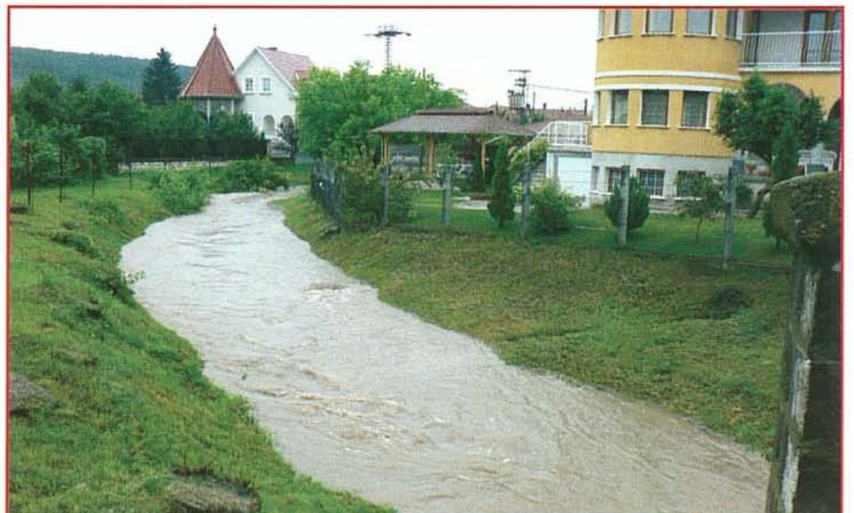
A Hór-patak vízhozama a szokszorosára nőtt.