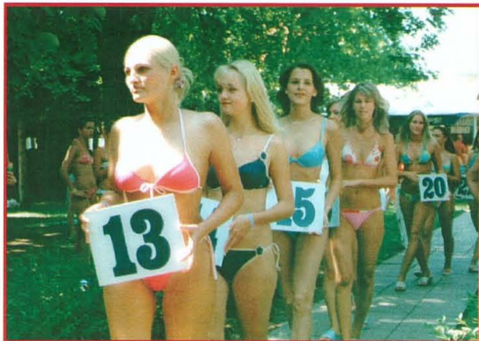
Az idén is sok szép lány jelentkezését várjuk