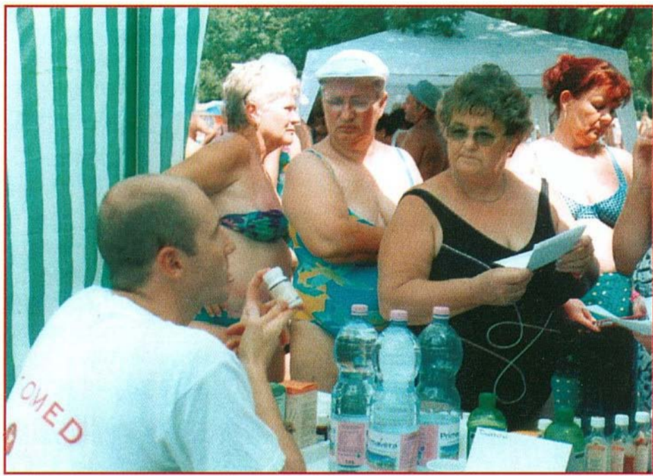
Bogácsi fiatalok lelkesen beszéltek a növényi kivonatok gyógyhatásairól

Ebben a festői környezetben, a bogácsi Thermálfürdőben került megrendezésre a már hagyományoknak örvendő második egészségnap. Számtalan színes egészségmegőrző program várta a kedves fürdővendégeket, akik az aktív megelőzés