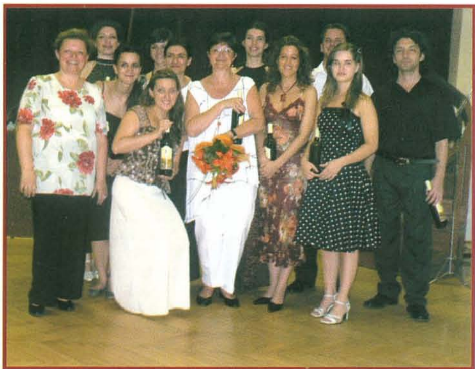
Az énekes tábor tagjai a sikeres koncert után