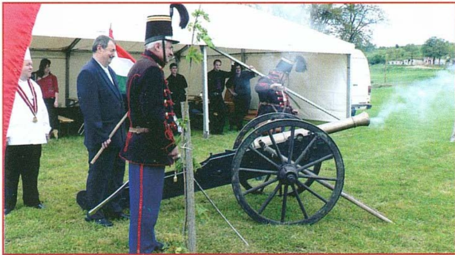
Ágyúsó nyitotta meg a rendezvényt

Immár negyedik alkalommal került megrendezésre községünkben a szakácstanulók és polgármesterek főzőversenye és bemutatója.