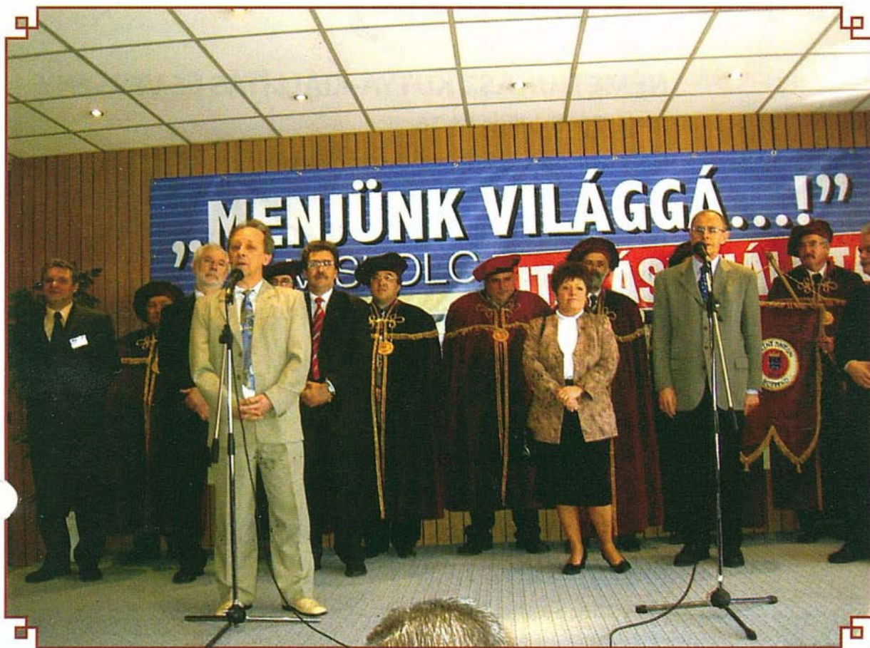
Megnyitó a Menjünk Világgá...! Utazási Kiállításon

A budapesti kiállítás után a legnagyobb vidéki utazási kiállításon vettünk részt. Az a megtiszteltetés érte községüket, hogy Miskolcon, a „Menjünk Világgá...!” Utazási Kiállítás rendezői felkérték Bogácsot, legyen a rendezvény díszvendége. Úgy gondolom, hogy ez a felkérés egyben elismerése is az eddigi reklám- és marketing tevékenységünknek. Mellettünk a külföldi díszvendég Horvátország volt. A minden eddiginél több látogató Bogács iránt várakozáson felül érdeklődött. Elvértve sem találkoztunk olyanokkal, akik ne ismerték volna településünket. Célzottan keresték a szállás lehetőségeket, érdeklődtek programjaink iránt. Az éves programajánlónk olyan elengedő volt, hogy csak mutatóban maradt belőle.