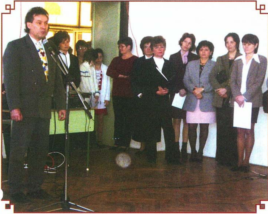
A Kiskörzeti Tanulmányi Verseny megnyitója

2006. március 24-én tizenkettedik alkalommal rendeztük meg a Kiskörzeti Tanulmányi Versenyt. Hat község: Cserépfalu, Cserépváralja, Tard, Noszvaj, Szomolya és Bogács alsó tagozatos tanulói mérték össze tudásukat.