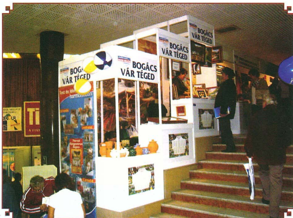
Bogács standja látványos volt