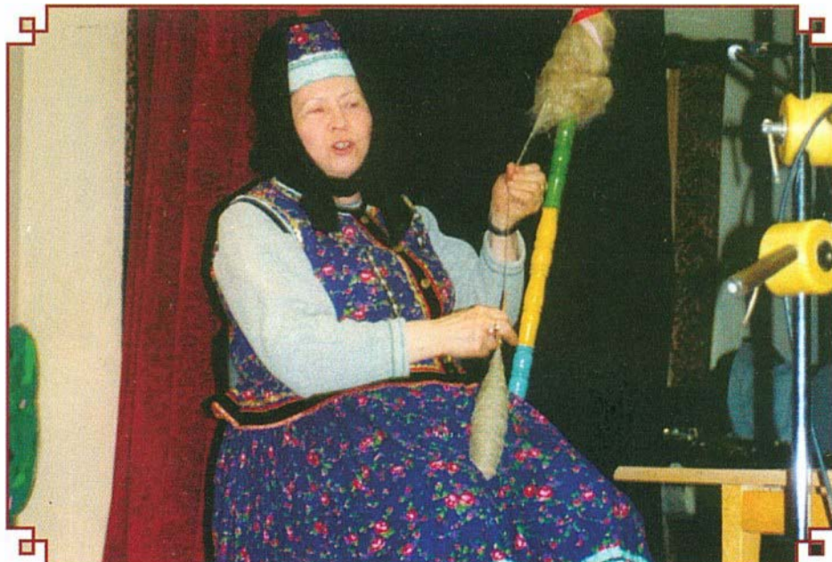
A pávakörös asszonyok mindig készek a vidámságra