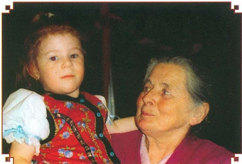
A bogácsi népviseletet Mancinéni örömmel készítette unokájának