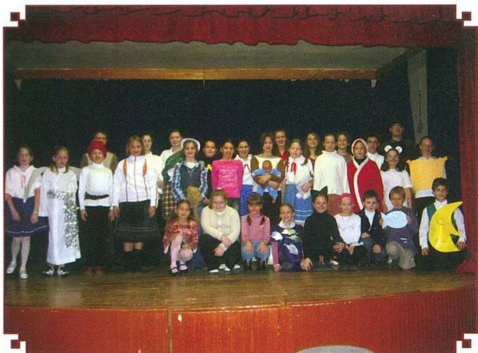
A jelmezes koncert szereplői