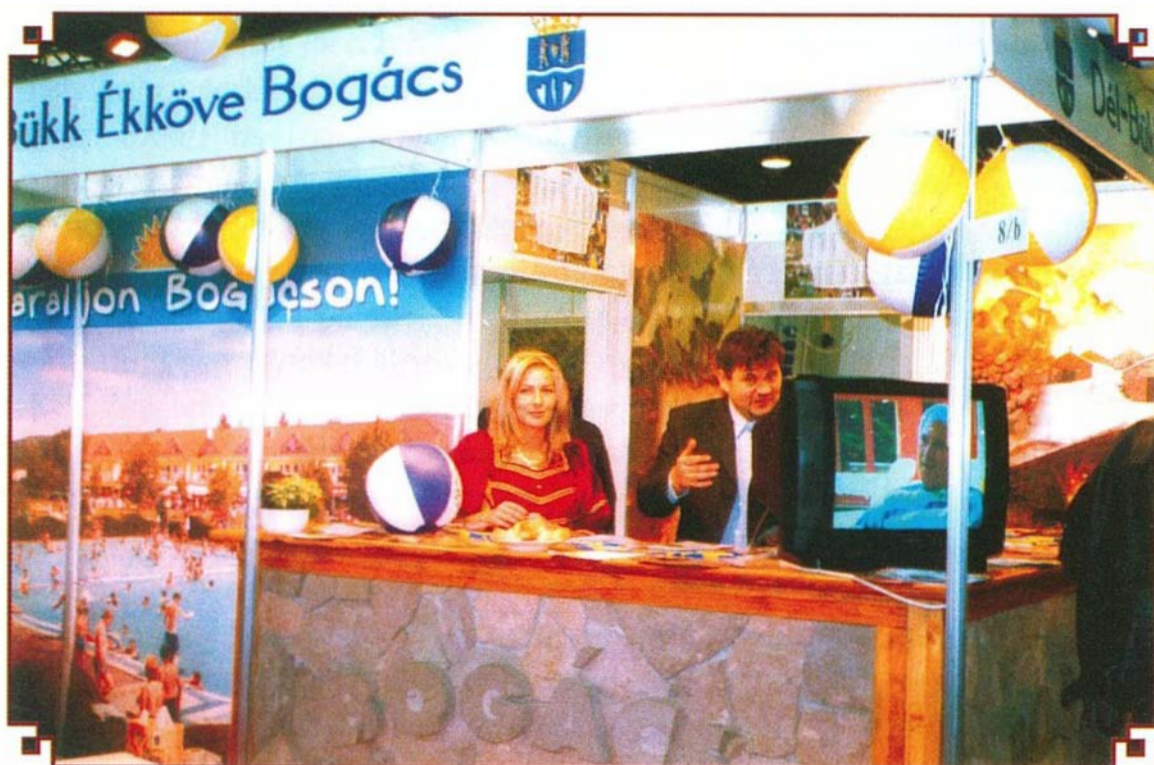
Lelkesen ajánlották fiataljaink Bogácsot

Az utazási kiállításokon való részvétele a községnek nem egy öncélú tevékenység, hanem a reklám és marketing koncepció részét képezi. Az országban az elmúlt években rohamos ütemben fejlődtek a gyógyfürdők. A régiek felújításra kerültek, és mellettük a korszerű követelményeknek megfelelően egyre több új épült. A vendégért folytatott verseny felerősödött. Már nem elég csak várni a turistát, nekünk kell megkeresni, idecsalogatni őket. Csak az a kérdés, hogy mivel. Gyógyvízzel, gyógyászzal? Ezek vannak máshol is. Jó levegővel, erdőkkel, horgásztóval? Ilyeneket szintén találnak az országban sok helyen. Jó borokkal, hangulatos pincékkel, vagy nagyszabású gasztronómiai, kulturális rendezvényekkel, kiállításokkal? Mondanom sem kell, hogy ezek a kínálatok is sok térségben megtalálhatók. De mit tud Bogács? Azt, amit az országban csak nagyon kevés hely tud nyújtani. A fent említett kínálatokat egy helyen egyszerre biztosítja az idelátogatóknak.