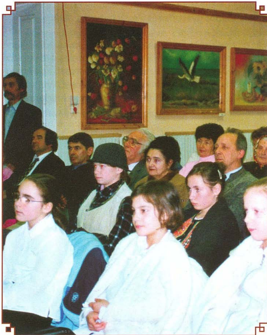
A versmondókat érdeklődve hallgatták