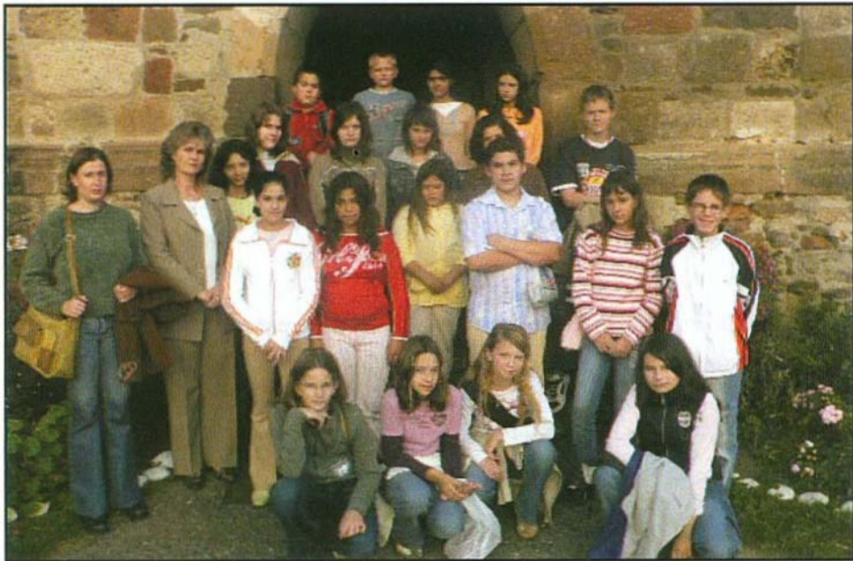
A diáktalálkozó résztvevői

A 2006-2007-es tanévtől bővült a Bükkalja Általános Iskola. A szomolyai iskola is csatlakozott a már meglévő Bogács-Tard társuláshoz. Sok a közös feladat, s ezek többsége az iskolavezetésre, a nevelőtestületre vár.