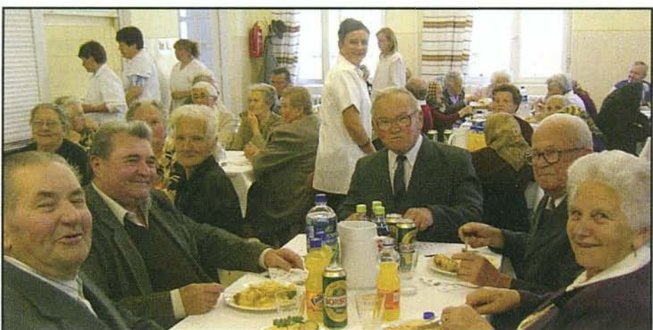
Az idős emberek jól érezték magukat az ünnepségen

Már régóta hagyományá vált községünkben, hogy az idős, 70 éven felüli állandó lakosú embereket köszöntik.