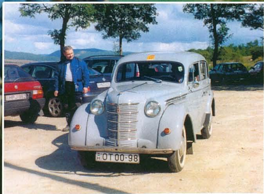
Veterán autók a Cserépi úti pincesoron