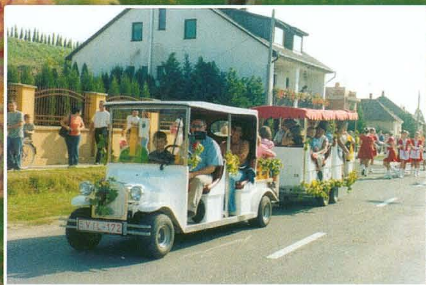
A kisvonat új színfoltja volt a szüreti felvonulásnak