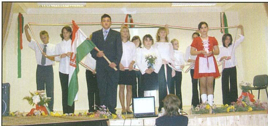
Ünnepi megemlékezés a felújított művelődési házban

2006. október 20. az emlékezés napja volt Bogácson. Dél-előtt az iskolások tekintették meg társaik előadásában az 1956. október 23-i forradalmi eseményeket idéző ünnepi előadást.