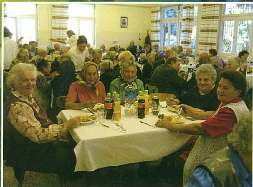
A 70 éven felülieket köszöntöttük