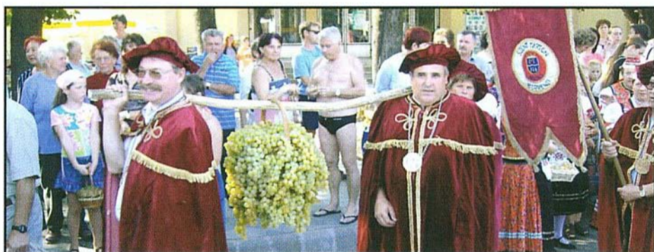
A Szt. Márton Borlovagrend tagjai vitték a hatalmas szőlőfürtöt

A hagyományos tárgyak, szokások jól megférnek a modern elemekkel. Az aszfaltutaj és az óriás szőlőfürt immár jelképévé váltak a Bogácsi Szüreti Napoknak. A tutajon sutulás, a gyönyörű borhercegnők, a szőlőkádban bogácsi fiú, aki tapossa a szőlőt. A Szt. Márton Borlovagrend egyik tagja húzta kistraktorral a tutajt, a hatalmas fürtöt szintén két borlovagrendi tag vitte. A rend nagymestere pedig kisbíróként invitálta és tájékoztatta a közönséget. Az idén új színfolt is került a felvonulásba, mégpedig a kisvonat, szőlővesszőkkel és fürtökkel díszítve szállította a kedves vendégeket.