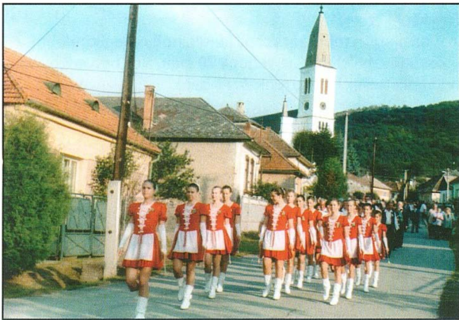
Mazsoretteseink vezették a hárskúti felvonulást

Az összefogás szép példáját láttuk szlovákiai vendégeskedésünk során szeptemberben.