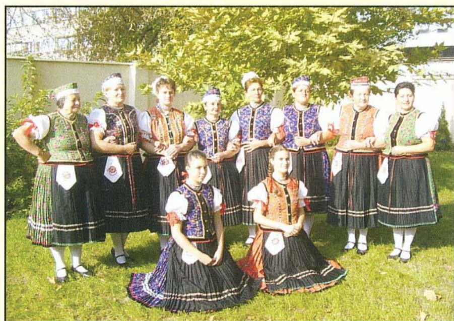
A pávakör tagjai a budapesti döntő után

Örömmel tudatjuk a község lakosságával, hogy a Bogácsi Pávakör a VI. Vass Lajos Népzenei Verseny Kárpát-medencei döntőjének Nagydíjasa lett.