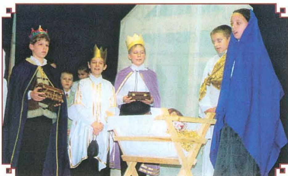
Pillanatkép a tavalyi karácsonyi ünnepségről

BOGÁCSI TÉL Bogács Község Önkormányzatának lapja