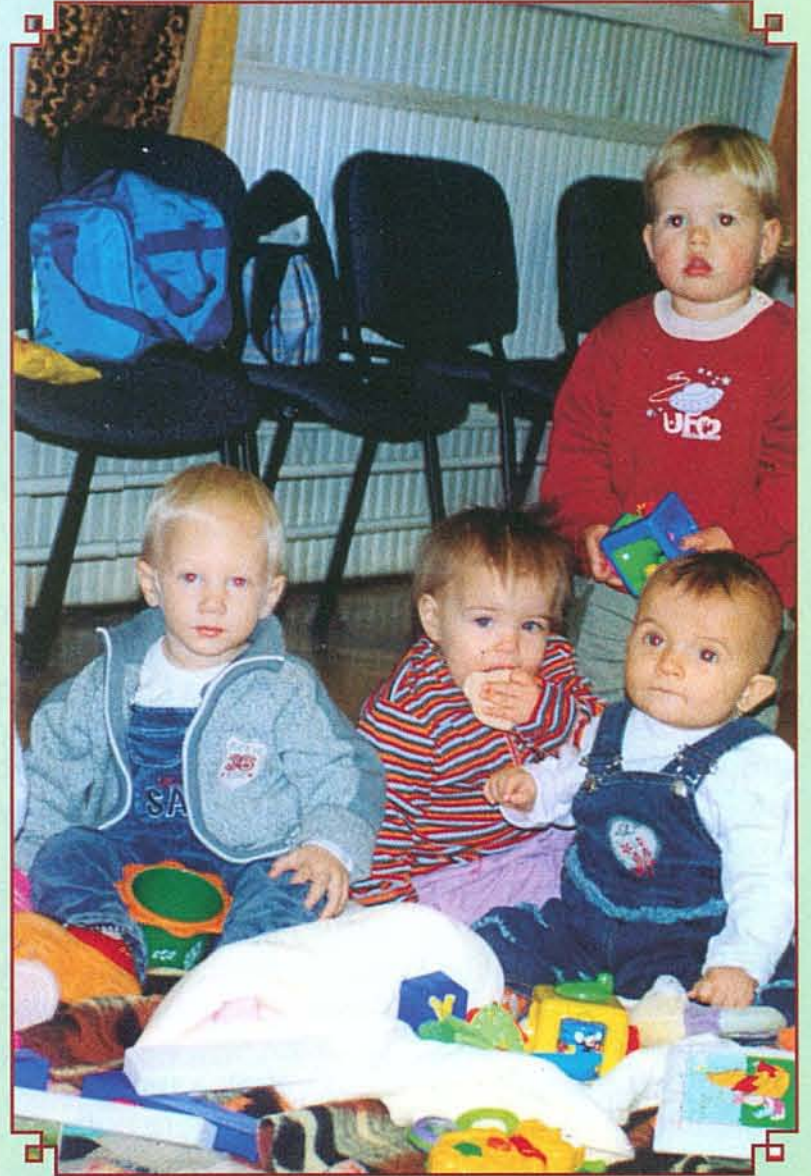
A babák jól érzik magukat a művelődési házban