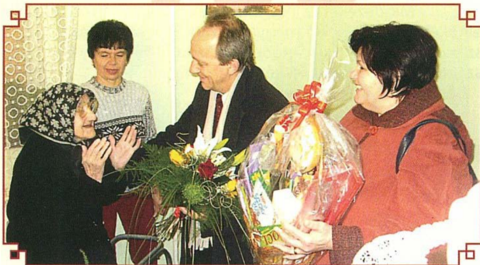
Rézi néni örömmel fogadta a köszöntést

Jeles évforduló. Nem minden ember életében adatik meg, hogy megérje.