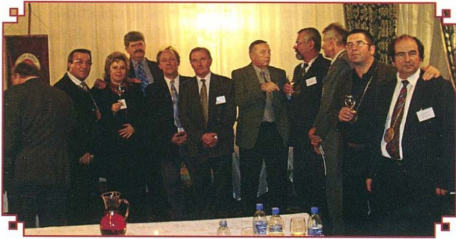
Delegáció a kijevi konzullal

A Szent Márton Borrend 2005. november 2-6. között Kijevben, az ukrán sajtó és tévé nyilvánossága előtt, valamint a borászati kereskedelmi szakma képviselői előtt a Kijev Nagyzálló kristálytermében 60 fő illusztris vendég számára, majd a kijevi élelmiszeripari vásár konferencia-központjában 50 fő számára nagy sikerrel mutatta be a Felső-Magyarországi Borrégió (Mátraalji-, Egri-, Bükki-, Tokaj-hegyaljai Borvidék, köztük a Disznókő Rt.) legkiválóbb borait.