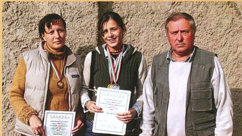
A lövészverseny helyezettei és a klub elnöke

Október 16-án, vasárnap rendezte meg a B.A.Z. megyei Technikai és Tömegsportklubok Szövetsége a „Köz-társaság Kupa” megyei lövészversenyt a Miskolci Vasutas Sportlövő Egylet pályáján. A megye minden részéről érkeztek nagy múltú csapatok.