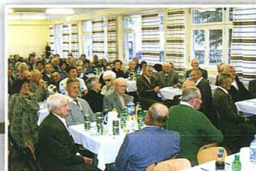
Október elején az időseket köszöntöttük