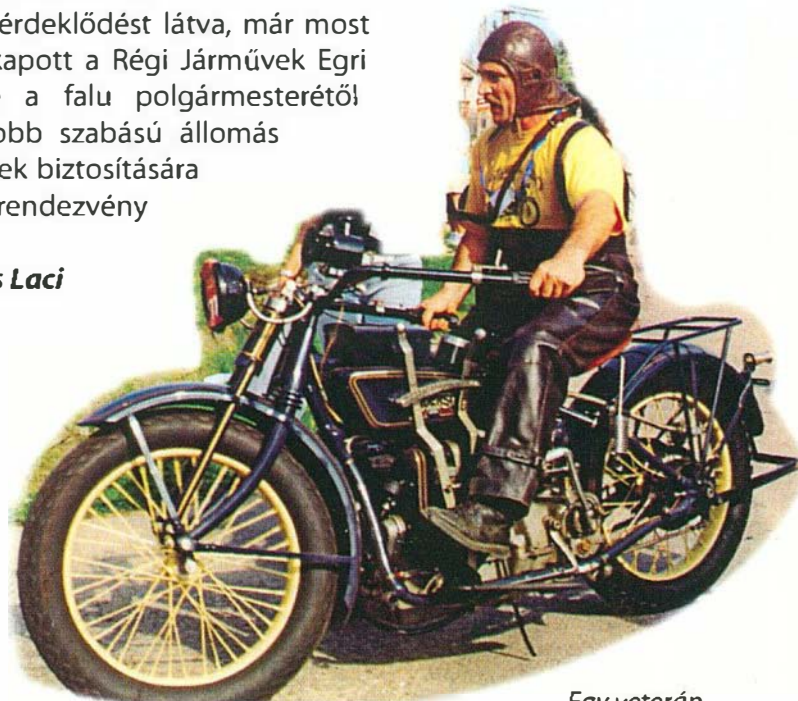
Egy veterán motor és tulajdonosa