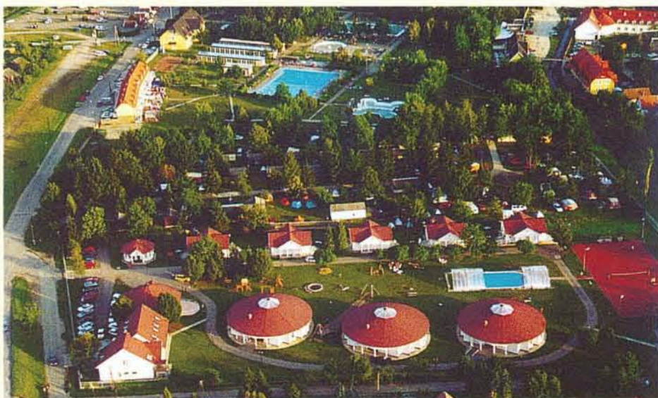
Bogácsé lett a Jurta-kert