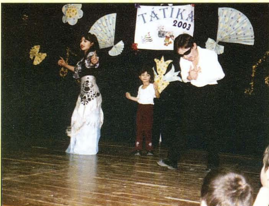
A Szitai testvérek produkciója