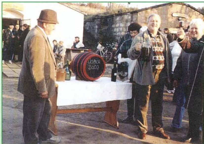
A Márton-napi Vigasságon vidáman kóstolták az új bort

A B O G Á C S I Ö N K O R M Á N Y Z A T L A P J A