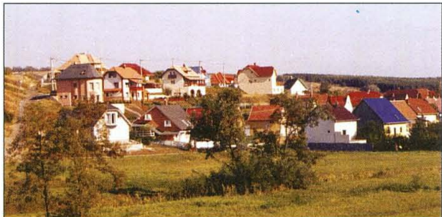
A bogácsi „Rózsadomb”

Az itt pihenő vendégek kényelmét szolgálva impozáns hotelek, villák, szállodák, üdülők, és vendégházak készülnek napjainkban is.