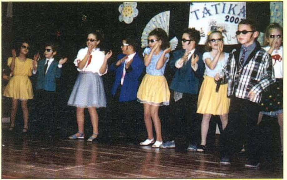
2.a osztály a TÁTIKÁN