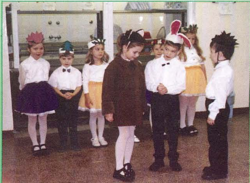
Az óvodások mesejátékkal köszöntötték a 70 év felettieket