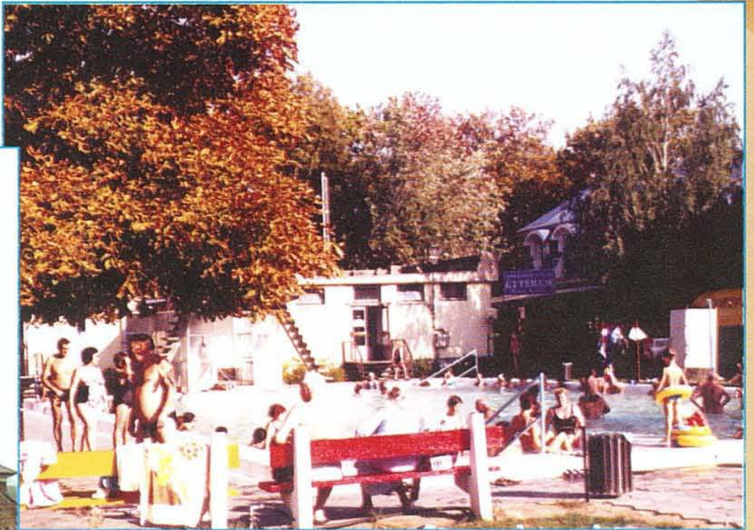
A szeptemberi nyárban sokan keresték fel fürdőnket