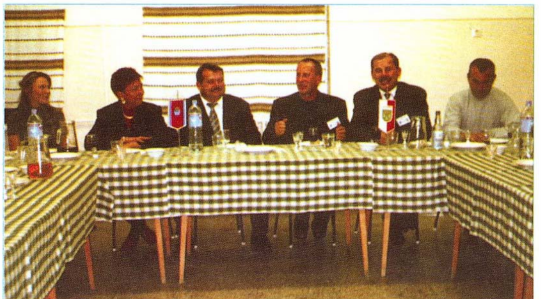
Baráti találkozó a lengyel delegációval