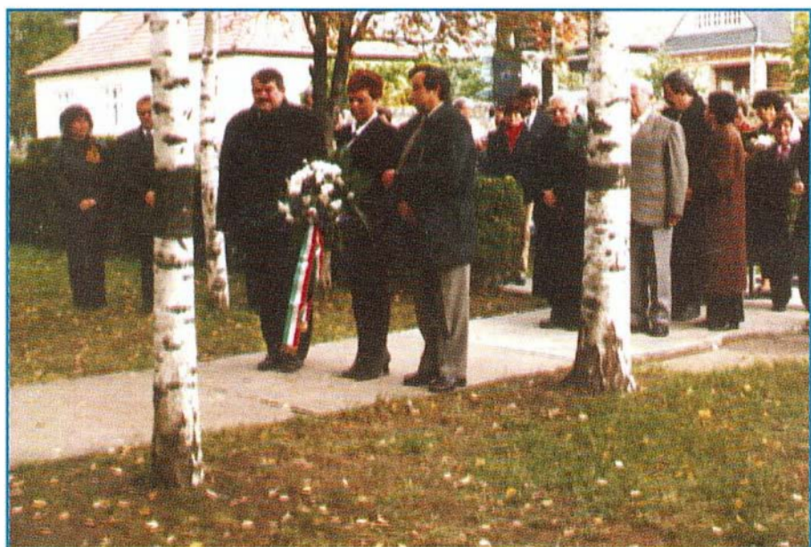
Az 1956-os forradalom ünnepe koszorúzással zárult