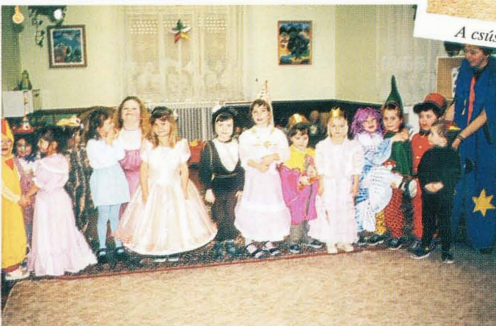
A legkisebbek is a farsanggal búcsúztatták a telet!

A B O G Á C S I Ö N K O R M Á N Y Z A T L A P J A