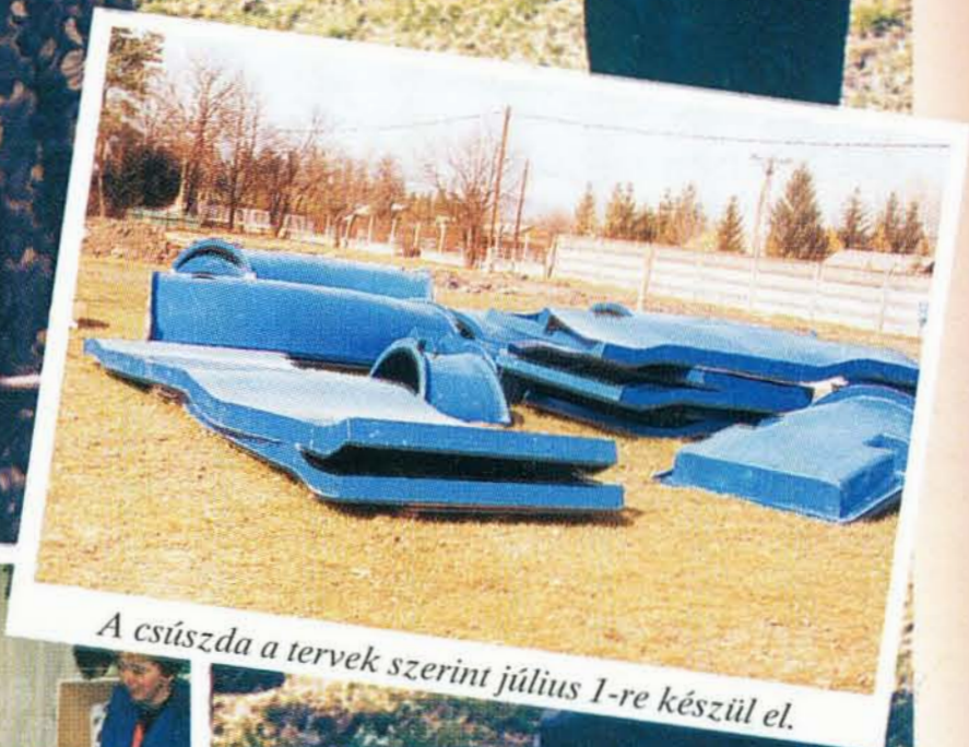
A csúszda a tervek szerint július 1-re készül el.