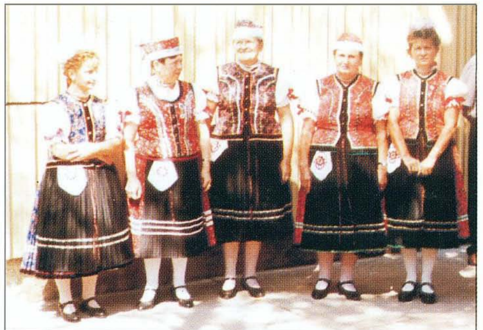
Pillanatkép 2002-ből - a Pávakör tagjai fellépésre várva