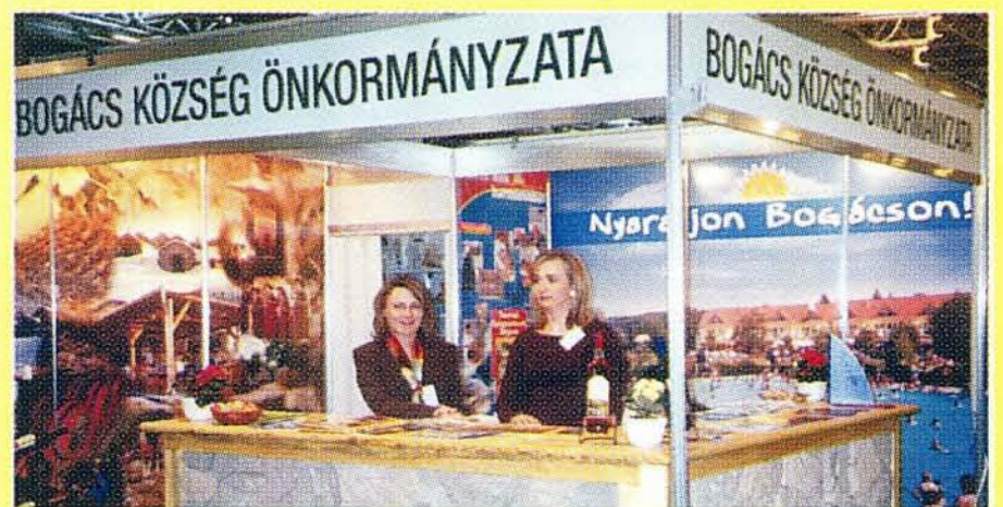
Bogács standja az Utazás kiállításon