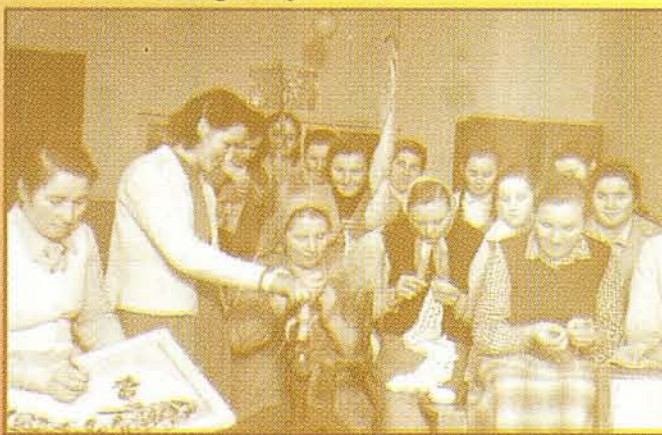
A kézimunka szakkör régen

A kézimunkán (kötés, horgolás, hímzés, makramé, gobelin) kívül sokat beszélgetünk, vitatkozunk régi eseményekről, visszaemlékezünk közös vagy egyéni élményekre. Javasunk,