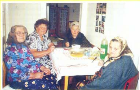
Az Idősek Napközi Otthonában szeretettel várják a társaságot kedvelő idős emberek

Ha majd az örök szeretet, elhívja őket közületek, Ti foglaltok el a helyüket, mert ti lesztek majd az öregek. S mind azt, amit nekik tetteket, azt adják nektek a gyerekek, Azért előre intelek titeket, szeressétek az öregeket.