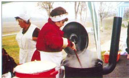
Tapasztalt háziasszonyok főzték a ludaskását