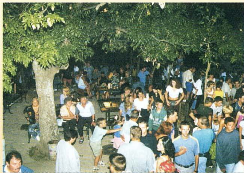
Borászbál a pincesoron