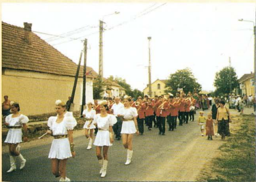
Látványos utcai felvonulás