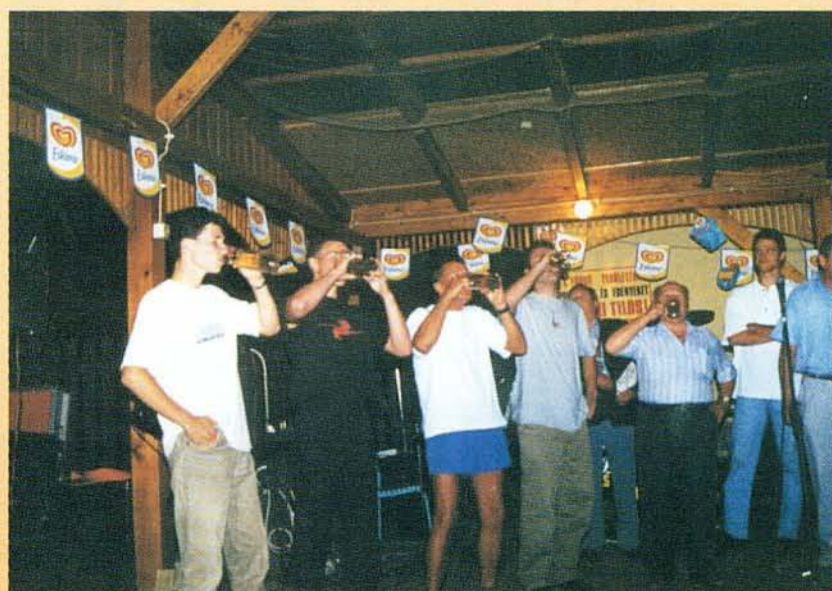
Az első „Öcsi fröccs” ivóverseny