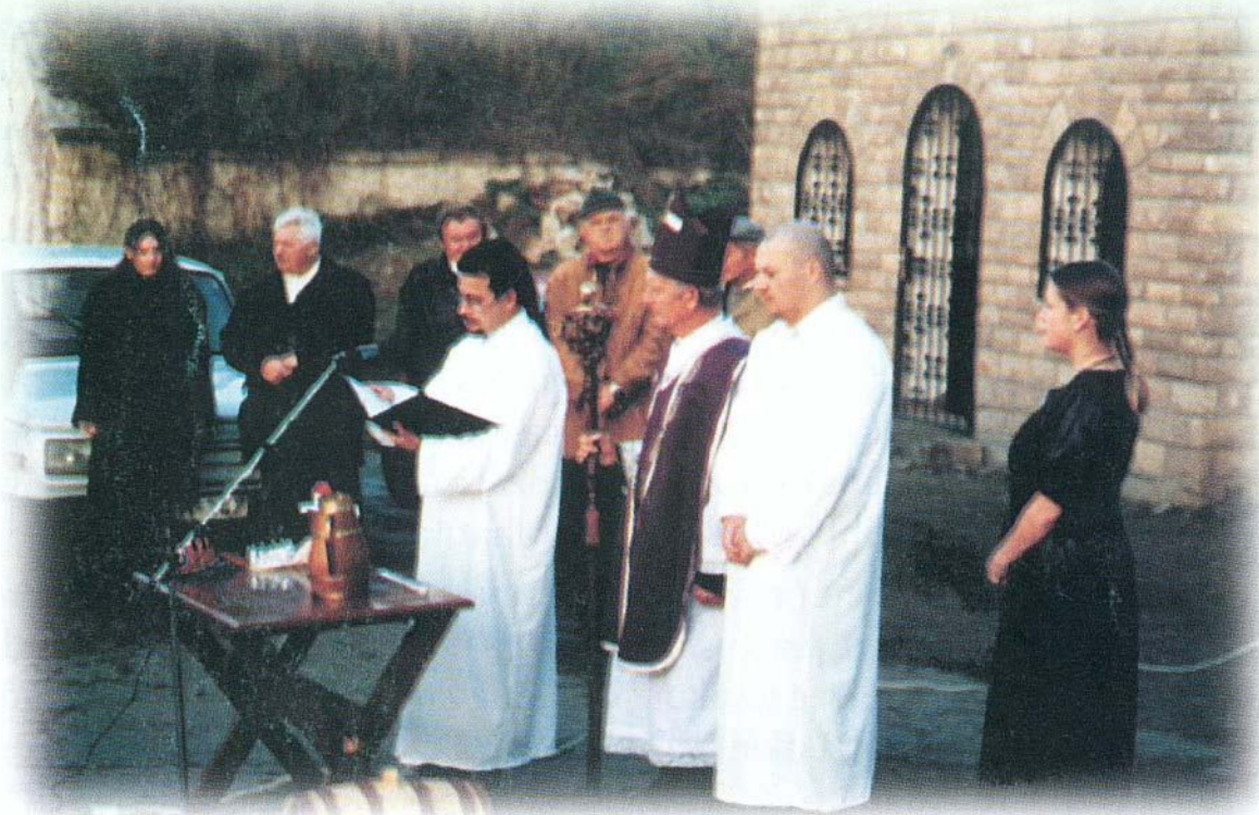
A Mustkeresztelőt a Szent Vince Borrend tagjai tartották

A Szt. Márton Napi Vigasságokkal hagyományteremtés vette kezdetét Bogácson 2002-ben szeretnénk ezt bővíteni és híresebbé tenni Márton napi lúdételekkel, ételkülönlegességekkel és más vendégcsalogató programokkal a turisztikai utószezonban.