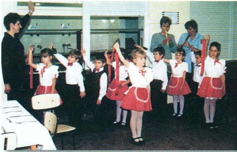
Óvodások is köszöntötték az időseket

A B O G Á C S I Ö N K O R M Á N Y Z A T L A P J A