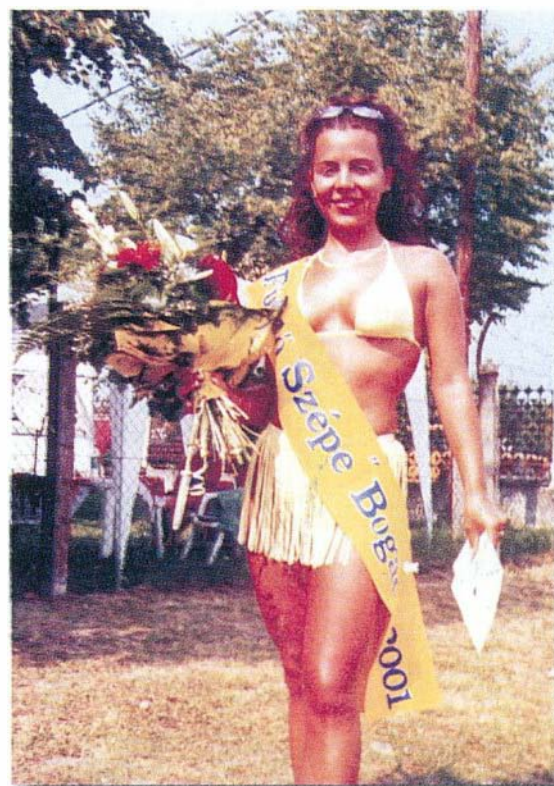
A Fürdő szépe 2001-ben