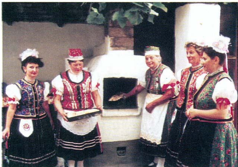
Finomat sütöttek Noszvajon

A B O G Á C S I Ö N K O R M Á N Y Z A T L A P J A