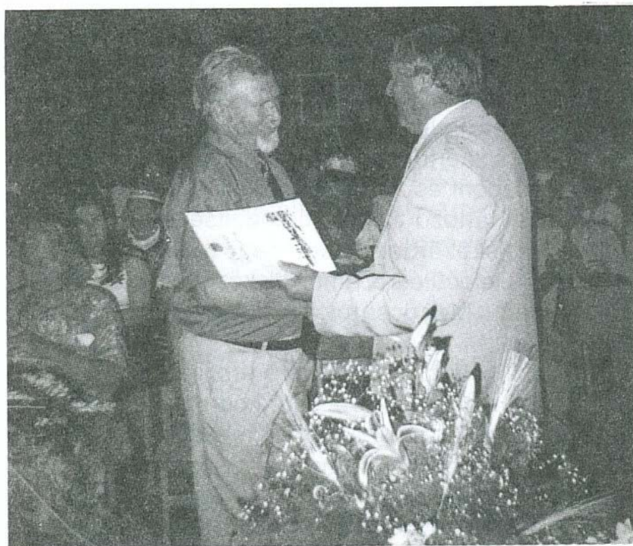
2001 évi Alkotói díjas

Köszönet valamennyiüknek, segítőtársaiknak és mindazoknak, akik a vizsgálati csoportban való részvétellel önzetlenül segítettek elő a Bogácsi Fürdő vizének gyógyvízzé minősítését.