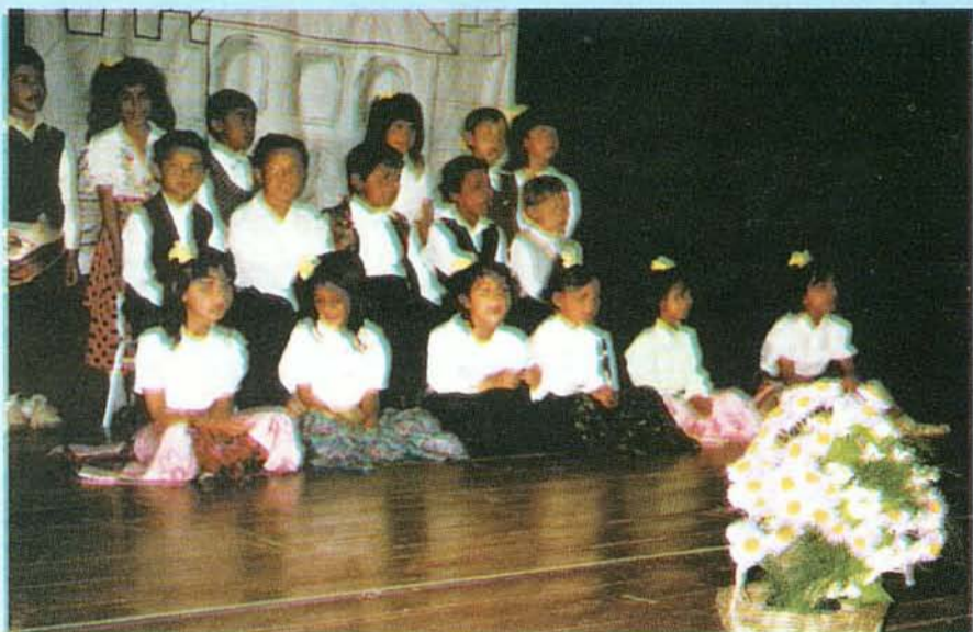
Óvodai ballagás folklórral...