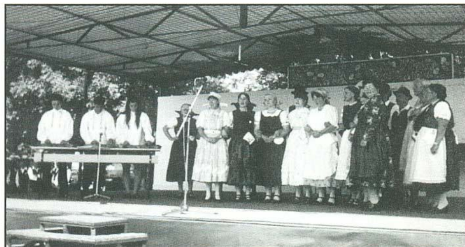
A Cserépfalui Népdalkör nagy sikert aratott