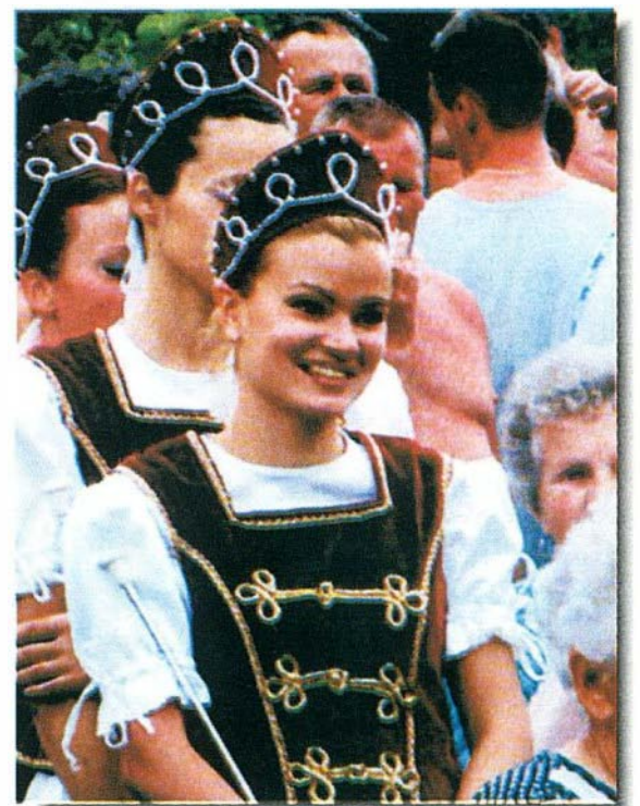
Ugye milyen csinos? Egri!