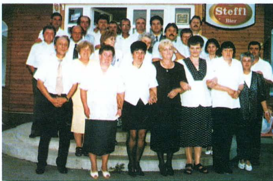
...mi pedig 30 éve