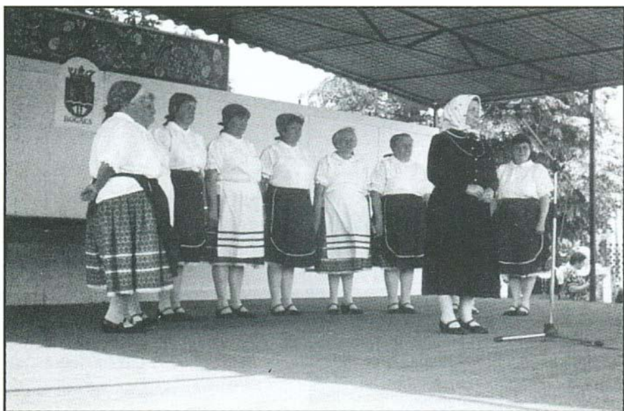
A CSEMADOK csoport vezetője szívükből szólt

Az efféle kérdéseket alapvetően el kell utasítanunk! – Egy ilyen szemszögből azt is lehetne mondani: „ mi értelme van egy Bach, vagy egy Mozart mű, vagy általában a nem kortárs művészetek újjáélesztésének, a családi, helyi, világtörténelmi vagy bármilyen ismeretek megőrzésének, továbbadásának? ”