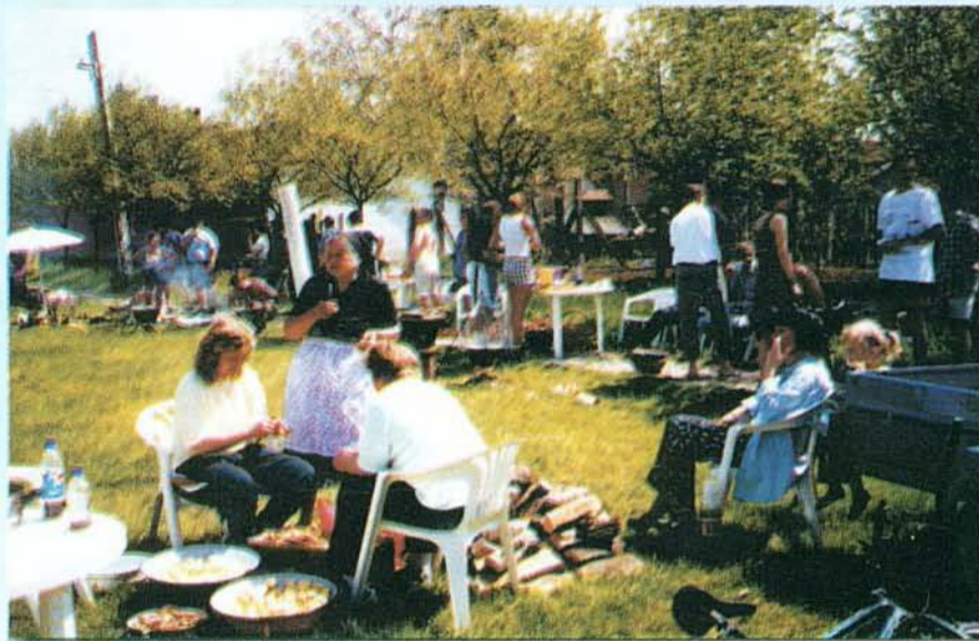
közös főzés a Majálison