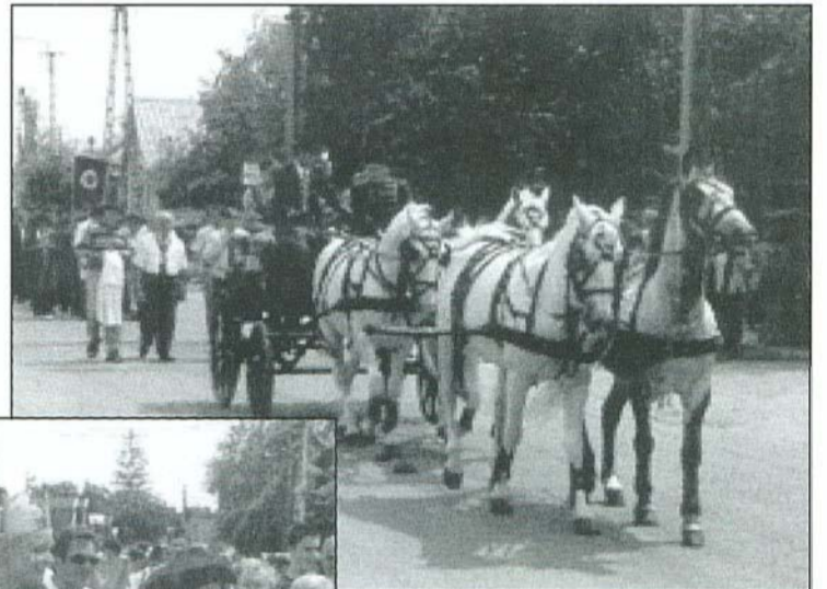
Díszes lovashintó vitte a borkirálynőt és udvarhölgyeit