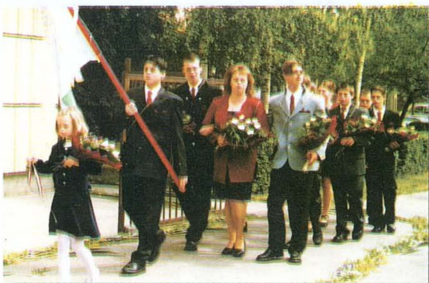
Ők az idén ballagtak...