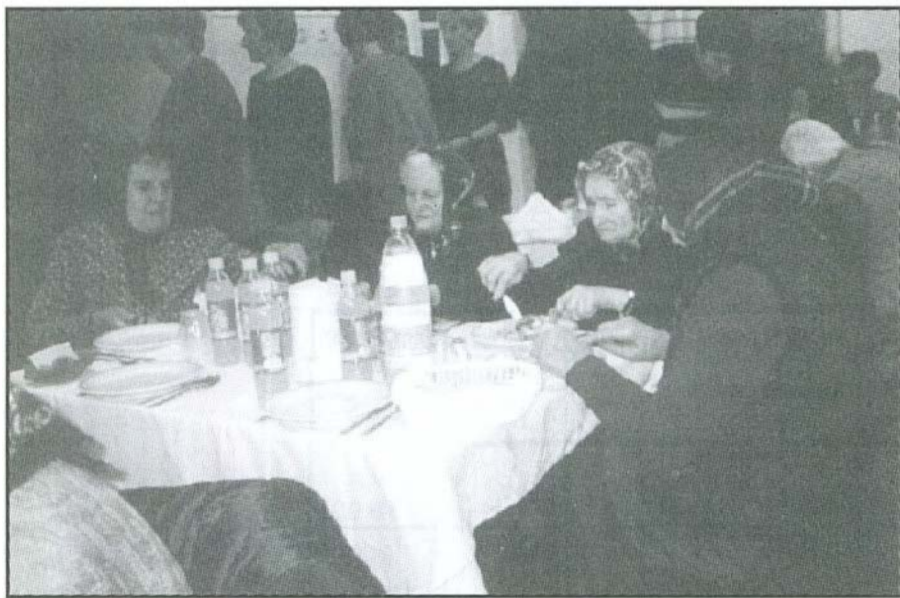
Előbb a finom vacsora...