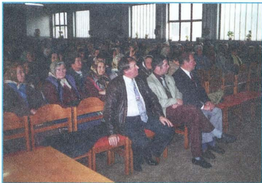
Magas volt a részvételi arány

A részvénytársaság 541 fővel alakult meg, neve: HÓR-AGRO Mezőgazda-