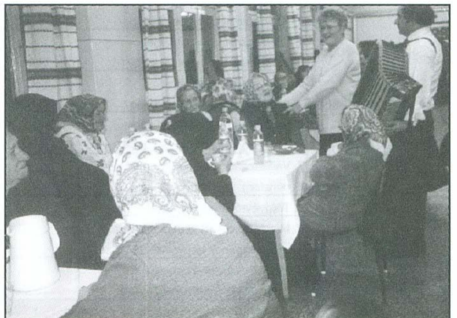
...majd éneklés következett

Ha elszakad az életem húrja, Követem majd én is őket a sírba. Síromból is felhangzik a nótám, Zörgetem majd a koporsóm falát.