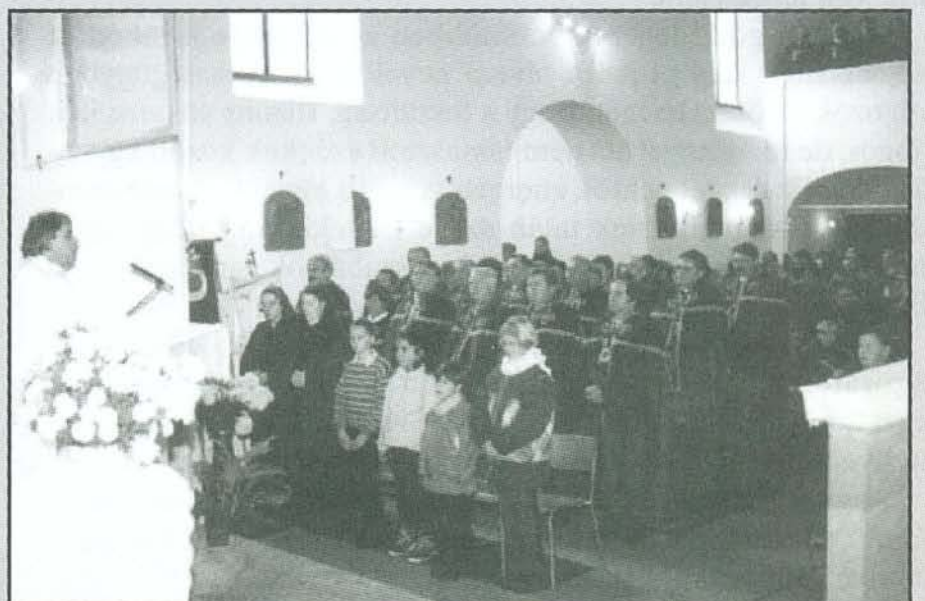
A búcsúi szentmisén a borlovagok is részt vettek