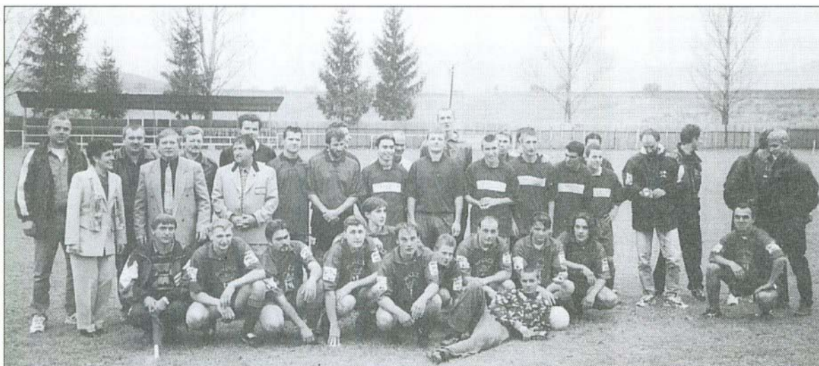
Vendégek és vendéglátók