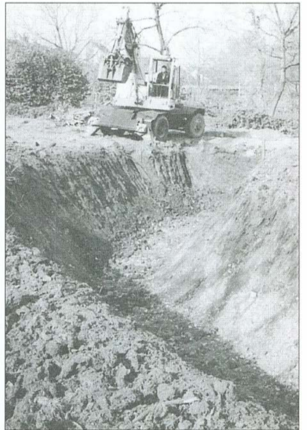
Átvágtuk a nagy kanyarulatot is a Hór patak Jegenyesor úti részén