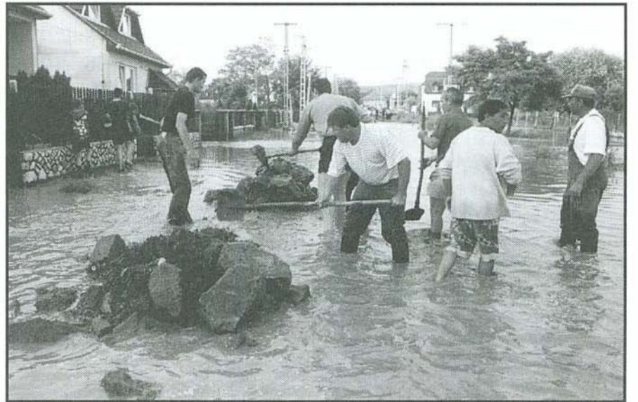
Voltak, akik azonnal szerszámot ragadtak, s mentették a menthetőt