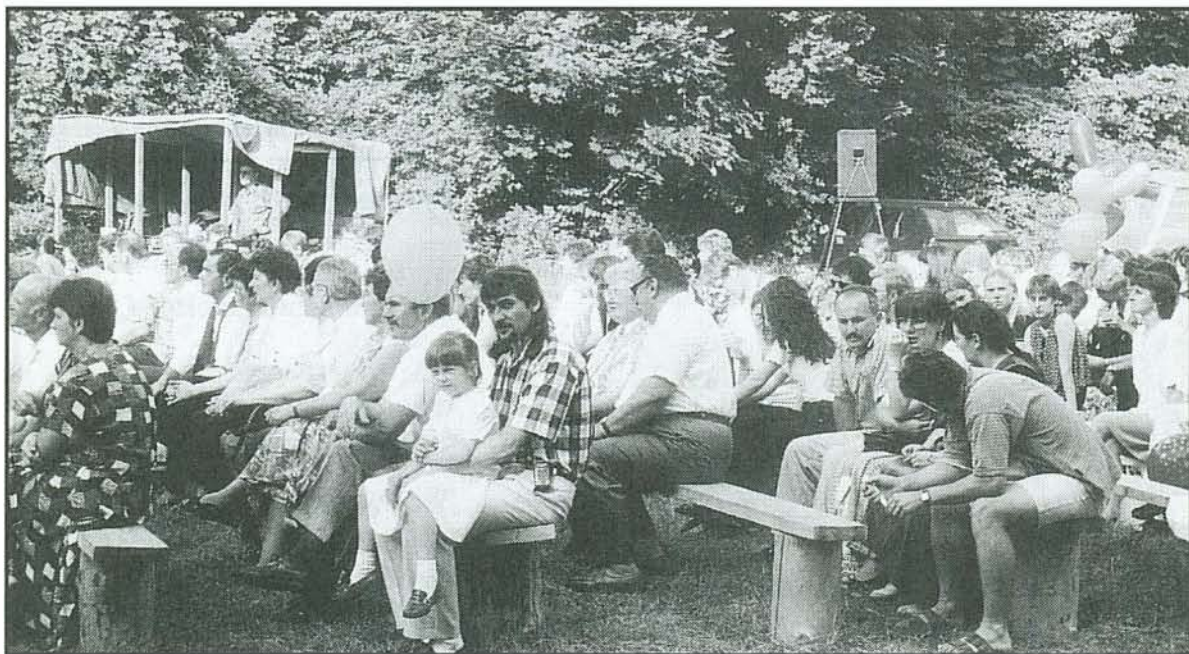
A bogácsiak előadását nagyszámú közönség tekintette meg