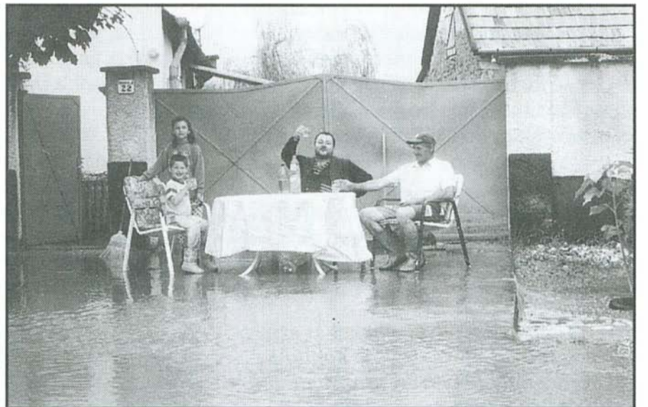
Akadtak, akik a veszély idején sem veszítették el „optimizmusukat”