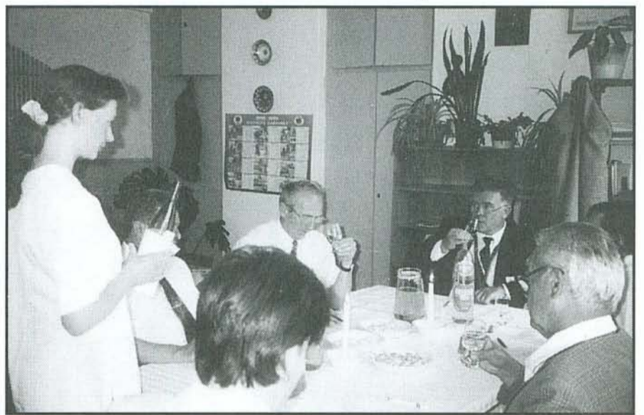
A borversenyen 12 zsüri, 488 bort bírált