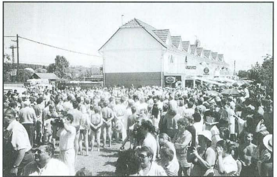
Az érdeklődés – mint felvételünk is mutatja – idén is óriási volt

De ez a kincs kiaknázva nemcsak Bogács gazdagodását, felemelkedését eredményezheti, hanem hozzájárulhat a térség felemelkedéséhez is. Ezt kellene megértenie itt e tájon sokaknak. Például Felsőzsolcán, ahol idén e napokban expót rendeznek, Tokaj-Hegyalján, ahol éppen most egy borrendezvényt tartanak. Sokkal kisebbet, mint ez, de minek kioltani egymás erejét.