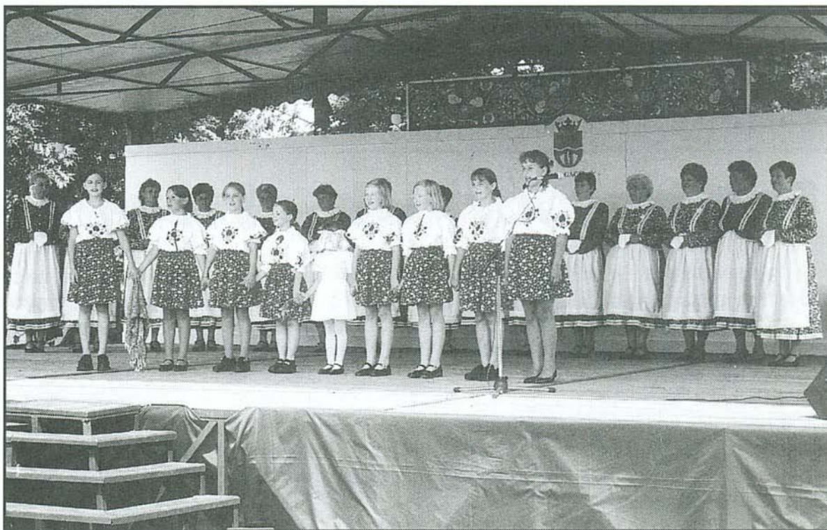
Színpadon a komorói lány- és asszonykórus

Egyeki Népdalkör, Gesztelyi Népdalkör, Megyasói Népdalkör, Tállai Kővi-