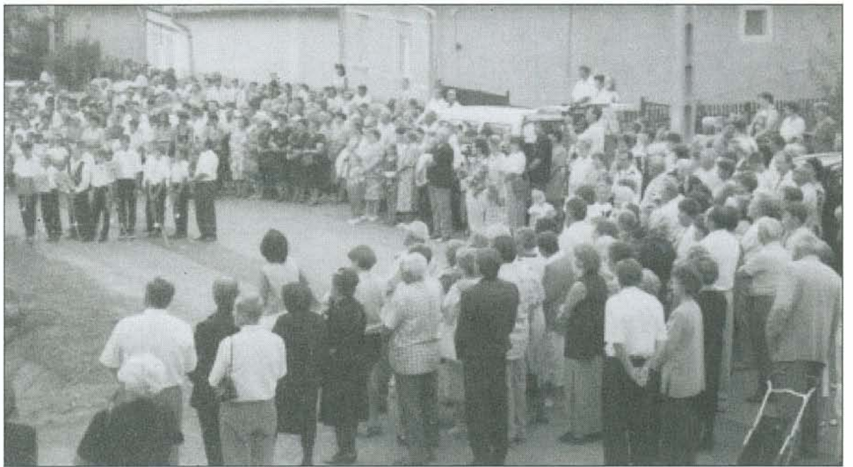
A falu apraja-nagyja ott volt az emlékművet felavató ünnepségen