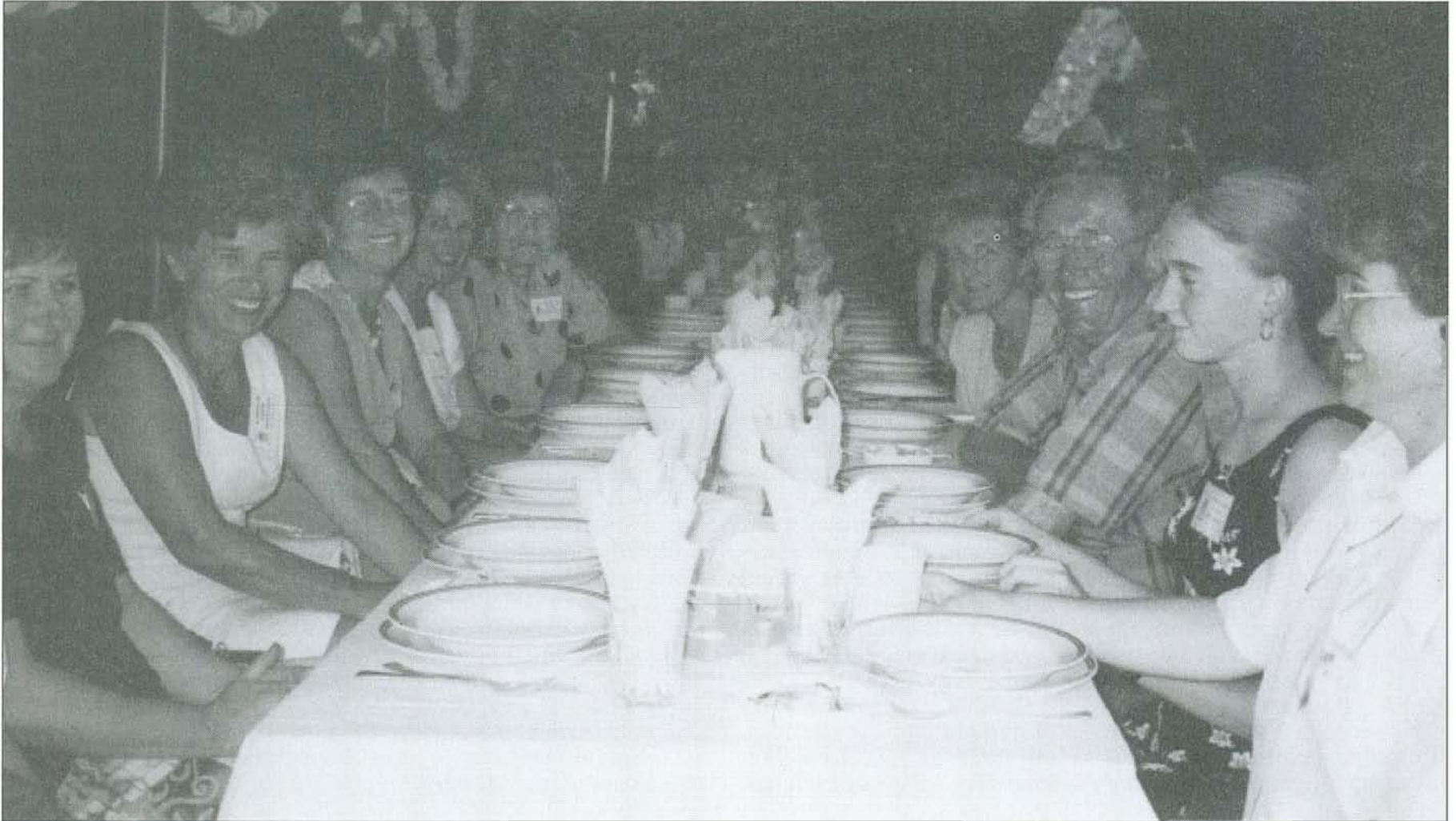
Fehér asztal mellett egykori és mai bogácsiak