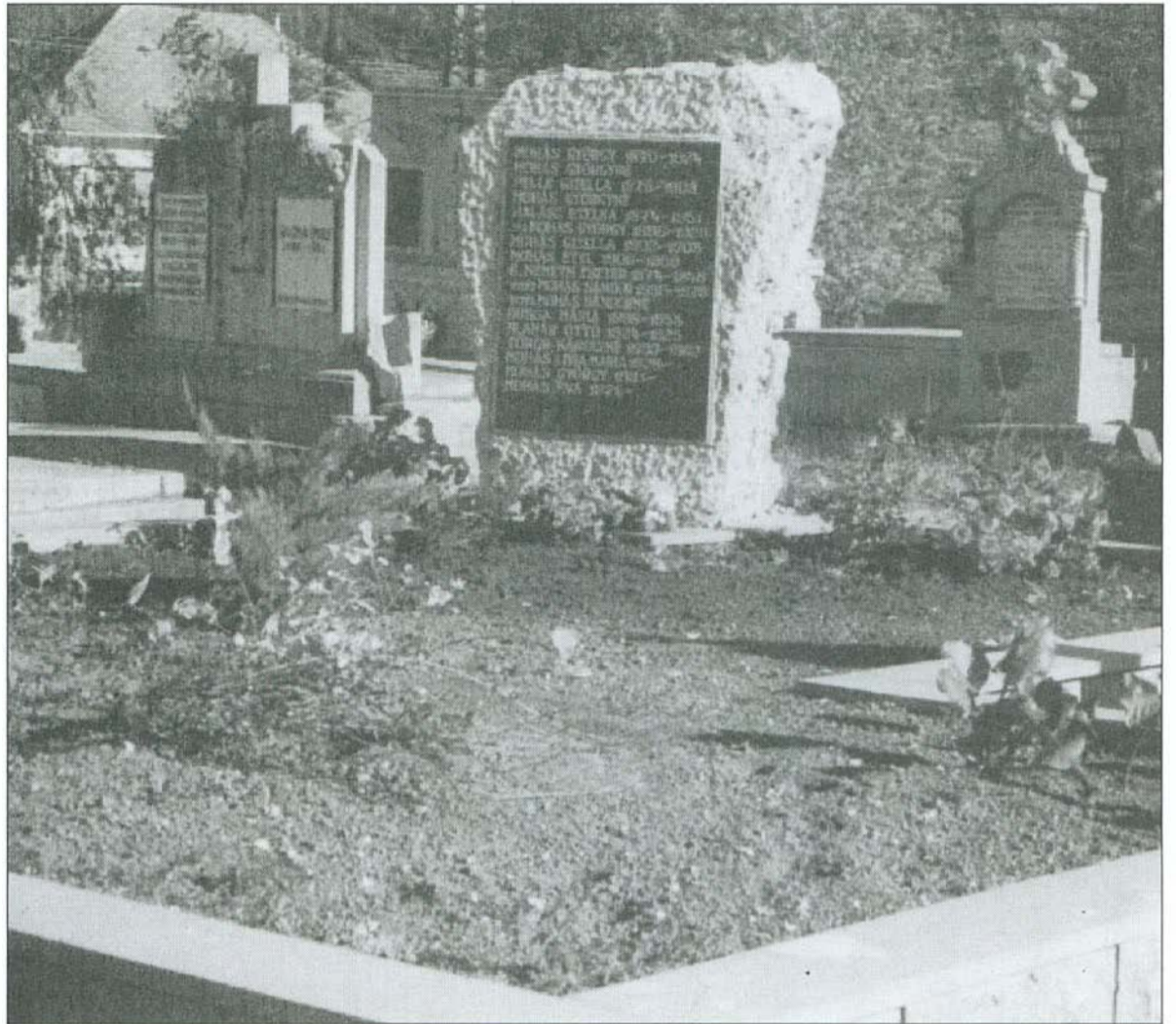
A megújult sírkert

A mai ember tudja, hogy itt elődeink méltó módon alkottak. Mi ezt még jobban, még szebben akarjuk folytatni az utódokért. Ha ez vezet bennünket – bár fájdalommal