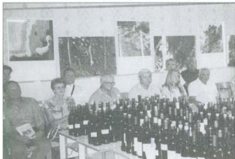
Hadrendben a bortesztivál „főszereplői”