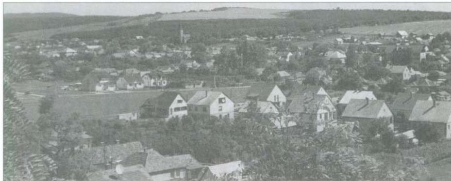
Bogácsi látkép a Satorból