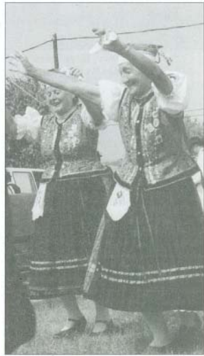
A Bogácsi Lakodalmas szereplői előadás közben