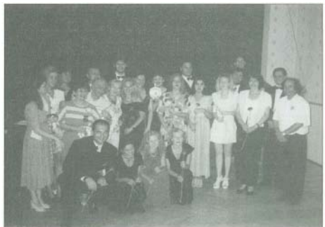
Fiatallénekes nyári találkozójának tanárai és hallgatói