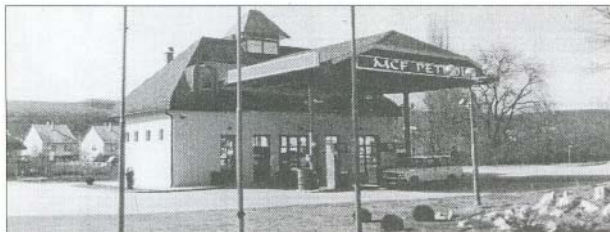
Estétikailag is gazdagítja a falut