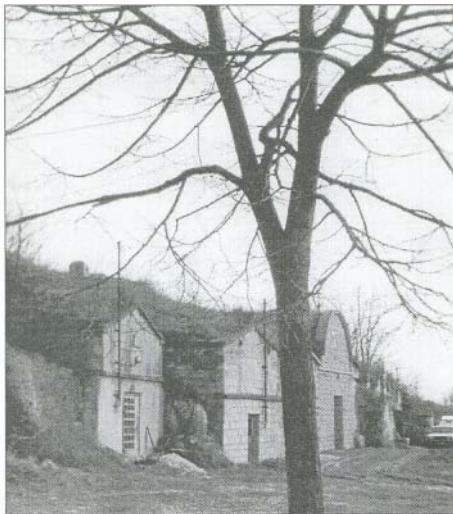
Pincesorai hangulat

A borfesztiválon borbemutatót, borárvést, borkiráltnyó választást, bortal énekversenyt, sokféle kulturális és sport programokat szervezünk, amelyekre minden érdeklődőt szeretettel várunk.