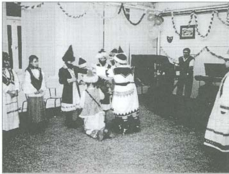
A fiatalok nagyszerű produkciókkal szórakoztatták a közönséget