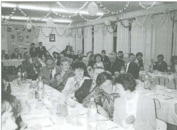
Mindenki jól érezte magát a rendezvényen

Ezután a tombola nyeremények kerültek kihúzásra. Itt szeretnénk megköszönni a tárgyi illctve a