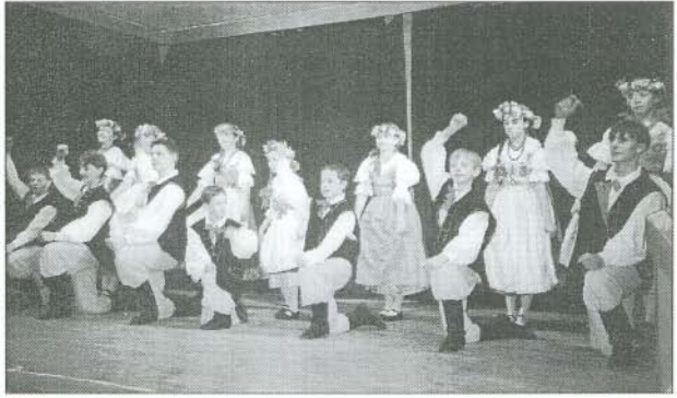
Színpadon a RYBNIKI PRZYGODA néptáncgyűttes

Február első napjaiban tíz napos „farsangi tánc-táborozásra” érkezett Bogácsra a Gwar formációs gyermek táncgyűttes Gliwiceből és a Przygoda néptáncgyűttes Rybnikből.