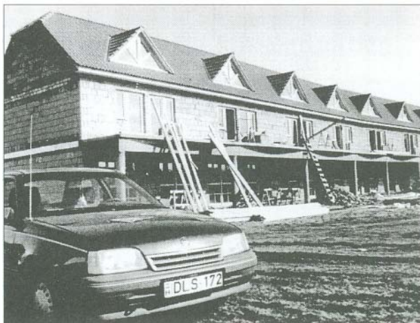
A fürdőben épülő új pavilonsor