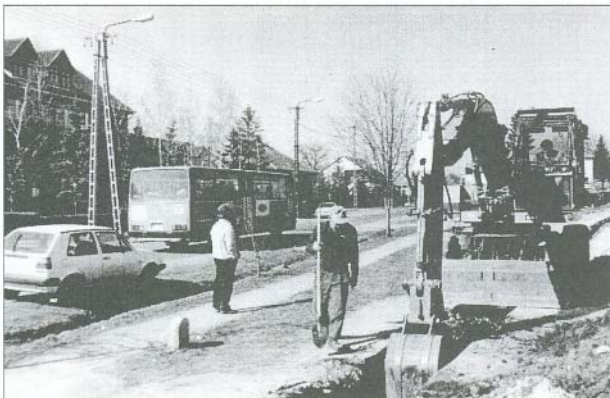
Legnagyobb beruházásunk a szennyvícsatorna építése

Szükséges a Fürdőben lévő vendégházban a bejárati ajtó cseréje, a medencék melletti járda felújítása. Erre 1.125 ezer forint áll rendelkezésre.