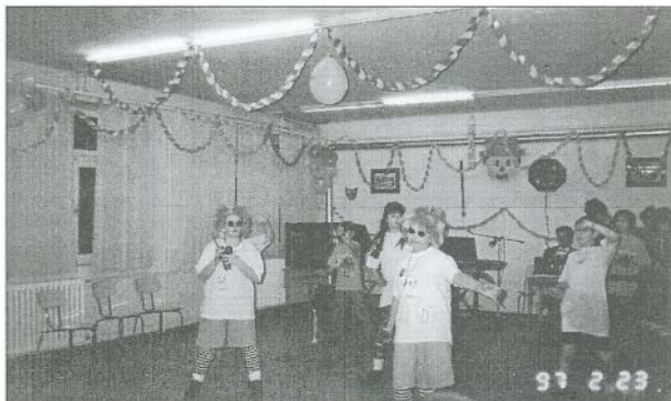
Az 5. osztály produkciója