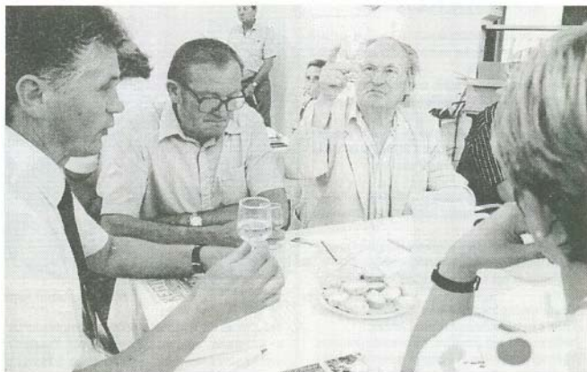
A tavaszi fesztivál két zsűrije bírálót közben