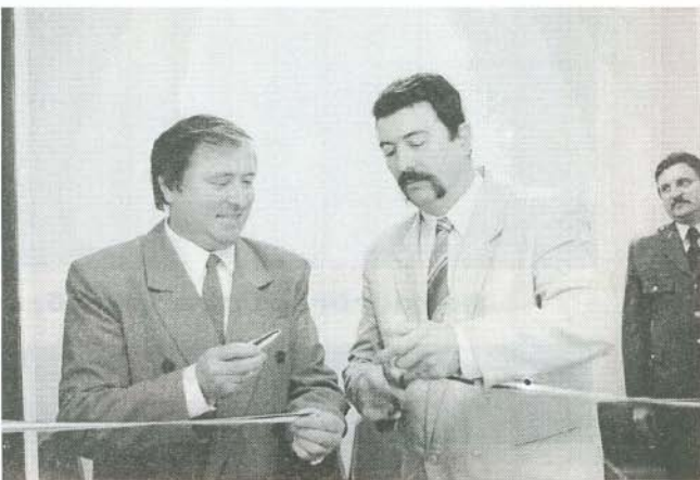
A rendőrsört Forgács László megyei főkapitány és Szajlai Sándor polgármester adták át

Állományunk létszáma 1+8 fős. A közelmúltban ebből a 8 főből 2 főt a Forgács László r. alezred iskolára elvezérségre vezényeltek, ugyanakkor a Mezőkövesdi Rendőrkapitányság vezetője egysegüket 1 fő nyomozóval megerősítette. Ennek is köszönhető, hogy az utóbbi időben felderítési mutatóink nőtt. A község bünyűi helyzetét elemezve elmondható, hogy kiemelkedő büncselekmény az eltelit időszak alatt nem történt, kibesért értéken elkovetett betöréses lopások áll meg bicikli-elutalajdonítások fordultak elő. A Mezőkövesdi Rendőrkapitányság területén a Bogácsi Rendőrsön valóult meg először, hogy a nap 24 órájában mindig van rendőr járőr. Ez az új szolgálati rendszer bevezetésének köszönhető. Úgy érezzük, rendőreink kapcsolata jó a lakossággal. Március 21-től április 1-jéig holland rendőrszolgálatok látunk vendéggel, akikkel közös szolgálatot teljesítettünk és szakmai tapasztalatcsere is megvalósult.