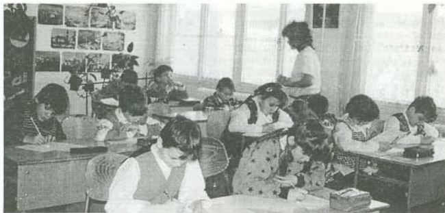
Verseny – feszült figyelemmel, koncentrációval.

4–5 éve az alsós tanulók számára nem rendeztek a közelben tanulmányi versenyt. Tavaly a mezőnyárádi verseny napján, a buszt lekésve, a több mint 2 kilométeres gyaloglás közben merült fel bennünk az ötlet, rendezzünk Bogácson tanulmányi versenyt az alsós tanulók számára. Igazgatóink személyében ötletünk támogatójára találunk. Az ő általa írt pályázat útján a Mecénás Alaptól 10 ezer forintot kaptunk a verseny megrendezésére.