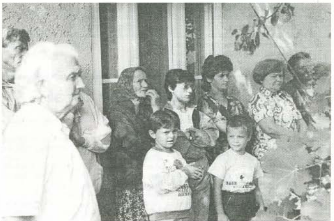
Csak összefogva érhetünk el nagy eredményeket