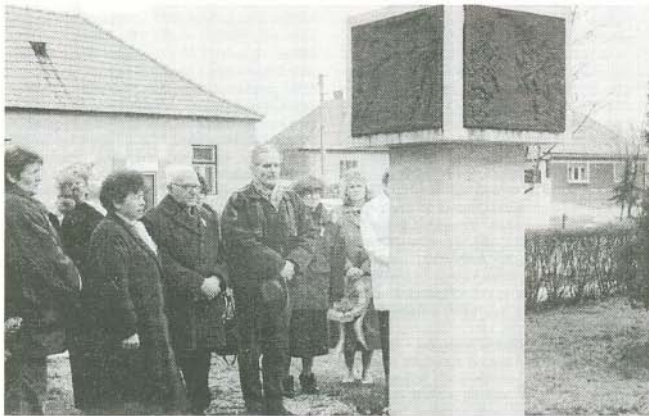
Koszorúzás a béke emlékművénél

Nemzeti ünnepünk, március 15-e alkalmából országsszerte koszorúzásokon, nagygyűléseken megemlékeztek az 1848–1849-es forradalom és szabadságharc 147. évfordulójáról.