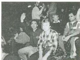
A közönség jól érzi magát

A helyi újság egy korábbi számban beszámoltunk már arról, hogy egy önszerveződő csapat, egy viszonylag rövid múltira visszatekinő sportágat úz, benevezett annak országos bajnokságába és felvállalta annak népszerűsítését. Hogy ismét hallhatjuk hangukat annak a következő okai vannak: