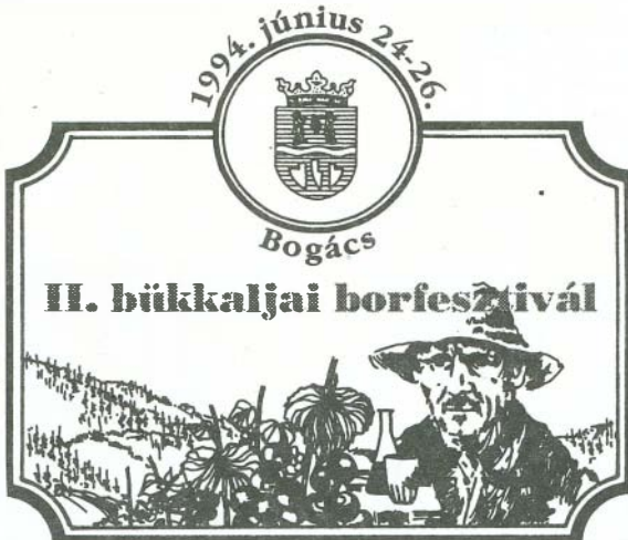
A borfesztivál emblémája. Tervezte, rajzolta Mezey István grafikusművész

Szóval itt, Bogácscon két évvel ezelőtt egy házi borversenyből kinőtt valami. Egy olyan kezdeményezés, amelyre egyre inkább oda kell figyelni. Már országosan is! Mi akkor, két évvel ezelőtt bízunk abban, hogy aki elsőnek lép a szőlészeti Naturlandon, a Bükkalján, az csatát nyer. Úgy érezzük: Bogács csatát