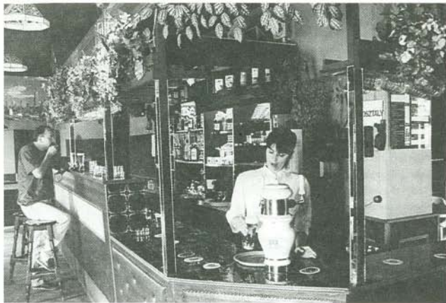
Belső tér az elegáns Flamingóból

1991 tavaszán megnyitottam a falu talán legkedveltebb szórakozóhelyét, a Flamingó Discó Sörözőt. Igyekeztem az üzleteltheséget úgy kialakítani, hogy a közel s távolról ide látogatók ha betér, jól érezze magát. Az első szezon, 1991 nyara igazán sikeresnek mondható, elkezeltésémet döntő többségében sikerült valóra váltani. A rutinalanságom számlájára írható, hogy az új szórakozóhely által messzebbre is ide vonzott fiatalságot, illetve annak túlzott lelkesedését, az abból adódó esetleges rendbontásokat nem mindig sikerült megfelelő mederben tartani.