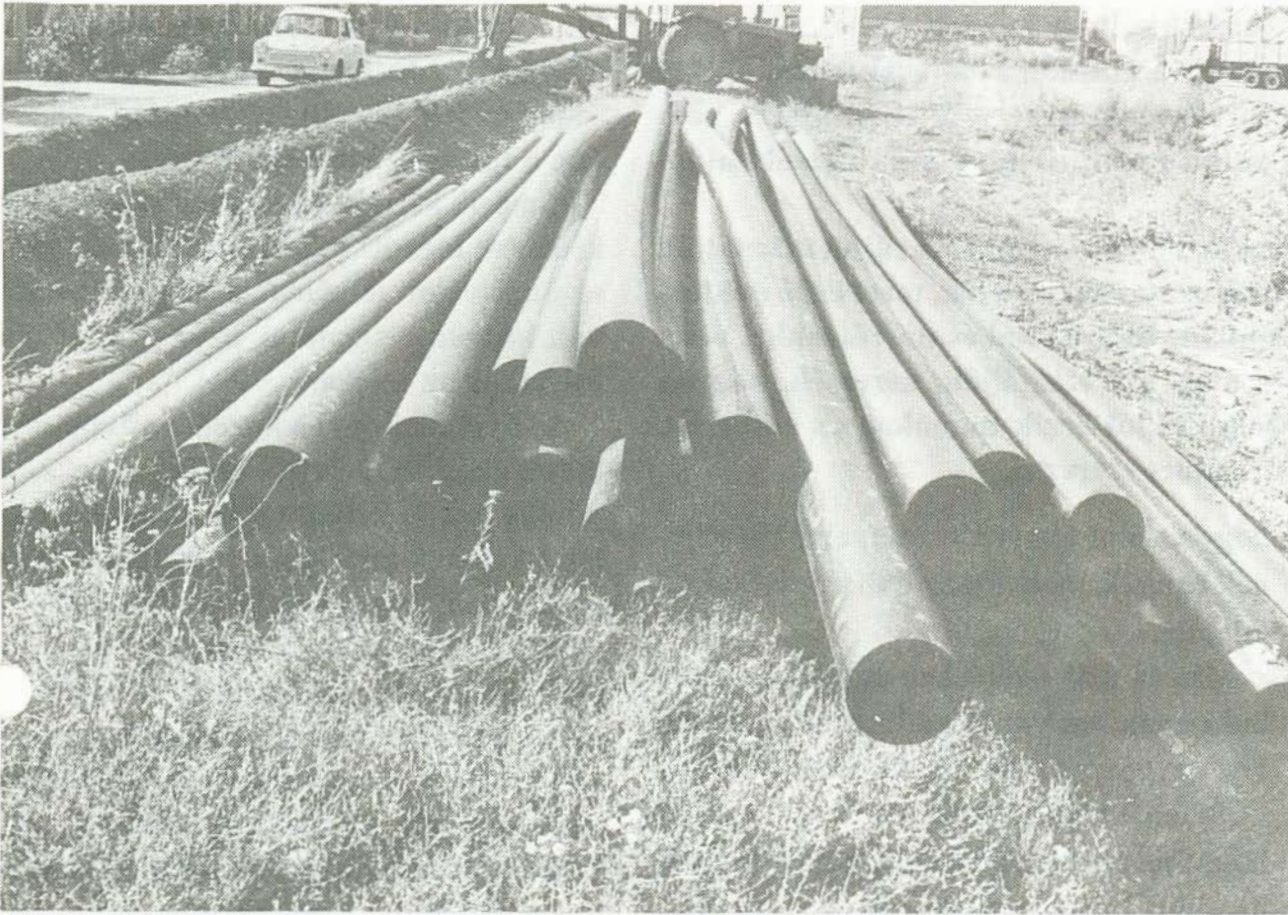
Megkezdődött a gáz- és vízvezeték-építés