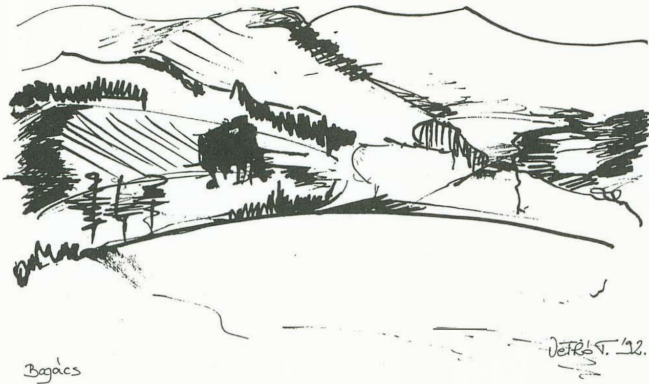
Vetró Tünde nyíregyházi tanárképző főiskolás rajza