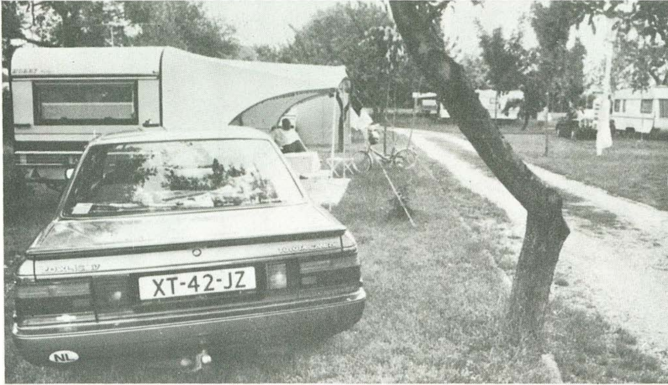
Bogácsot már régen felfedezte Nyugat-Európa. Németek, hollandok, belgák, osztrákok különösen nagyszámban keresik fel községünket

1974-ben kezdődött meg a bogácsi Strandfürdő számára a „gazdaváltások” sorozata.