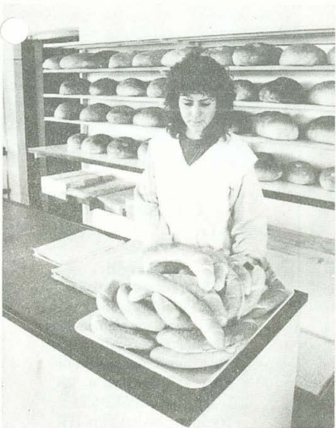
Kenyér, kifli eladó egyaránt a szép Rákóczi utcai ABC-ben